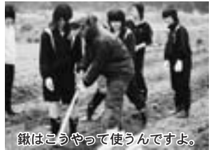
鍬はこうやって使うんですよ。

体験学習となり、全校生徒で栽培、収穫したジャガイモは、町の福祉施設や一人暮らしのお年寄りなどに、毎年プレゼントして喜ばれています。 今年も町の産業担当の職員を講師に、ジャガイモの植え方の指導を受けながら作業をし、生徒たちは、200キロの種イモを手分けし、今年の豊作を願いながら、植えていきました。