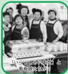
「いらっしやいませ」と看板娘たちが？