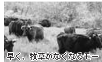
早く、牧草がなくなるモー