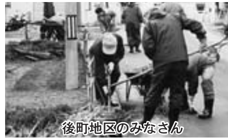
後町地区のみなさん

今年は雪どけも早く、新緑が美しい季節になり、各町内会や地区による、春の大掃除を行い、側溝の土砂上げや空き缶などのゴミ拾いが行われました。