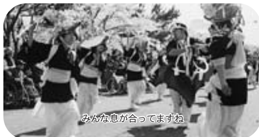
みんな息が合ってますね