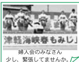
婦人会のみなさん少し、緊張してませんか？