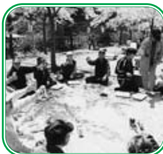
みんな一緒に・・・カンパ〜イ今日はトコトン飲むぞ！ 'ピース'