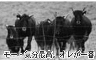
モー・気分最高。オレが一番