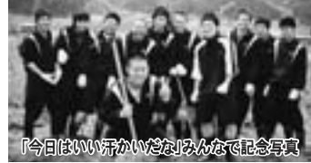
「今日はいい汗かいたな」みんなて記念写真