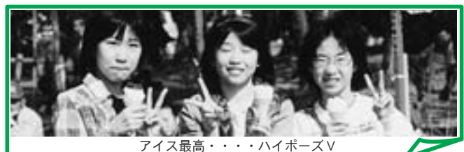
アイス最高・・・ハイポーズV