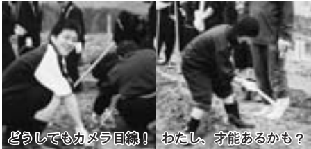
どうしてもカメラ目線！ わたし、才能あるかも？

体験学習となり、全校生徒で栽培、収穫したジャガイモは、町の福祉施設や一人暮らしのお年寄りなどに、毎年プレゼントして喜ばれています。 今年も町の産業担当の職員を講師に、ジャガイモの植え方の指導を受けながら作業をし、生徒たちは、200キロの種イモを手分けし、今年の豊作を願いながら、植えていきました。