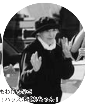
おらっけもわけものさまだまだまげでねど！ハッスルはあぢやん！