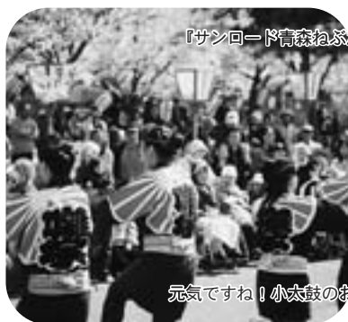
元気ですね！小太鼓のおにいさん。