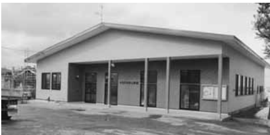
今別町中央公民館がリニューアルオープン