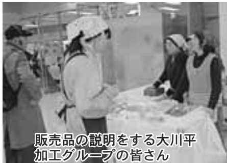
販売品の説明をする大川平加工グループの皆さん

また郷土芸能実演会では、青森県民俗無形文化財に指定されている「大川平荒馬」を、大川平子供会の皆さんが披露し、会場に集まった大勢の観客からさかんな拍手が送られていました。