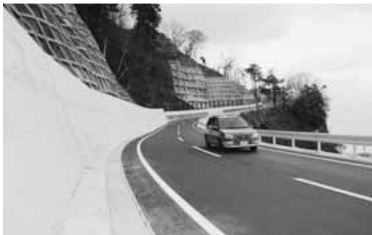
通称七曲りの道路が改良され車はスムーズに通行できるようになりました。