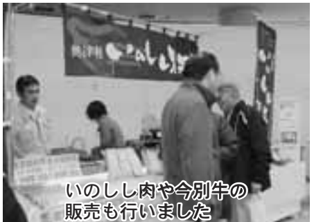
いのしし肉や今別牛の販売も行いました