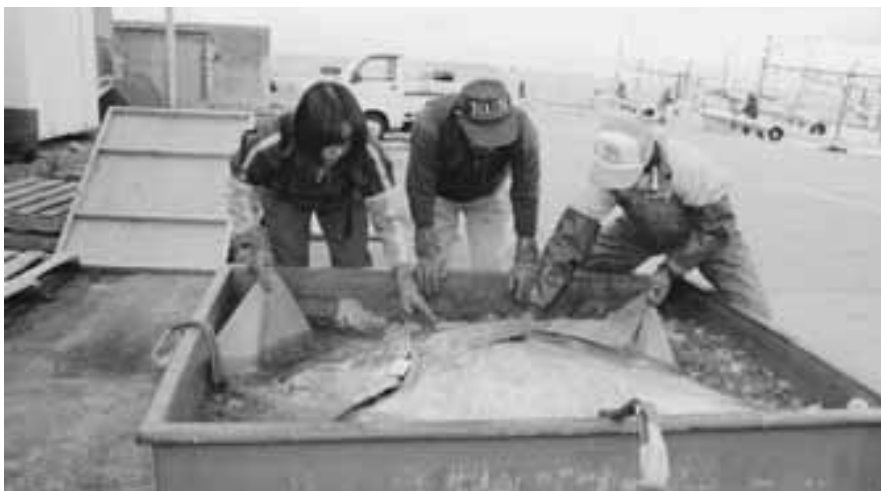
11月中旬からマグロ釣りが大漁で、最大は325キロでした。