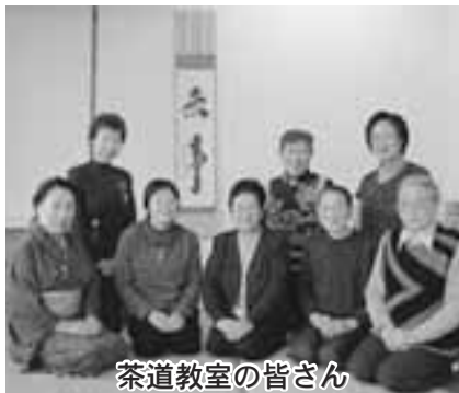
茶道教室の皆さん

12月に入り、リニューアルされた今別町中央公民館で、公民館講座が活発に行われています。「茶道教室」の皆さんは、明るくなった和室でお茶の稽古を行いました。改修期間中は、先生のお宅で稽古をしていたというので、久々に公民館に教室の皆さんが勢ぞろいしました。また、二股婦人会の方々はこれから発表する踊りの稽古に余念がありませんでした。