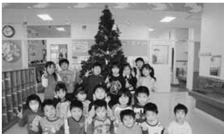
今別保育園(三笠苑)でクリスマスを心待ちにツリーに飾り付け