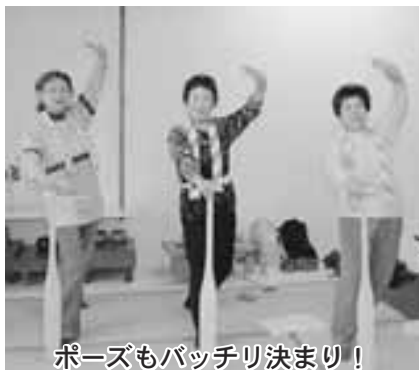
ポーズもバッチリ決まり!