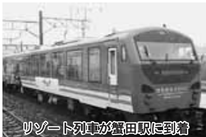
リゾート列車が蟹田駅に到着