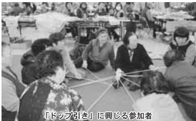
「ドップ引き」に興じる参加者

12月6日、開発センターにおいて今別町社会福祉協議会（太田邦彦会長）主催の第26回今別町総合福祉展が開催されました。この福祉展は、町民に福祉の実態・現状を理解していただき、地域の福祉の推進に役立てるために行われています。会場には、「今別の味展」として海・農産物や家庭料理、保存食やしめ縄等の展示・即売が行われ、訪れた人々が買い求めていました。さらに、手芸品、七宝焼アクセサリー、水墨画や福祉活動の写真など多くの作品が展示されました。また、歳末たすけあいチャリティー特別企画として「ドップ引き大会」やつがる海峡ちゃか親童北天舞悠の「よさこいソーラン」が行われました。アトラクションでは自慢のカラオケや踊りなどが披露され、時折雪が降る寒い一日でしたが、会場内は熱気と笑いにあふれていました。