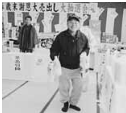
商工会の大抽選会で景品が両手いっぱいになり(1月10日)