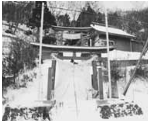
奥平部稲荷神社の大しめ縄