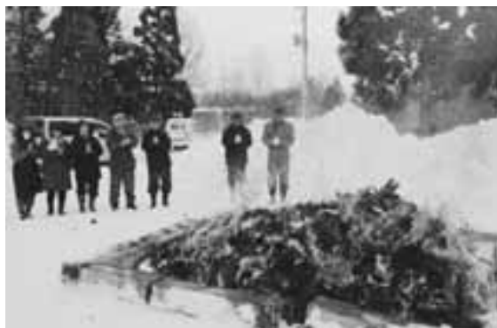
新年恒例の「どんど焼き」で無病・息災を祈る人々。健康な1年でありますように。(1月14日)