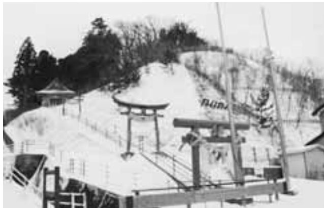
3つの鳥居と73の階段は砂ヶ森稲荷神社