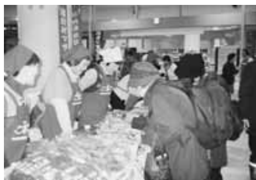
かぼちゃ餅を試食してから買います

元気なかつちやの味自慢。うで自慢。第15回元気なかつちやの味自慢・うで自慢が1月16日、17日の2日間、県観光物産館アスパムイベントホールで開催され、東青地区の名産品や加工品などを一堂に集め、27団体が参加して販売しました。