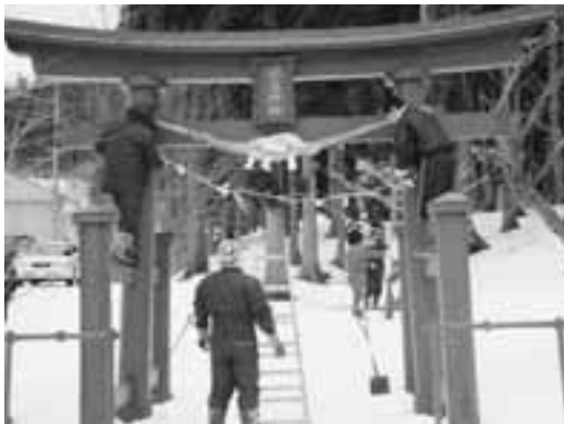
二股地区青・壮年会の皆さんが稲荷神社にしめ縄を奉納。