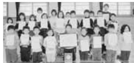
表彰された児童たち