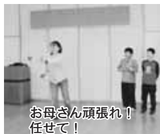
お母さん頑張れ!任せて!