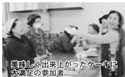
美味しく出来上がったケーキに大満足の参加者

12月17日、荒馬の里活性化センターで「まっしぐら」の米粉を使ったケーキ作りの実習教室が開催され、20名の参加者がありました。講師は商品化技術研修を終えた活性化センターの職員が務め、米粉を使うことにより、米の消費拡大につなげたいとのねらいからケーキ作りに挑戦しました。 調理の中でも「メレンゲ」がケーキの仕上がりを決めるとあって、参加者は講師の指導で熱心に泡立てていました。出来上がったメレンゲを卵黄生地に加え型入れして予熱したオーブンに入れ45分間焼きます。4班編成した参加者は、出来上がった作品が一番美味しいと満足気な様子で、家でも作ってみたいと意気込んでいました。