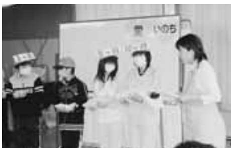
胎児の成長を手に取り実感!

いのちのお話プロジェクト「あかり」のメンバーの助産師が今別小学校を訪れ、「いのちのお話出前講座」を開催しました。