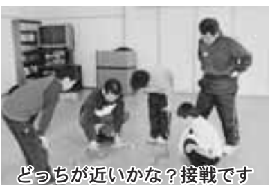
どっちが近いかな?接戦です