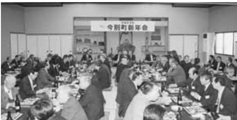
町の新年会で2010年の抱負を語りあう参加者(1月15日)