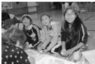
全校児童にあげる紅白のお餅を作ってます

今別小学校の5年生は、5月に田植えをし10月に収穫したお米で餅つきを行いました。 体育館に2つのウスを準備し、「よいしょ、よいしょ」の掛け声とともにキネを振り下ろして行きました。