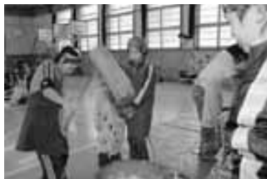
キネは重いけど頑張りました!