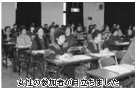
女性の参加者が目立ちました

発行/青森県今別町 編集/総務課企画担当 ☎ 0174(35)2001 FAX 0174(35)2298 今別町ホームページアドレス http://www.imabetsunet.pref.aomori.jp