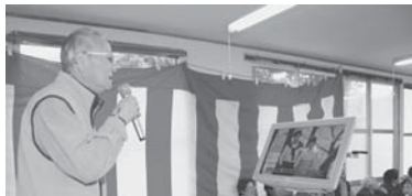
新しい音響セットで気持ち良く歌い、皆さんご機嫌でした。