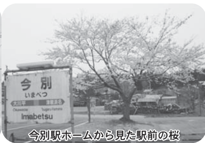
今別駅ホームから見た駅前の桜