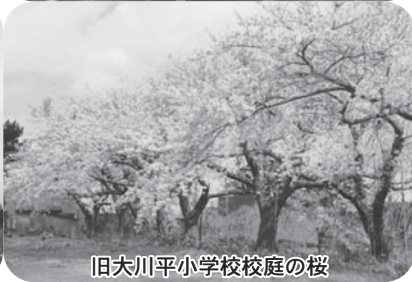
旧大川平小学校校庭の桜