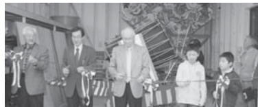
町長、町内会長、子ども会代表がテープカットし、ねぶた小屋新築落成を祝いました。

4月29日、八幡町町内会では地区の総会とあわせて町内会観劇会（かんごかい）を開催しました。 老人クラブ会員、町内会員など約50人が参加し、雨のため地区の集会所「童里夢（どりーむ）」内での開催となりましたが、会場では22年度のコミュニティ助成事業で整備した音響設備を使って会議の進行を行い、カラオケなどで会員の交流を深めました。 整備された音響設備は今後夏まつりや忘年会・新年会など、町内会の行事で大活躍しそうです。 そして会員の一層の親睦が図られるものと期待されます。 またこの日は、「童里夢」の隣に21年度の地域活性化・経済対策臨時交付金で建設した「ねぶた小屋」の新築落成も祝いました。