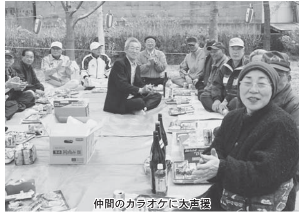
仲間のカラオケに大声援