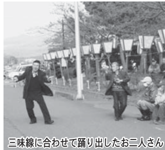
三味線に合わせて踊り出したお二人さん