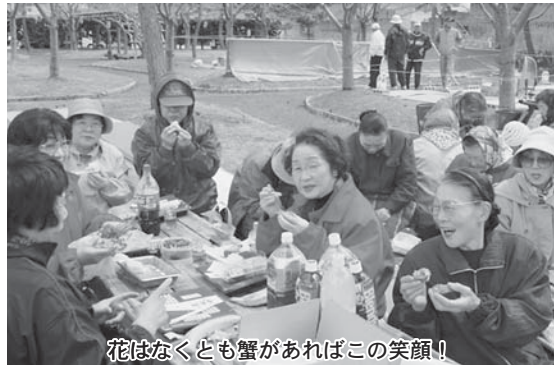
花はなくても蟹があればこの笑顔!