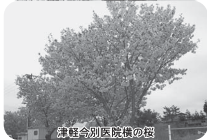
津軽今別病院横の桜