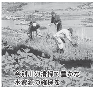
今別川の清掃で豊かな水資源の確保を