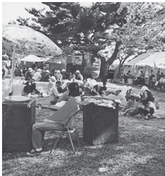
観音様で行われた桜まつりの様子です。

その後、桜まつりは平成9年から平成17年までは八幡町の「海峽あすなろ公園」に会場を移し、現在の「さざなみ公園」で行われるようになったのは平成18年からです。祭りの呼び名も「海峽いまべつ春まつり」と変わりました。 上磯一「ハイカラな町」といわれた今別。目をとじると思い出されるのはどんな花見光景でしょうか。そして、どんな桜風景が心に残っているのでしょうか。