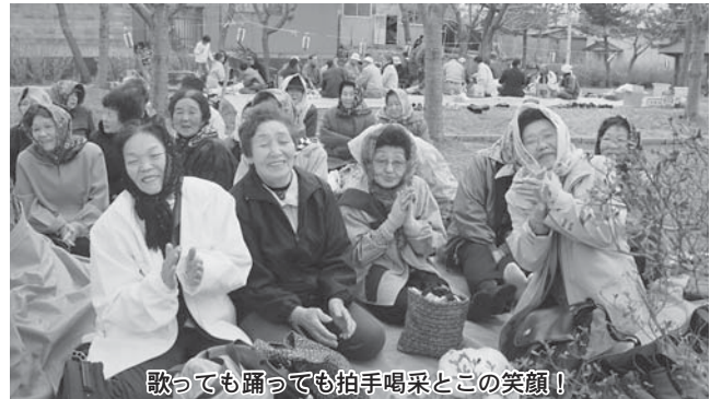
歌っても踊っても拍手喝采とこの笑顔!