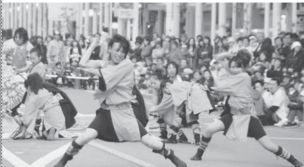
北天舞悠の躍動感あふれる演舞は大観衆を魅了しました

5月4日、今別町のよさこいグループ「つがる海峡ちやか親童・北天舞悠」が青森市で開催された青森春フェスティバルに参加し、豪快な演舞を披露しました。 5回目の開催となるフェスティバルには県内外のグループ31団体（850人）が参加し、青森市新町通りでねぶたとよさこいの豪華競演を行い、詰めかけた大勢の観客を魅了し、商店街を祭り一色に染めました。