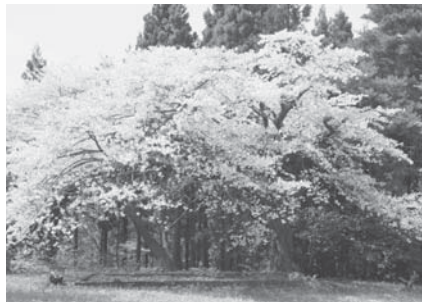
観音様の桜。時代の流れを見つめいまでも静かに咲いています。(平成22年5月18日撮影) 皆さんの心に残っている桜風景ではないでしょうか。