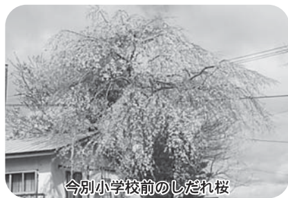
今別小学校前のしだれ桜