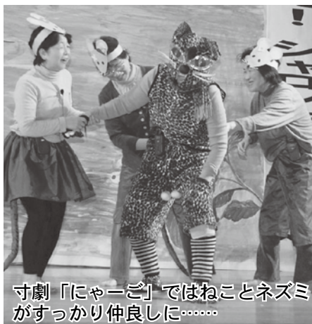
寸劇「にゃーご」ではねことネズミがすっかり仲良しに……