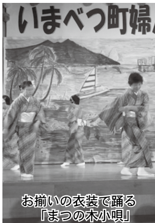
お揃いの衣装で踊る「まつの木小唄」