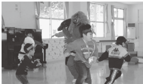
鬼に追いかけられ走り回る園児たち