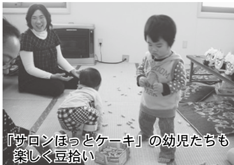
「サロンほっとケーキ」の幼児たちも楽しく豆拾い

節分の2月3日、高野山「観音堂」(今別 本町)恒例の「節分祈願会(せつぶんきがんえ)」が行われました。観音堂には約30人が参集し家内安全・交通安全を祈願した後、一年の無病息災を願い豆まきを行いました。 また、今別保育園の豆まきでは、赤鬼、青鬼があらわれて園児たちを追いかけると、泣きながら逃げ回る子ども達の姿が見られました。しかし、園児たちは懸命に鬼に豆を投げつけ外へ追い出し、鬼たいじ成功に歓声を上げていました。さらに、中央公民館では、子育て中のグループ「サロンほっとケーキ」の皆さんが、鬼のお面作りと豆まきを行い、子どもと一緒に楽しい節分の日を過ごしました。 節分の翌日が立春。「鬼は外、福は内!」と豆をまき、年の数だけ豆を食べる風習は春を呼ぶ行事でもあります。