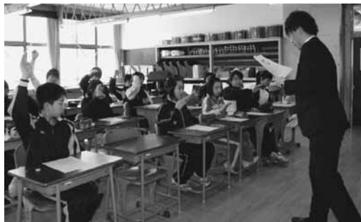
「税金にはどんな種類があるかな？」の質問に児童は積極的に答えました。