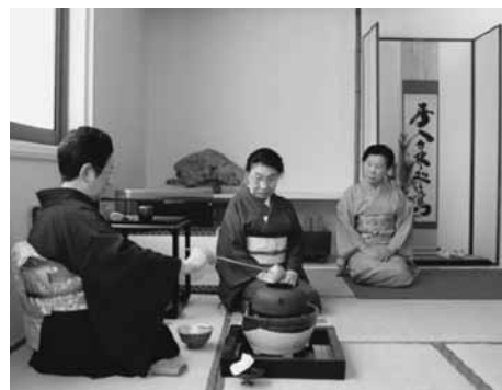
1月19日、公民館講座の「茶道教室」の皆さんが和服姿で初釜を行いました。