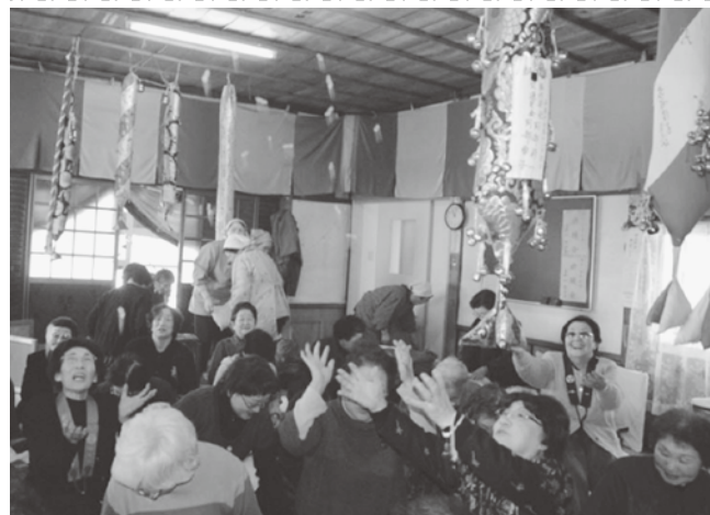
観音堂で豆を拾うため手をのばす参集者

節分の2月3日、高野山「観音堂」(今別 本町)恒例の「節分祈願会(せつぶんきがんえ)」が行われました。観音堂には約30人が参集し家内安全・交通安全を祈願した後、一年の無病息災を願い豆まきを行いました。 また、今別保育園の豆まきでは、赤鬼、青鬼があらわれて園児たちを追いかけると、泣きながら逃げ回る子ども達の姿が見られました。しかし、園児たちは懸命に鬼に豆を投げつけ外へ追い出し、鬼たいじ成功に歓声を上げていました。さらに、中央公民館では、子育て中のグループ「サロンほっとケーキ」の皆さんが、鬼のお面作りと豆まきを行い、子どもと一緒に楽しい節分の日を過ごしました。 節分の翌日が立春。「鬼は外、福は内!」と豆をまき、年の数だけ豆を食べる風習は春を呼ぶ行事でもあります。