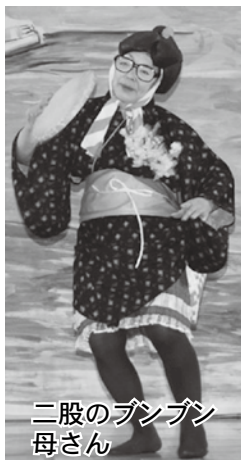
二股のブンブン母さん