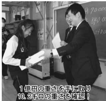
1億円の重さを手に取り10.2キロの重さを確認！

税金について勉強した6年生は、「税金を払いたくないと思っただけ、税金は大切なものだと思います。」「税金のことを考えながら買い物したい。」などの感想を寄せていました。