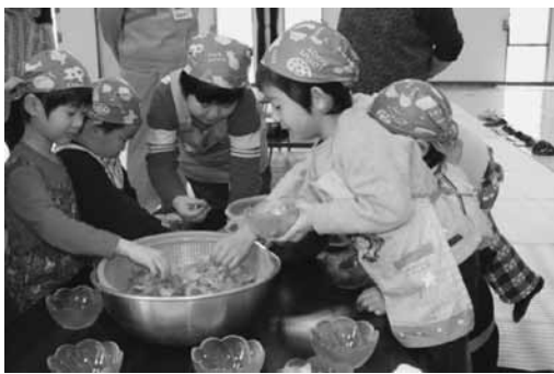
園児たちがサラダを盛り付け！

この日のメニューは「デコレーションずし」、「すまし汁」、「サラダ」にデザートは「ミルクゼリー」と盛りだくさんでした。「デコレーションずし」は、園児たちが容器に錦糸卵を敷いてすし飯を半分詰め、その上にさやえんどうを乗せて残りのすし飯を詰めました。それを保護者がひっくり返して容器から出し、その上に残りのさやえんどうや、人参などを飾りました。まるでケーキのような色どりの押しずしの出来上がり。園児も保護者も大歓声をあげました。サラダもデザートも、自分たちが作って盛り付けしたものはすべておいしく、みんな喜んで食べました。