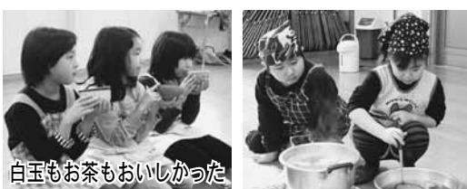
白玉もお茶もおいしかった

2月19日に公民館子ども教室（こどもりの会担当）では、「ピンクと白の白玉おしるこ」を作り、一足早いおひなまつりを行いました。お抹茶のいただき方も教えてもらい、お行儀よくお茶を飲み大満足の様子。 その後、シャロンさんとフラダンスを踊り、楽しく過ごしました。