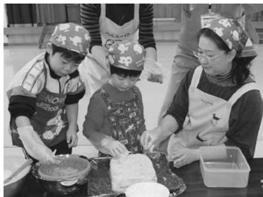
仕上げに錦糸卵をちらします。