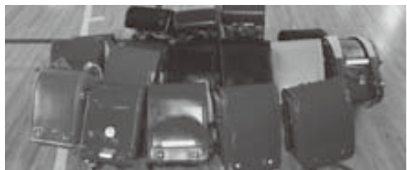
被災地へ寄付されたランドセル

今別小学校卒業生の保護者や町民の方々から寄せられたランドセル。東日本大震災の被災地へ寄付いたしました。