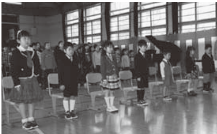
入学式では緊張しているようです・・・。