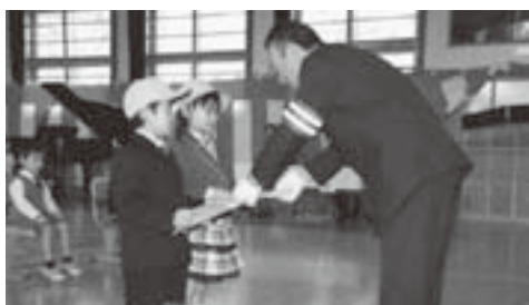
新入生には黄色い帽子と、ランドセルカバーが贈られました。

4月7日、今別小学校で入学式が行われ、父母と共に真新しいランドセルを背負った新一年生が学校にやってきました。 今年度の新入学児童7名を紹介します。