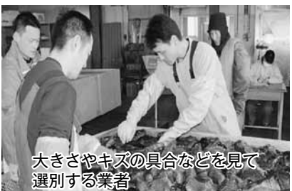
大きさやキズの具合などを見て選別する業者

今年のナマコ漁は、3月1日から始まる予定でしたが、悪天候のため、例年よりかなり遅い3月27日になりました。朝7時半から漁に出た漁師たちが、箱いっぱいナマコを抱えて漁港に押し寄せます。初日の水揚げは3トン。例年並みの大きさで業者を引き取られました。