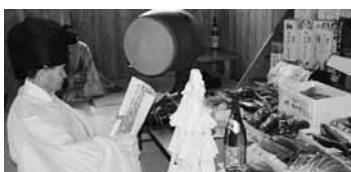
宮司の祝詞が神聖に響いていました

その後、地区の神社でタイヤソイ、タコ、メバル、マスなどのたくさんの海の幸を奉納し、地区の方々が30人程参加し、大漁を祈願しました。