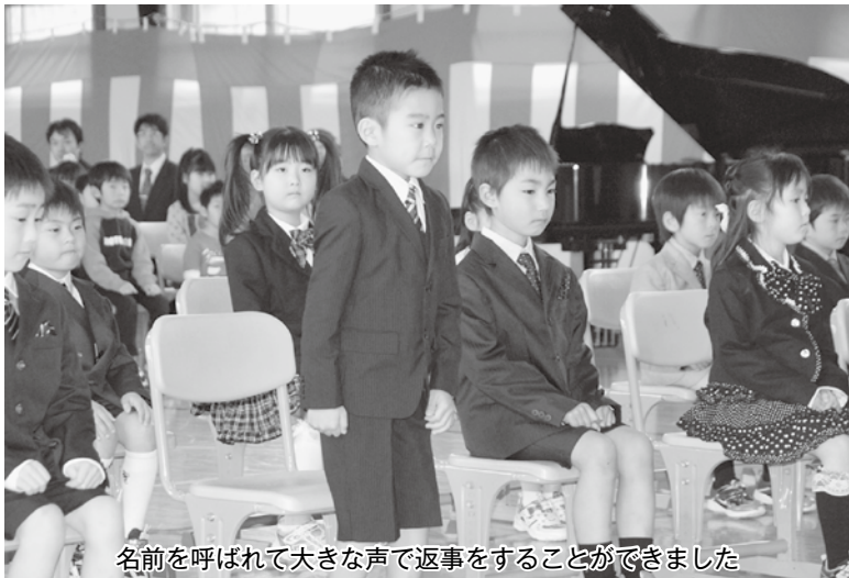
名前を呼ばれて大きな声で返事をすることができました

発行/青森県今別町 編集/企画課 ☎0174(35)3012 FAX 0174(35)2298 今別町ホームページアドレス http://www.town.imabetsu.lg.jp/