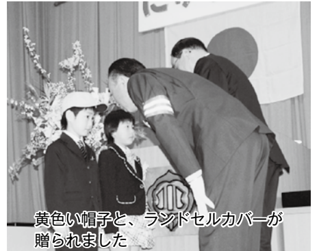
黄色い帽子と、ランドセルカバーが贈られました