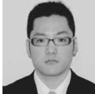
義明 大馬 教育委員会