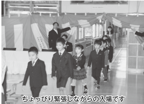
ちょっぴり緊張しながらの入場です