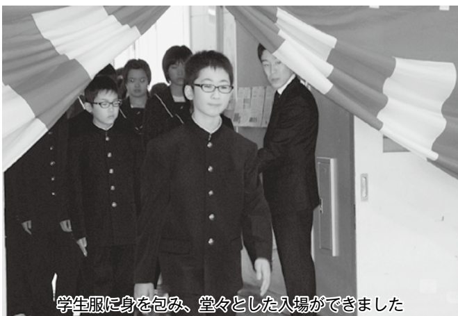
学生服に身を包み、堂々とした入場ができました

今別中学校入学式 4月8日午後には今別中学校でも入学式が行われました。今年には19名の新入生が入学しました。学生服に身を包んだ新一年生は、在校生の先輩方が見守る中、緊張しながらもしっかりとした足取りで式場に入場しました。皆さんの目には、それぞれの目標を見据えた意気込みを感じました。