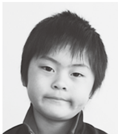
小鹿 学海くん (まなか) 消防士