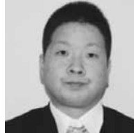
裕貴 嶋中 広域消防事務組合