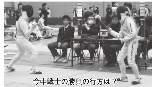
今中戦士の勝負の行方は？