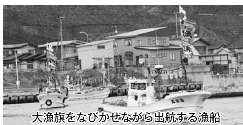
大漁旗をなびかせながら出航する漁船

4月6日(土) 砂ヶ森地区に於いて海上安全大漁祈願祭が行われました。午前9時から13隻の船が大漁旗をなびかせながら大海原へ出航し、海の安全を祈りながら海上を運行しました。