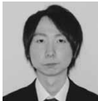
剛広 梅田 町民福祉課