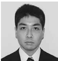
奨 嶋中 広域消防事務組合

一日も早く町の顔になり、町民の皆さまの役にたてるように頑張ります。よろしくお願ひします。