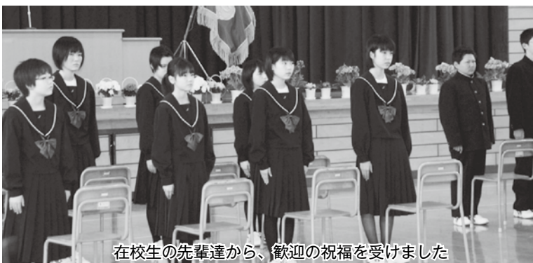
在校生の先輩達から、歓迎の祝福を受けました

今別中学校入学式 4月8日午後には今別中学校でも入学式が行われました。今年には19名の新入生が入学しました。学生服に身を包んだ新一年生は、在校生の先輩方が見守る中、緊張しながらもしっかりとした足取りで式場に入場しました。皆さんの目には、それぞれの目標を見据えた意気込みを感じました。