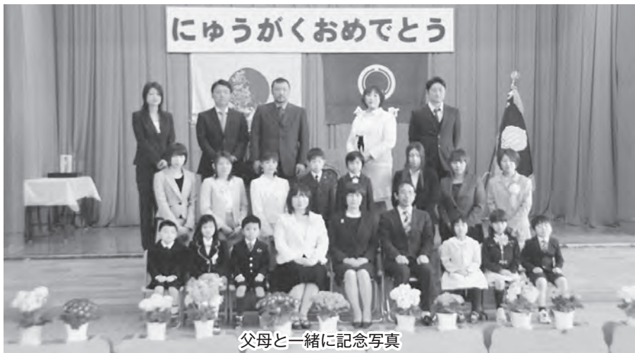
にゆうがくおめでとう