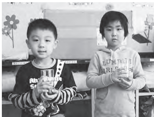
ありがとうございます！

大川平荒馬工房さんから小学校に入学した新1年生へコップが贈られました。荒馬のキャラクター、「あらまくん」と「たずなちゃん」のかわいいイラスト入りのコップで、さらに、新入生の名前も入っているというから驚きです。世界に一つしかない自分だけのコップなので、一生の宝物になると間違いありません。