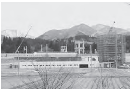
県道から見た奥津軽いまべつ駅