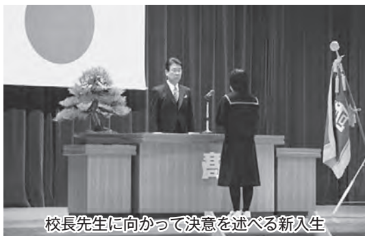
校長先生に向かって決意を述べる新入生

青森北高今別校舎では、5人が入学しました。少ない人数で、これから始まる学校生活に不安があるように見えましたが、心身ともにだんだん大人になっていく生徒たちに期待したいと思います。