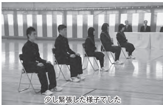
少し緊張した様子でした

今別中学校では午後から入学式が行われました。穏やかな天気の下、12人を迎え入れるようなさわやかな風が吹いていました。小学生から少し大人になった生徒たちの表情からは、勉強や部活動に一杯取り組み、充実した中学校生活を送ろうという気持ちが伝わってきました。