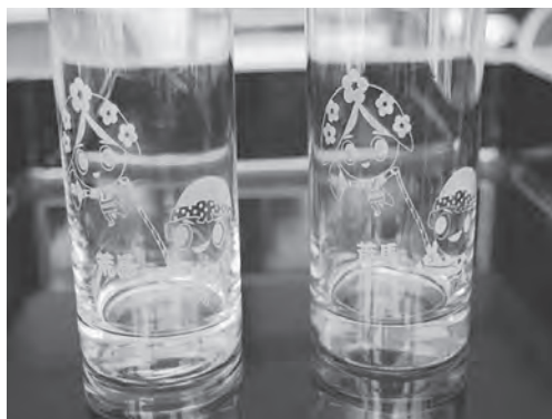
かわいいデザインです！