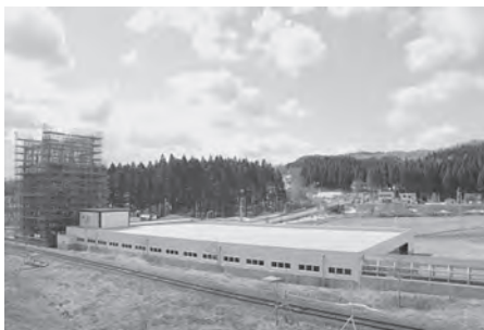
駅のホームから見た景色