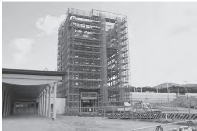
奥津軽いまべつ駅開業へ向け着々と工事が進められています

(開業までのカウントダウンにつきましては、開業日が未確定であることから、平成28年3月31日を仮基準日として算定しています)