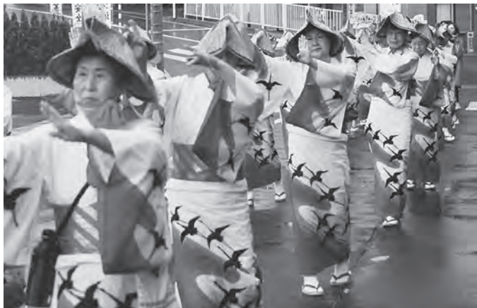
しなやかで華麗な流し踊り