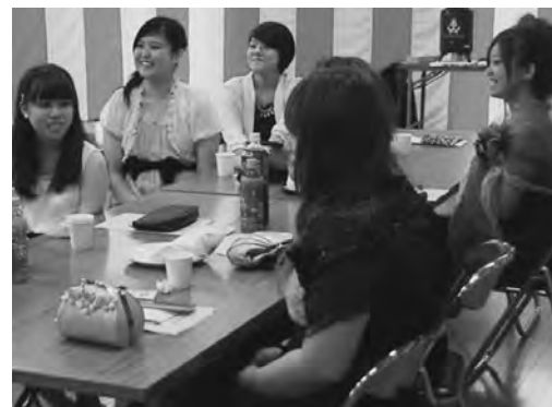
懐かしい中学校時代の思い出を語り合っています