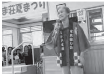
カラオケで美声を披露！