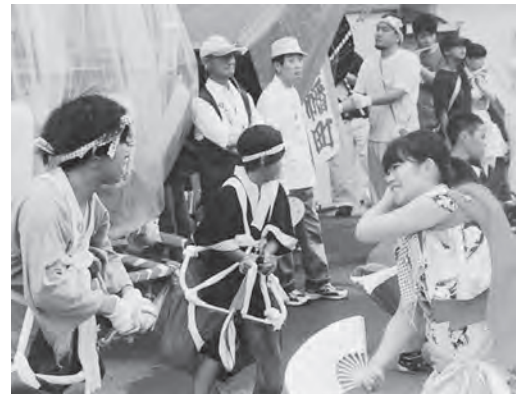
観客を魅了する荒馬！