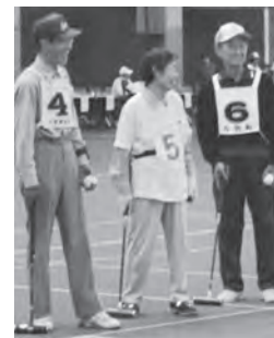
大活躍の今別町チームのみなさん