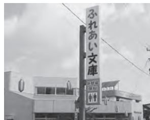
ふれあい文庫でお待ちしています

ふれあい文庫の看板が新しく設置され、カラフルで遠くからも目立つようになり、トイレ案内、休憩所案内がデザインされ、休憩スペースも広くなりました。