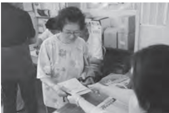
商品券を求める町民の方々にぎわっていました

8月11日、今別町商工会など町内5か所において、毎年好評の「いまべつ町共通商品券」が販売されました。この商品券は20%のプレミア付で大変お得なため、多くの町民の方が求め長蛇の列ができました。