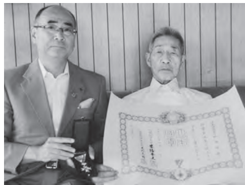
阿部町長（左）と坂本氏