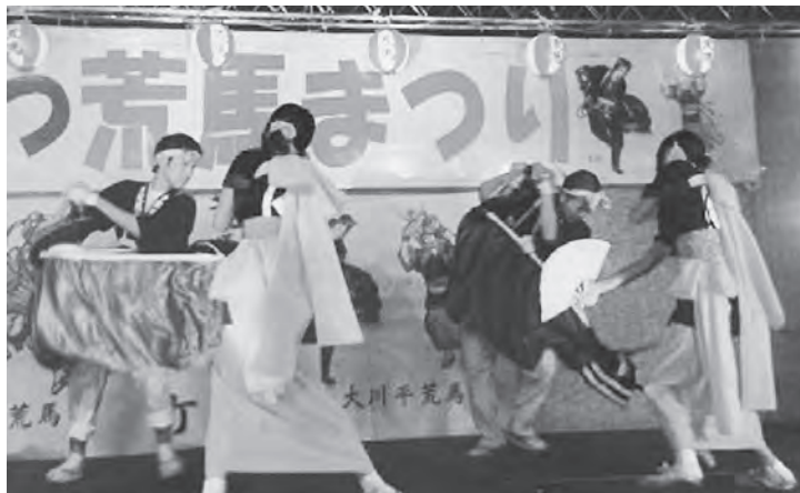
迫力ある荒馬に歓声が上がりました