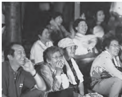
楽しいイベントにニコリ！