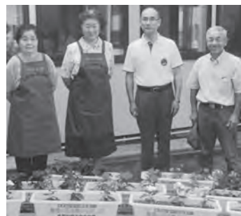
きれいな花と記念撮影！