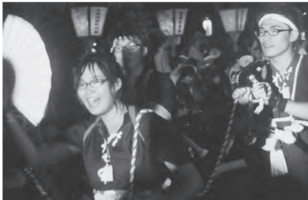
県外から参加した大川平荒馬の演舞に会場からアンコールが！