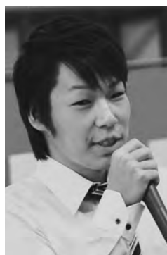
仲間たちへ近況報告!