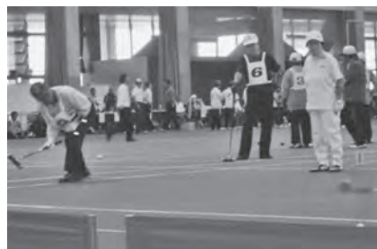
狙いをさだめて、正確なショット!

予選リーグを順調に勝ち抜き決勝トーナメントに進んだ今別町チームは、日頃の練習の成果を十分に発揮し、確実に点を決め見事8位入賞しました。