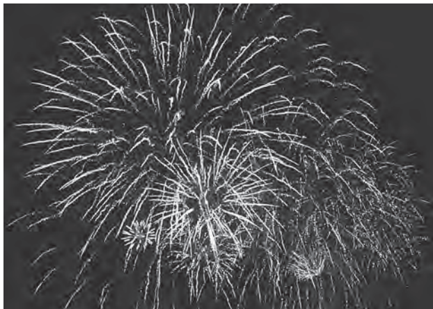
夏を彩る鮮やかな花火！