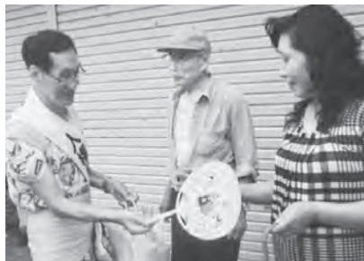
人権擁護委員の方も参加してくれました「あらまくん」、「たずなちゃん」も参加 木古内町から「キーコ」も応援