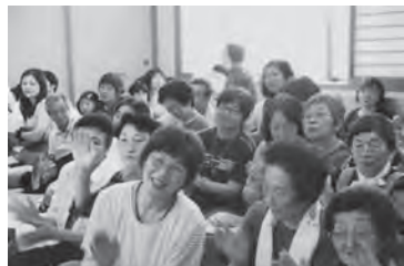
会場のみなさん大盛り上がり！

7月27日、なかやま荘において夏祭りが開催されました。多くの町民の方やなかやま荘の方が集まり、大川平荒馬の披露や美声を披露したカラオケ大会、楽しくみんなでダンスなどが行われ、笑顔が絶えないにぎやかな楽しい夏祭りとなりました。