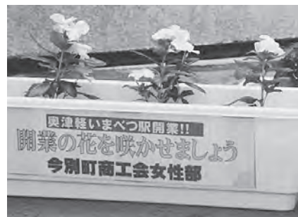
きれいな花が咲いています