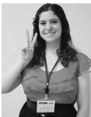
これからよろしくお願いします!