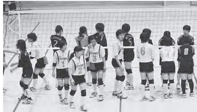
県大会でも心に残る試合をした今別中学校バレーボール部のみなさん(写真奥)