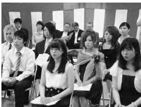
これからの担う今別の新成人たち!