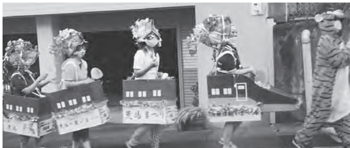
津軽今別医院・津軽サポートのみなさんが、10両編成の新幹線の仮装で盛り上げてくれました