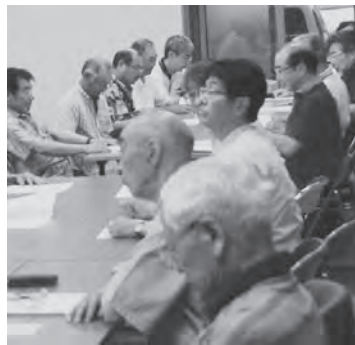
これからの活動内容を聞く出席者のみなさん

今別町退職者親交会では、これから地域社会の福祉の増進や地域の発展を目指すことを目標に活動していきます。