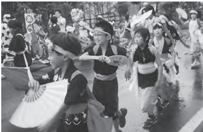
子供たちも元気よく参加しました