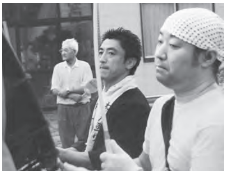
会場に鳴り響く豪快な音！