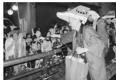
新幹線の被り物は人気がありました!

8月6日、「青森ねぶた祭り」に参加し、県職員のみなさんと一緒に、「奥津軽いまべつ駅」開業をPRしました。今回は、県東青地域域民局長が手作りした新幹線の模型をかぶってPRを行ったことから、沿道を埋め尽くした観客の皆さんから大きな注目を集めることができました。