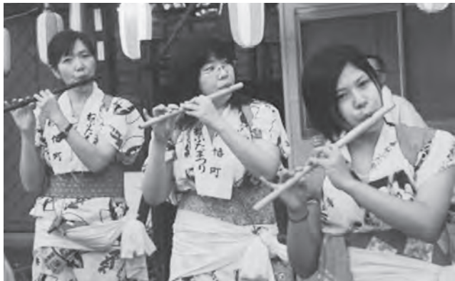
荒馬の世界へ誘う笛の音色！