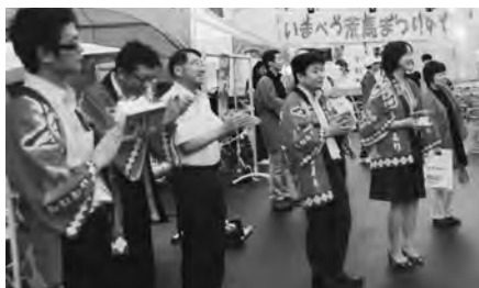
県、道、道南の市町村等の職員と一緒にPR!

8月4日、「荒馬まつり」（主催：今別町観光協会）に参加し、町職員が、県、道、道南の市町村等の職員と一緒に北海道新幹線開業をPRしました。