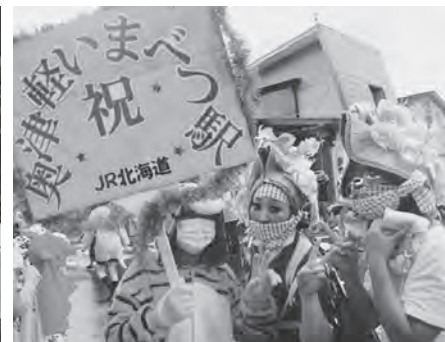
バケトも参加。あなたはだ～れ？