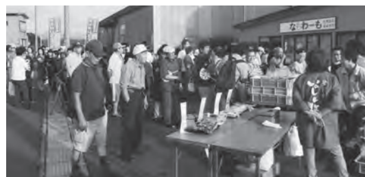
多くの人でにぎわいました

早朝からの開催にもかかわらず帰省客や町民の方が多く集まり、ホタテやホヤ、生干しイカ、いのしし肉などを求め長い列ができ、大いににぎわいました。