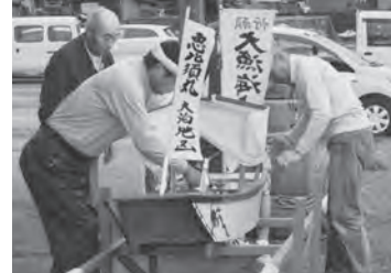
大漁になりますように...