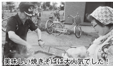
美味しい焼きそばは大人気でした！