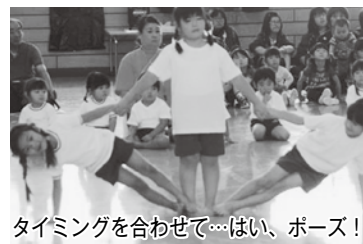
タイミングを合わせて…はい、ポーズ！