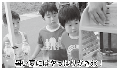
暑い夏にはやっぱりかき氷！