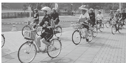
新幹線の被り物は遠くからも目立ちました！

8月24日、青森県新総合運動公園（青森市）で開催された「ママチャリ6時間耐久レース」に参加し、県職員の皆さんと一緒に、「奥津軽いまべつ駅」開業をPRしました。