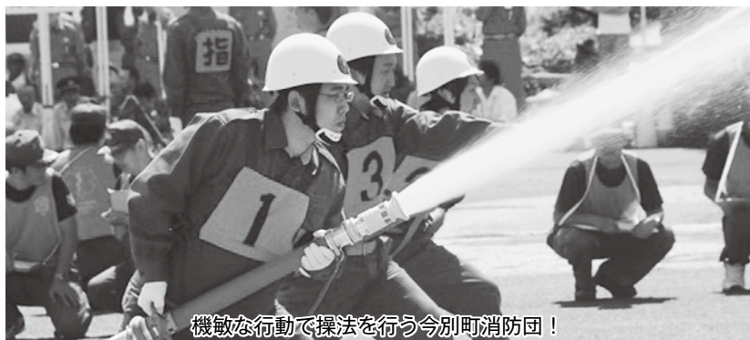
機敏な行動で操法を行う今別町消防団！

機敏な動きで操法を行った今別町代表の選手たちに、応援に駆けつけた今別町消防団の皆様や他の市町村消防団から大きな拍手が送られました。