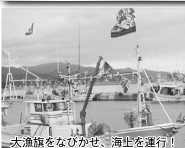
大漁旗をなびかせ、海上を運行！