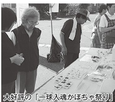
大好評の「一球入魂かぼちゃ祭り」

今別町特産の甘くておいしい「一球入魂かぼちゃ」を求め、行列ができました。かぼちゃを使った餅やアイスなども販売され、訪れた多くの方に好評でした。