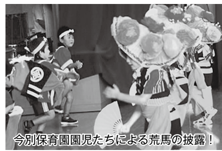
今別保育園園児たちによる荒馬の披露！

また、青森県警察音楽隊による演奏やカラーガード隊による演技、今別保育園園児たちによる伝統芸能「荒馬」が披露され、かわいらしい踊りで会場を和ませられました。