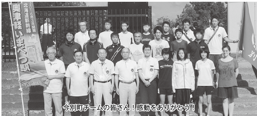
今別町チームの皆さん！感動をありがとう！

2時間4分53秒の記録ですすきをつないだ今別町チームの走りは多くの方に感動を与えてくれました。