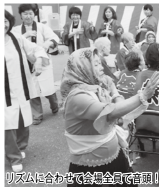
リズムに合わせて会場全員で音頭！