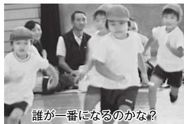
誰が一番になるのかな？