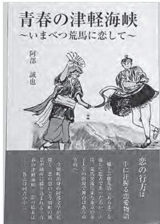
出版された『青春の津軽海峡』