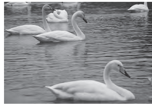
優雅に泳ぐ白鳥!今別に冬がやってきました!