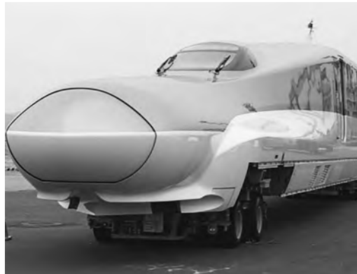
写真⑦ 初陸揚げされた車両(H5系)！