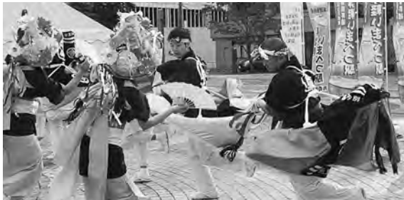
写真④ 大迫力の今別荒馬！