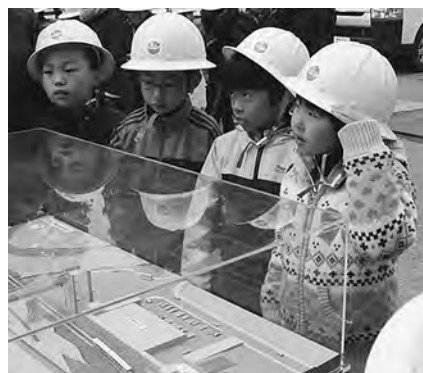
真剣に話しを聞き、思いを膨らます今小の児童たち！