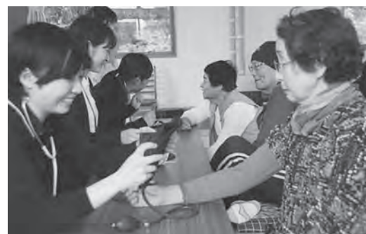
血圧測定で体の状態を確認!

また、「段差の無い所でつまずいた」などの悩みが聞かれ、「足腰強化で転倒防止」をテーマに曲に合わせ、看護学生が考案したいつでも行うことができる簡単な体操を参加者全員で行いました。昼食には美味しいカレーが振る舞われ、最後まで笑顔が絶えない楽しい時間を過ごしていました。