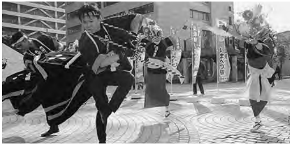
写真③ 華麗に舞う大川平荒馬！