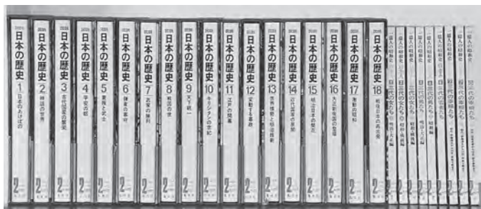
ふれあい文庫に多くの本が寄贈されました!