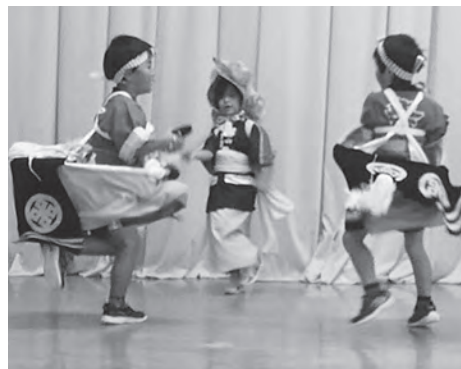
荒馬を披露してくれた今別保育園の皆さん