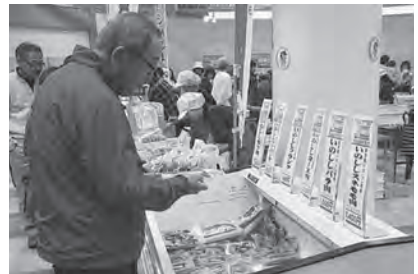
いのしし肉を求めらるお客さん！