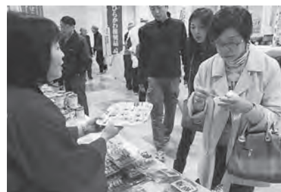
自慢のもずくうどんは大好評！

11月1日から3日までの3日間、アスパムにおいて県内40市町村の魅力が大集合した「青森県市町村まつりinアスパム」が開催されました。