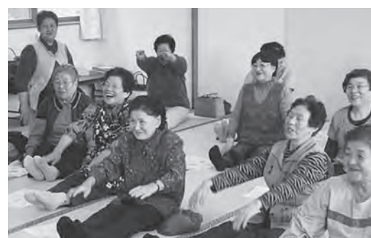
楽しい時間で皆さん笑顔!