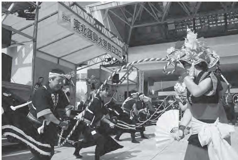
迫力ある演舞で会場を沸かせた大川平荒馬保存会の皆さん