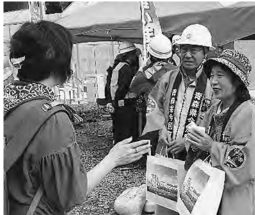
写真⑥ ティッシュを配りPR