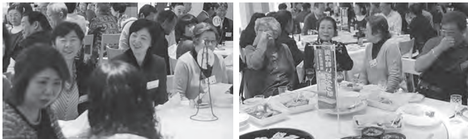
美味しい料理を囲み、ふるさと今別の話題で大盛り上がり！