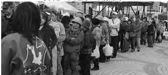
写真⑤ 郷土料理「あづべ汁」を求めて長い列ができました