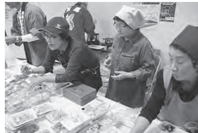
大川平加工グループのみなさん！

今別町からは地場産品として、奥津軽いのしし牧場、大川平加工グループ、今別町商工会が出店し、何度もブースを訪れ今別町の特産品を買い求めてくれた方もいて、行列ができるほど大盛況でした。