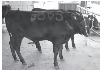
高い評価を受けた牛を購入！

2016年開業の北海道新幹線「奥津軽いまべつ駅」開業と「いまべつ牛」の町内販売に向け、5月に設置された「いまべつ牛販売促進連絡会議」では、販売体制づくりに向け進めています。