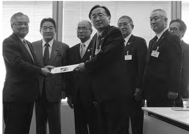
写真① 二桁の停車本数を強く要望しました

10月13日、北海道新幹線の車両（H5系）が、北海道函館港に初陸揚げされました。12月から、この車両を使った試験走行が始まります。奥津軽いまべつ駅への初到着は、12月7日早朝の予定です。…写真⑦