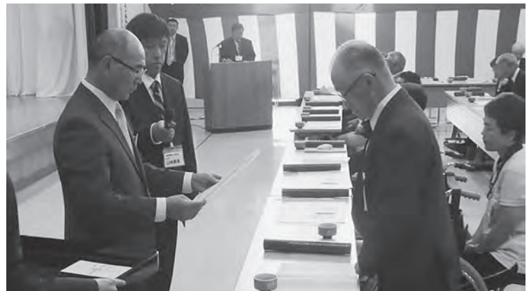
阿部町長から表彰される受賞者