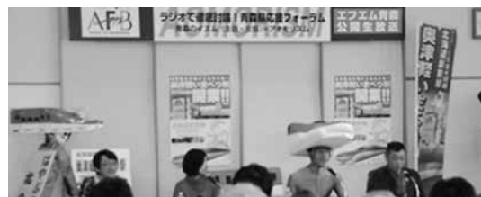
会場には多くの方が集まってくれました

2月11日、今別町中央公民館において、FM青森の公開生放送（番組名：ラジオで徹底討論！青森応援フォーラム アオモリズム）が行われ、「北海道新幹線開業を見据えた「奥津軽いまべつ駅」の活用！」をテーマに放送し、奥津軽いまべつ駅開業に向けて熱い討論が繰り広げられました。