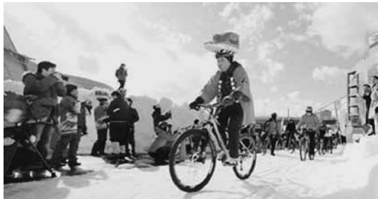
新幹線の被り物でPR！

2月1日、町職員と県東青地域県民局職員がチームを組み、青森市で行われた「青森サイクルフェスタ2015 海辺de雪上エンデューロ」へ参加し、奥津軽いまべつ駅開業をPRしました。