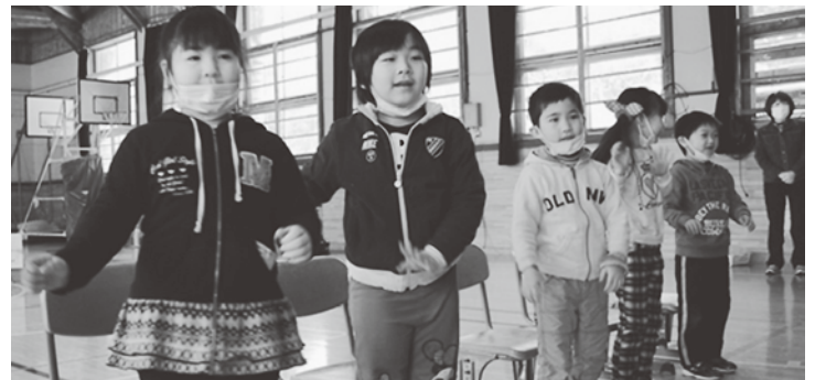
みんなで楽しく歌を歌いました

初めは緊張していた園児たちでしたが、1年生の優しさに緊張がほぐれ、元気いっぱい笑顔を見せてくれました。