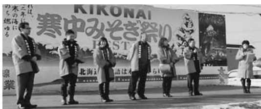
開業PRイベント実行委員会の皆さんが開業をPR

1月14、15日、北海道新幹線「奥津軽いまべつ駅」開業450日前イベントで、北海道木古内町の伝統の祭り「第185回寒中みそぎ祭り」に参加させていただき、開業PRをしました。