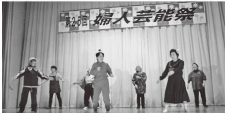
津軽弁ラジオ体操は笑いが絶えませんでした