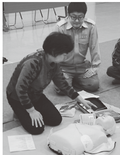
AEDの操作を学習しました

青森地域広域消防事務組合中央消防署今別分署から3名の講師を招き、参加した約40人の受講生は心肺蘇生法やAED(自動体外式除細動器)の実施訓練に取り組みました。また、いざという時に役立つ手当や対処を紹介したDVDを鑑賞し、救急救命法について熱心に学習していました。