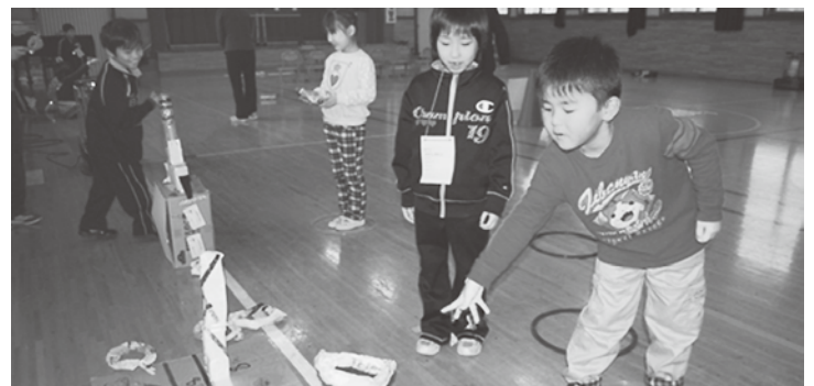
楽しい輪投げで仲良くなれました