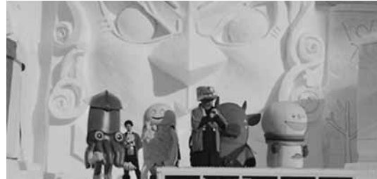
北海道のゆるキャラと駅開業PR

2月6日、木古内町や北斗市などと一緒に「さっぽろ雪まつり」へ参加し、特設ステージから「奥津軽いまべつ駅」開業をPRしました。