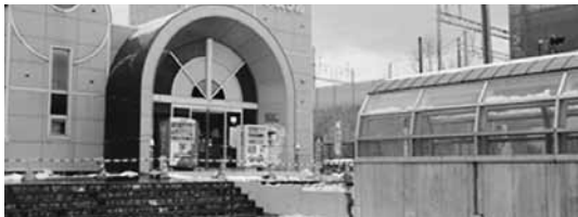
リニューアルオープンを目指すアスクル！

牛肉やもずくなど、町の特産品を取り入れた食事を提供するレストランや、町内のほか、近隣町村や道南エリアから仕入れた物販コーナーを充実させる計画で、着々と準備が進められています。