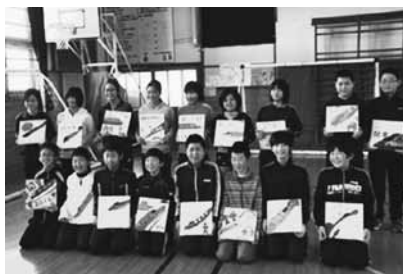
6年生の皆さんはタイルと記念撮影！