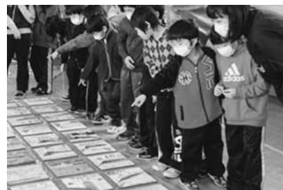
自分の描いたタイルを探す児童の皆さん