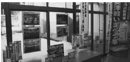
PRブースとのぼりでPR！

2月7日開発センターで行われた「第25回婦人芸能祭」に参加し、PRブースやのぼりを設置し、「奥津軽いまべつ駅」開業をPRしました。