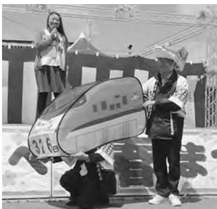
開業PRに協力していただいた東青地域県民局の皆さん

PRブースでは駅や車内の概要パネルが展示され、職員が新幹線の被り物や開業PR用はんてんを着用して園内を歩くなど、多くの方にPRすることができました。