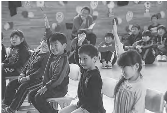
クイズの答えが分かり、自信满满！

お祝いの出し物では今別小学校に関するクイズやインタビューが行われ、2年生からはアサガオの種がプレゼントされました。最後に1年生から、元気な歌のおかえしがあり、にぎやかで楽しい会となりました。