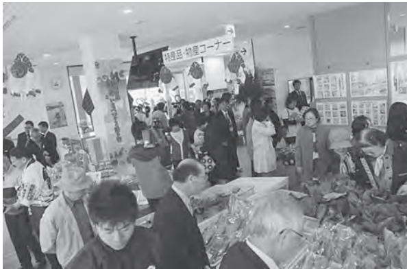
にぎわいをみせる店内の様子