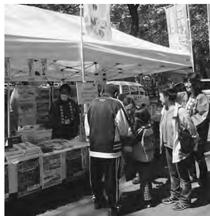
町の特産品と駅開業をPR

商工会のブースにはとろろ昆布や餅類などの多くの商品が並び、観光客は今別町の味を求めていました。新幹線ブースには駅舎や車両のパネルが展示され、訪れた多くの方々に今別町の魅力をPRすることができました。