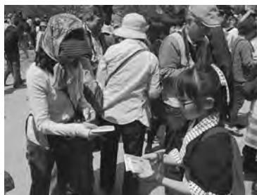
ティッシュを配り今別町をPR