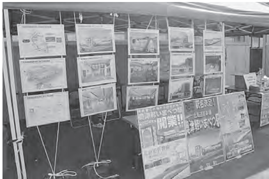
パネルなどで新幹線開業をPR