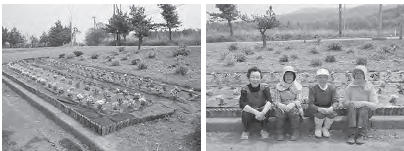
整備された花壇とVicウーマンの皆さん

4月28日、Vicウーマンの皆さんが高野崎入口の花壇に、パンジーやマリーゴールドを植え、緑化推進をアピールしました。国定公園高野崎を訪れた観光客をきれいな花たちがおもてなしします。