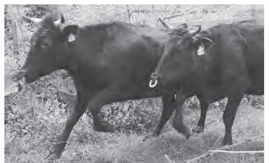
33頭の牛が放牧されました

5月15日、町営山崎放牧場において、牛の放牧が行われました。今別町和牛飼育組合の皆さんが放牧し、広い大地に放たれた牛たちは元気に駆け回っていました。11月まで放牧し、その後、各畜産農家の牛舎に戻される予定です。