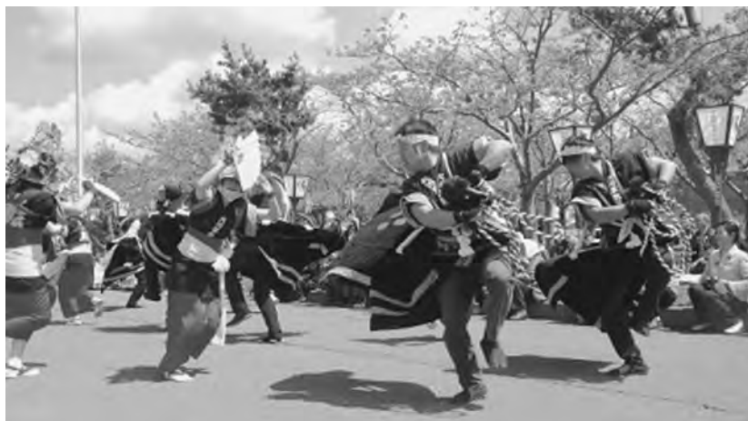
迫力ある演舞で会場を盛り上げてくれた今別荒馬(左)と大川平荒馬(右)