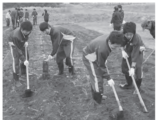
8月頃の収穫に向け作業に取り組む生徒の皆さん

農園指導者からのアドバイスを聞きながら、土を耕したり種イモを植えるなどの作業をしました。生徒たちは、たくさん収穫できるように一生懸命作業をしていました。