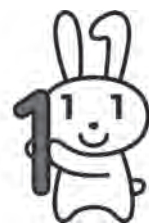
愛称：マイナちゃん

マイナンバー制度は、住民票をお持ちの方一人ひとりにマイナンバー（個人番号）を付番し、行政の効率化や国民の利便性を図るための制度です。また、マイナンバーは社会保障、税、災害対策分野の中で法律で定められた行政手続きにしか使用しません。