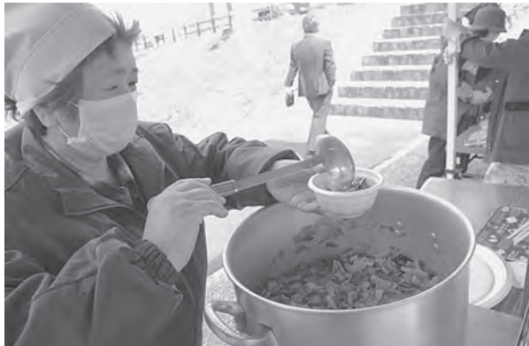
振る舞われた今別町の味「あづべ汁」は大人気でした

と笑顔で話してくれました。 売り場には、リニューアルした「道の駅いまべつ」を一目見ようと多くの方々を訪れました。町内の特産品のほか、近隣市町村や道南エリアの物販コーナーは、多くの観光客でにぎわいました。牛肉やもずくなど町の特産品を取り入れた食事を提供するレストランも行列ができるほどの人気で、多くの方が今別の味を堪能していました。リニューアルオープン記念して大川平加工グループの皆さんからあづべ汁の振る舞いもあり大人気でした。 当日は北海道新幹線「奥津軽いまべつ駅」のPRブースも設置され、駅概要のパネルなどを展示し、多くの方々にPRしました。