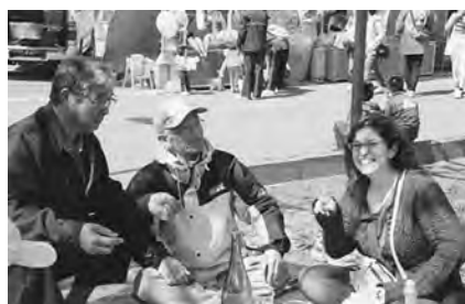
楽しいひと時を過ごしました