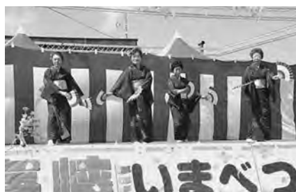
芸能で観客を魅了