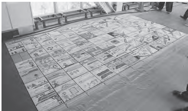
今小生徒たちのそれぞれの思いが描かれたタイル

今別小学校全校児童に新幹線や町の未来への思いを描いたメッセージタイルの配置が奥津軽いまべつ駅の連絡通路の一部に決まり、5月18日から貼付作業が始まりました。描いたタイルは裏返しになり、絵は見えなくなりますが、使用された箇所が分かるように目印がつくようになっていますので、駅完成後にご覧ください。