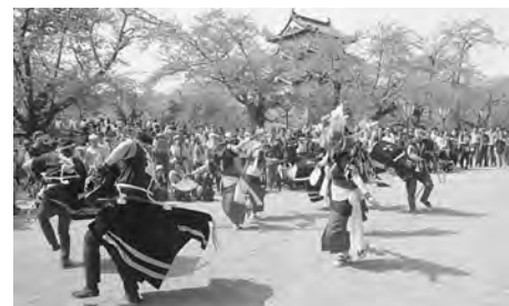
弘前城前で華麗に演舞!

町の伝統芸能「荒馬」を披露した大川平荒馬保存会の皆さんの荒馬は、観光客から注目を浴び、迫力ある演舞に観光客の皆さんは夢中になっていました。演舞終了後には、保存会の皆さんと新幹線対策室職員がティッシュやパンフレットを配布し、町の伝統芸能「荒馬」と2016年3月に開業する北海道新幹線「奥津軽いまべつ駅」をPRしました。