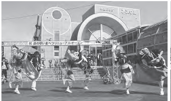
リニューアルオープンを祝い、今別荒馬(左) 大川平荒馬(右)が舞う