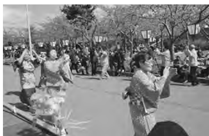
多くの人が参加した流し踊り