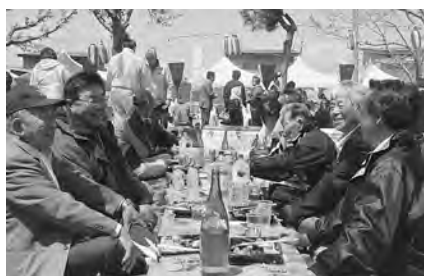
仲間と食べる料理は格別の味!