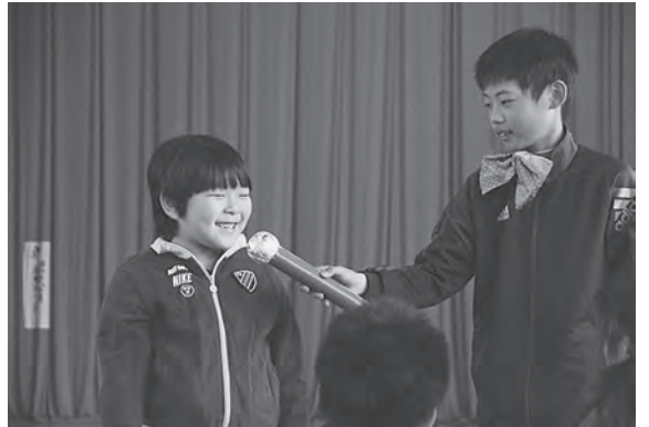
質問に元気に答える1年生