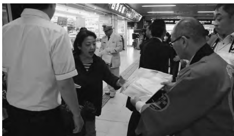
青森の魅力が詰まったパンフレットを配布

今別町のご当地キャラクターのあらまくん、たづなちゃんもPRに参加し、記念写真をとるなど町をPRしました。