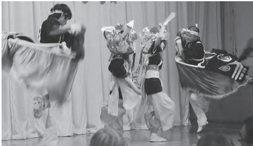
式典を祝福する今別荒馬の華麗な演舞

今別荒馬保存会の皆さんによる町の伝統芸能「荒馬」が行われ、式典を祝う華麗で迫力ある荒馬が披露されると、大きな歓声があがりました。