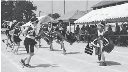
元気いっぱい荒馬を披露

町の伝統芸能「荒馬」の披露や北海道新幹線の車両（H5系）はやぶさなどをモチーフにしたチャレンジ走が行われ、児童たちは元気に走り回っていました。