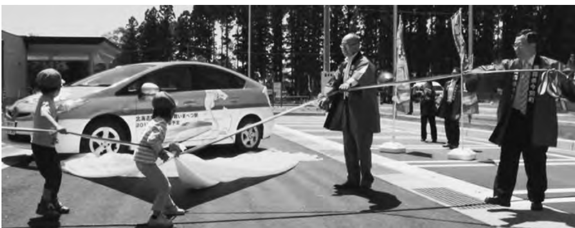
ラッピングカーのお披露目に会場からは大きな拍手が送られました

さらに、会場には「今別の食」をテーマにブースが設置され、郷土料理「あづべ汁」や「もずくうどん」など今別町のおいしい食材・料理が並び、各ブースとも多くの方々にぎわっていました。