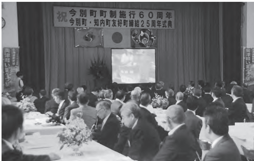
6分にまとめられた今別町の映像を鑑賞する参加者の皆さん