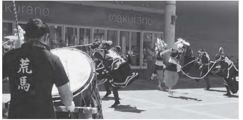
多くの方から注目を浴びた迫力ある大川平荒馬の演舞

また、北海道新幹線「奥津軽いまべつ駅」開業のPRやパネルなどが展示され、お子様限定の「奥津軽いまべつ駅」に関連したクイズが出題されると、参加した子供たちは元気に答えていました。