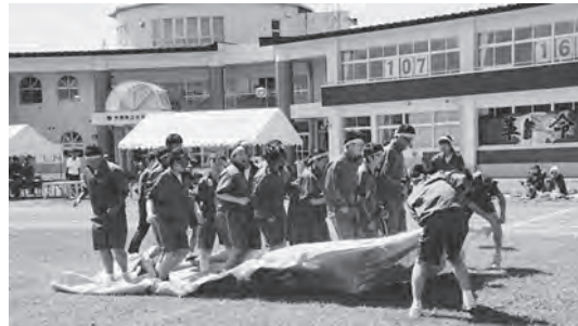
タイミングを合わせてジャンプ！