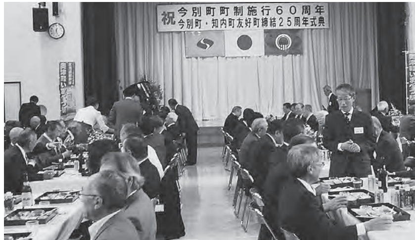
料理を囲みながらの祝賀会が開かれました