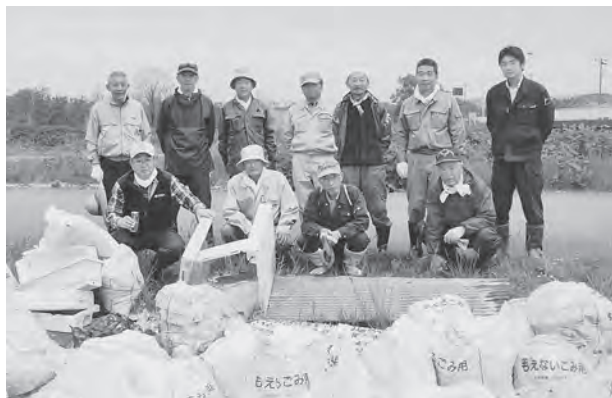
参加者皆さんののおかげで今別川周辺がきれいになりました

長年、今別川周辺の清掃活動に取り組んでいる参加者皆さんののおかげで、缶やビンやプラスチックなどを拾い、今別川周辺はきれいになりました。