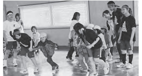
園児たちも体育祭を楽しんでいました

イス取りゲームなどの競技では白熱の戦いが繰り広げられ、大いに盛り上がりました。今別保育園の園児たちも途中で参加し、生徒たちにリードされながら元気に走り、にぎやかで楽しい体育祭となりました。