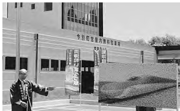
300人の笑顔で作成した見事なフォトモザイクアート