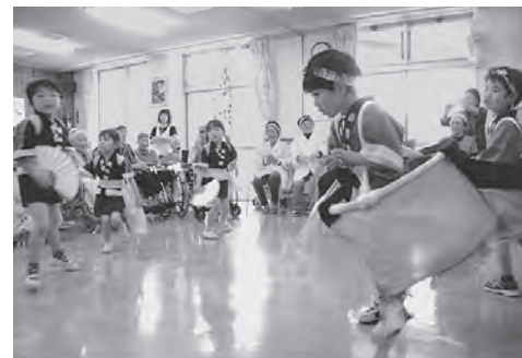
かわいらしい荒馬に会場は大喜び!