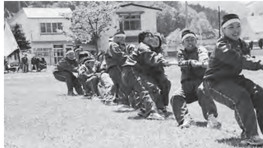
声を掛け合いながら懸命に綱引き

大きな掛け声ときびきびとした行進で入場し、各チーム優勝を目指す真剣な眼差しでした。綱引きやリレーなどの種目では、接戦になる場面が多くあり、各競技で熱戦が繰り広げられていました。チームの声援を力に、生徒たちは全力で勝利を目指していました。