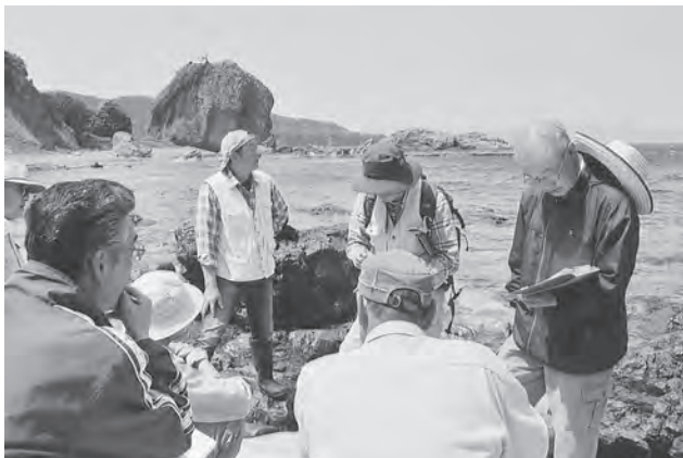
高野崎で研修を受ける参加者の皆さん

研修では海浜にある岩石の形状ができるまでの説明や成分などについて学習し、講義では今別町の地形ができるまでの経過についてや竜飛まで続く津軽半島、坊主岳、とんがり岳の地層について学習しました。