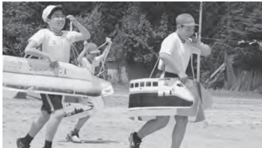
新幹線を持って元気に走り回りました