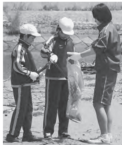
お互い協力してたくさんのゴミを拾いました