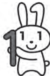
愛称：マイナちゃん

先月号に引き続き、マイナンバー制度・番号制度についてお知らせします。今月号はいつからどのような場面で使用するか?をお知らせします。平成28年1月から、国の行政機関や地方公共団体などにおいて、社会保障、税、災害対策の分野で利用されます。マイナンバーは社会保障・税・災害対策分野の中で法律や町の条例で定められた行政手続にしか使用することはできません。