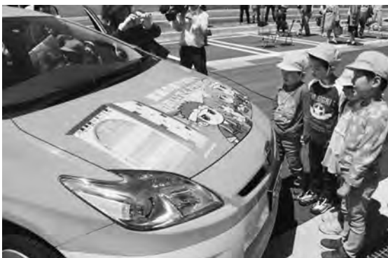
荒馬のキャラクターのラッピングに興味津々な園児たち