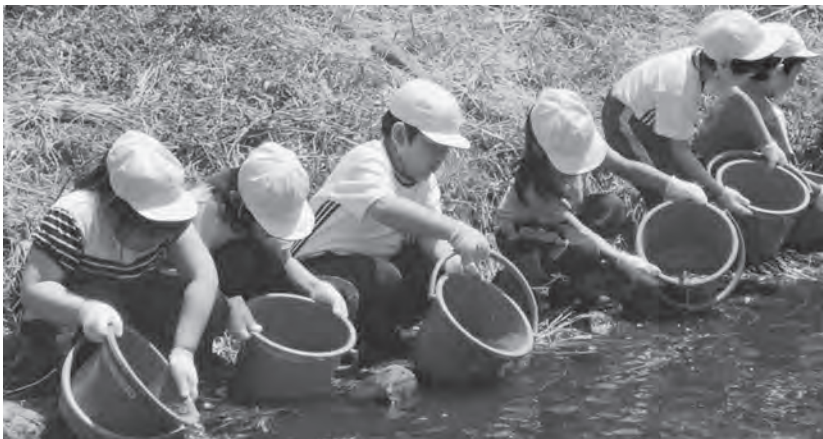
大きく育ちますように…