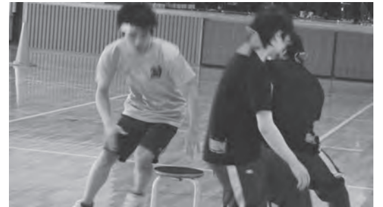
白熱のイス取りゲーム！