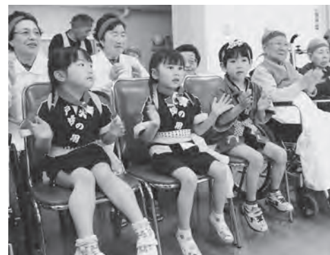
みんなで楽しく歌いました

昼食には、みんなでカレーをいただき、楽しかった今回のイベントについて話すなど、最後まで笑顔が絶えない交流会となりました。