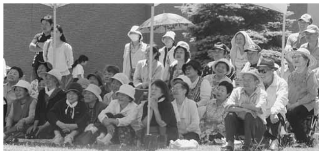
応援にも熱が入ります