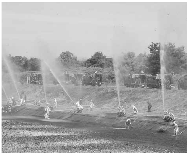
勢いよく空に舞いました