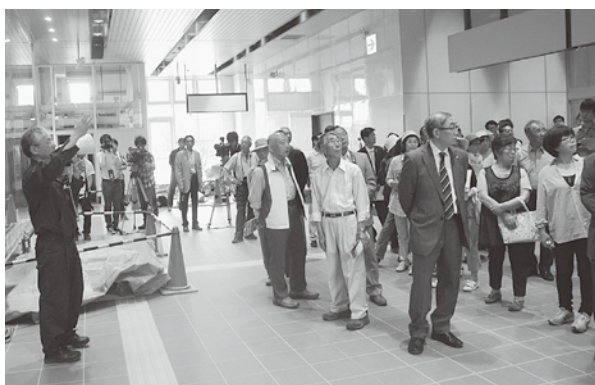
駅舎内を見学し、説明を聞く町民の皆さん

7月11日、北海道新幹線「奥津軽いまべつ駅」の駅名標除幕式・駅舎見学会が開かれました。