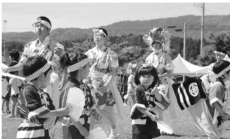
今別保育園児も参加し、盛り上げてくれました

競技開始に先立ち、今別保育園児、今別小・中学校児童・生徒による町の伝統芸能「荒馬」が披露され、今回の運動会を祝う壮大な演舞で、会場を盛り上げてくれました。