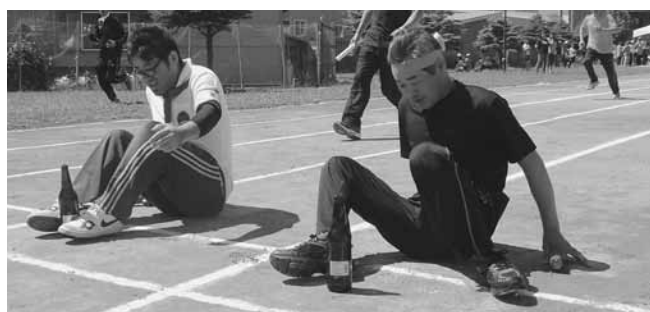
よしっ、立った！<ピン立てりレー>

競技開始に先立ち、今別保育園児、今別小・中学校児童・生徒による町の伝統芸能「荒馬」が披露され、今回の運動会を祝う壮大な演舞で、会場を盛り上げてくれました。