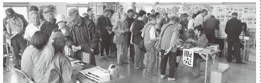
会場は多くの方で大盛況！