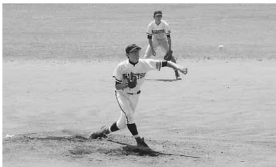
日頃の練習の成果を試合で発揮した野球部と女子バレーボール部

野球部は自分たちのペースで試合を運んでいましたが、相手チームに逆転を許してしまいました。惜しくも負けてしまった部員に、応援にかけた皆さんから大きな拍手と「3年間お疲れ様」という労いのことばが送られていました。