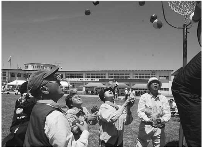
狙いを定めて・・・<玉入れ競技>

うまく転がすことが難しい「タイヤ転がしリレー」では、カーブでタイヤがコースを外れるなど各選手苦戦している様子でした。