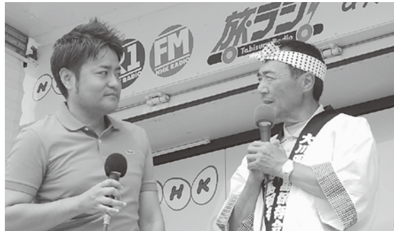
荒馬をPRする大川平荒馬保存会の嶋中会長(右)