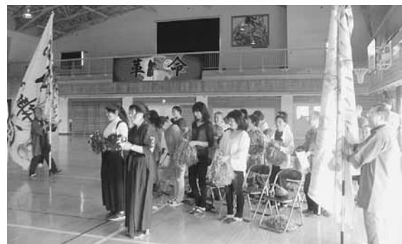
保護者の皆さんの応援にも熱が入ります