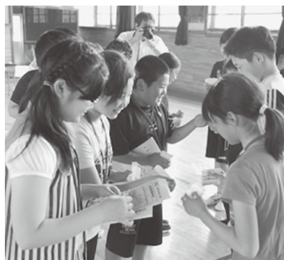
手作り名刺で自己紹介