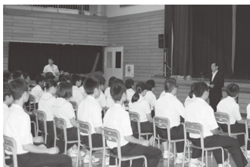
人権について真剣に学習する生徒たち

7月13日、今別中学校体育館において人権啓発映画上映会が行われました。人権啓発映画を鑑賞した生徒たちは人権について学習し、「相手の気持ちを考えて行動したい」や「思いやりの心を持ちたい」などと感想を記入してくれました。