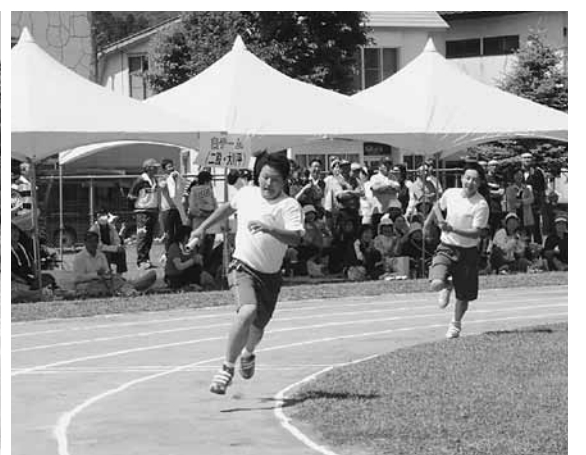
<中学生男女混合リレー>