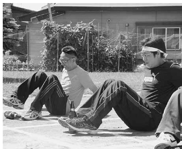
なかなか立たず苦戦！<ピン立てりレー>

「ピン立てりレー」では、なかなか立たないピンに苦戦している選手が多くいましたが、中には素早くピンを立てる選手もおり、会場から歓声を送られました。ピン立てり時間をとられた分、リレーで遅れを取り返そうと、選手たちは一生懸命バトンをつないでいました。 「綱引き」では大きな掛け声で引くもの、一進一退の攻防が繰り広げられるなど、決着がなかなかつかない戦いに、会場中は大盛り上がりでした。 応援に駆けつけた町民の方々からは「がんばれ」と大きな声援が送られていました。