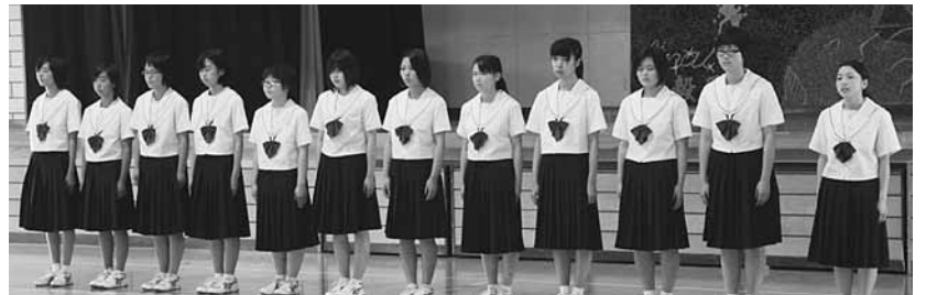
決意を述べるフェンシング部（上）と女子バレーボール部