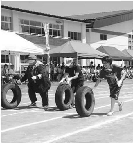
コースを外れないように慎重に！<タイヤ転がしリレー>