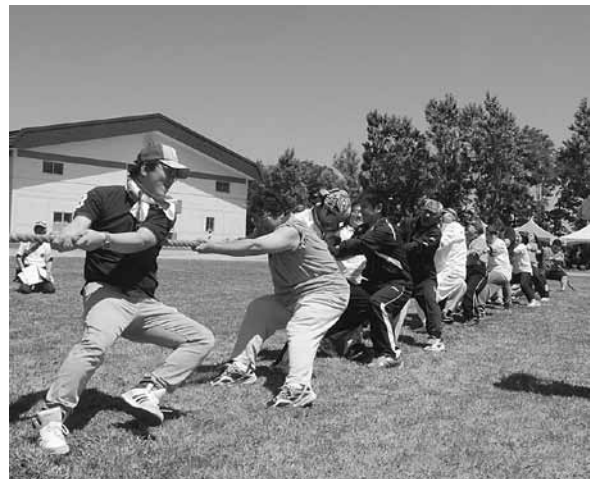
大盛り上がりの綱引きでは、勝敗がなかなか決まらずドキドキの展開に！<綱引き>