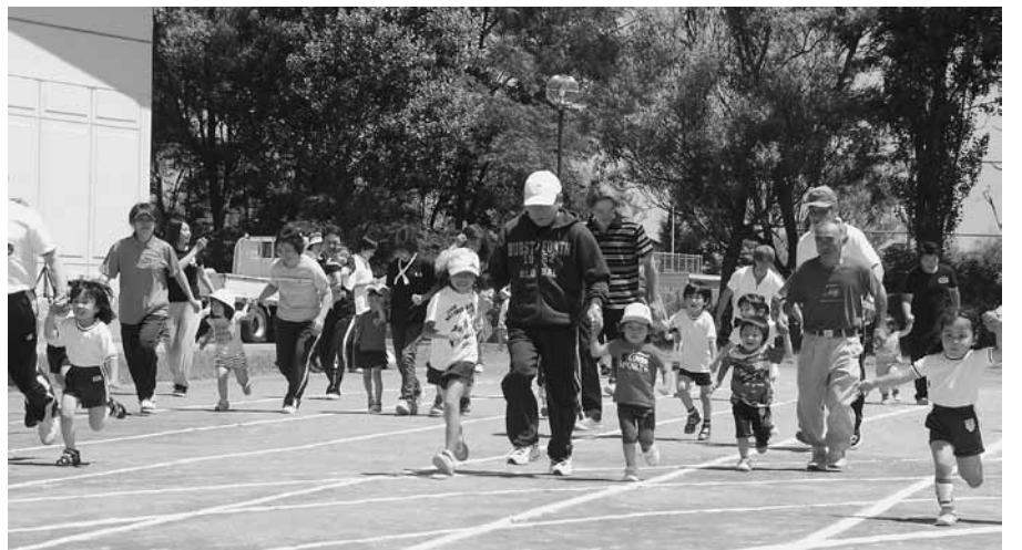
アトラクションには多くの子供たちが参加<お孫さんと一緒>

「お孫さんと一緒」では、子どもたちが景品とゴールを目指し、走りました。元気に走る姿に会場から声援が送られ、全員がゴールをすると、子ども達に大きな拍手が送られました。