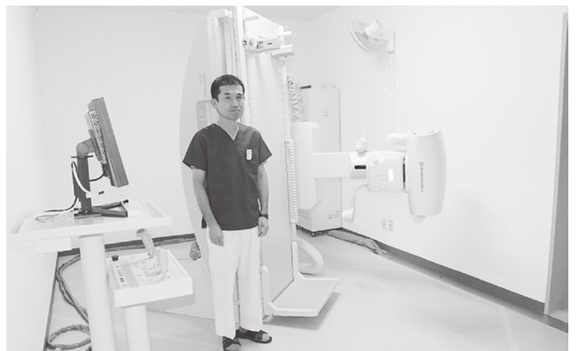
新しく導入されたレントゲンシステム

このように、多機能を有する新しいレントゲンシステムを利用して最先端の医療レベルを維持しつつ、地域の皆様の健康維持のためにも有効に活用していこうと思っています。