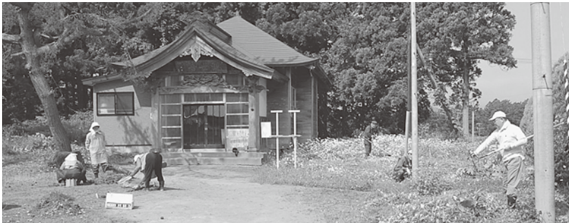
草刈りを行う後町三階町町内会の皆さん

6月20日、後町三階町町内会の方々20名が高野山観音様の草刈を行いました。高野山観音堂が津軽三十三観音で毎年多くの参拝客が訪れるため、毎年この時期に忠魂碑まで草刈りを行っています。