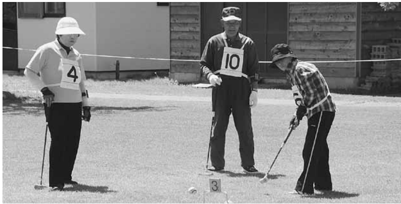
楽しい時間を過ごしました

競技中はお互いに元気な声を掛け合いながらプレーし、正確なショットを見せていました。対戦した蓬田チーム、蟹田チームとゲートボールなどについて会話を楽しむなど、にぎやかな大会となりました。