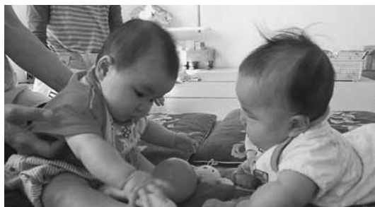
仲良く遊んでいました