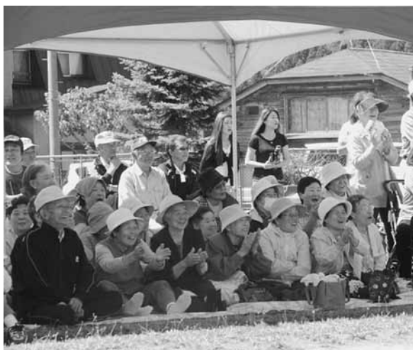
熱い声援が送られました