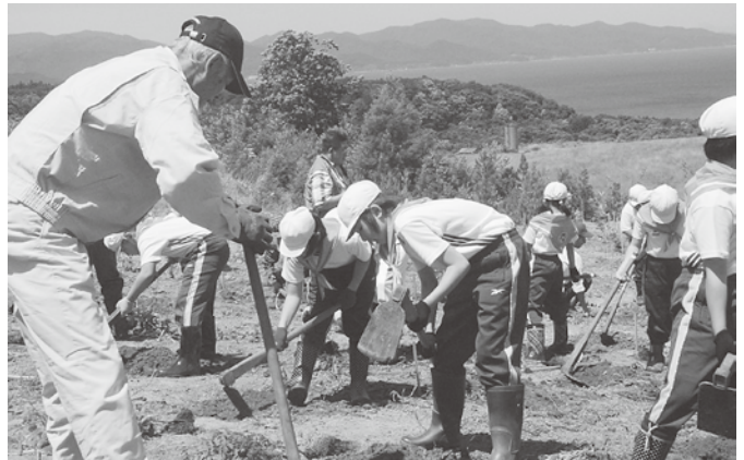
アドバイスを受けながら植樹を体験

会場には漁業・林業関係者及びボランティアグループの皆さんが来場し、ヒバやブナなど数種類を植えました。苗の植え方を教わった今別小学校の4・5年生も植樹を体験し、今別町がさらに自然豊かな町になるように懸命に植えていました。