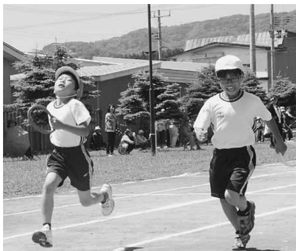
<小学生男女混合リレー>