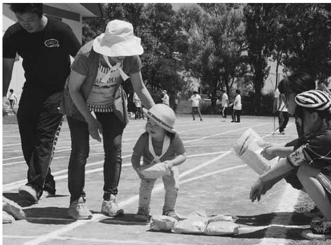
景品をゲットし、ゴールへ！<お孫さんと一緒>

「玉入れ競技」に参加した選手は、全員でまとめて投げるなど作戦を立てながら競技に挑むチームもありました。