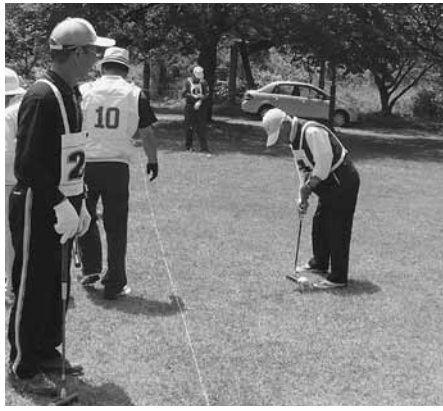
笑顔が絶えない大会となりました

開会式では阿部町長から「ようこそ今別町へお越しいただきました。今回のゲートボール大会を楽しんでください」とあいさつが述べられました。今別町と知内町ゲートボール愛好者の皆さんは、爽やかな汗を流し、交流を楽しんでいました。