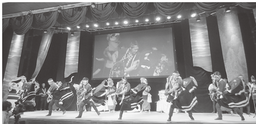
迫力ある演舞で会場を魅了

7月15日、ホテル青森において「青森県・函館デスティネーションキャンペーン(DC)全国宣伝販売促進会議」が開かれました。全体会議では青森県及び道南地域の観光素材や青森県・函館DCに向けた取り組みを紹介、レセプションでは、県内農林水産物を使用した料理の提供が行われました。さらに、観光・物産PRコーナーも設け、「荒馬の酒」をはじめ、大川平加工グループの皆さんから「あづべ汁」の提供があり、町の特産品「一球入魂かぼちゃ」を使った「シフォンケーキ」など多くの方に今別町の食材などをPRしました。また、2015年度末に開業する北海道新幹線「奥津軽いまべつ駅」のPRや大川平荒馬保存会の皆さんが町の伝統芸能「荒馬」を披露し、今別町の魅力などを伝えました。