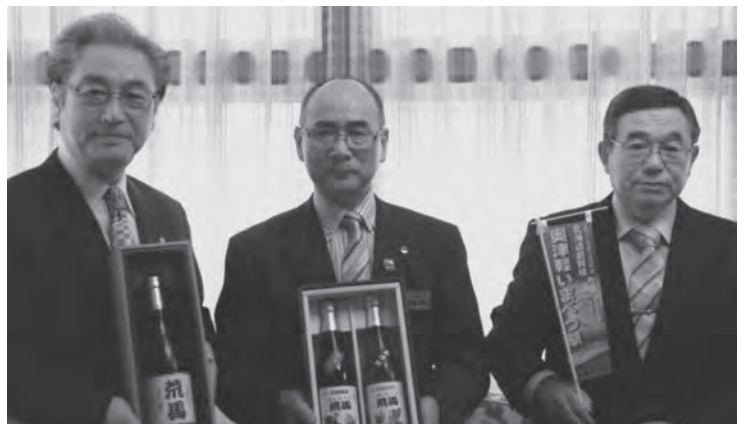
荒馬の酒を発表し、町のお土産品に加わる