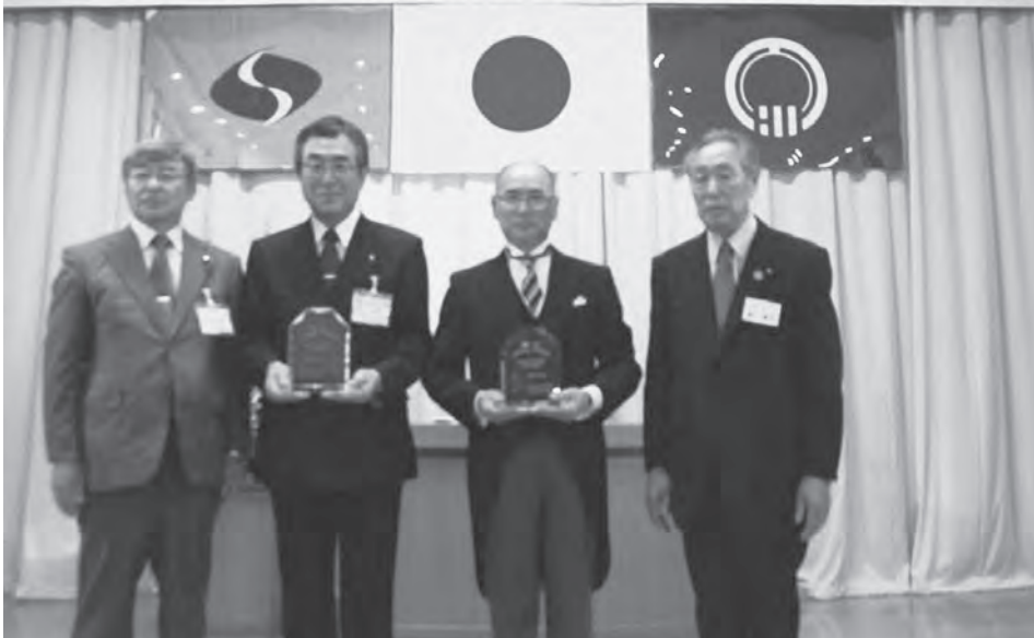
今別町町制施行60周年、知内町友好町25周年式典の様子