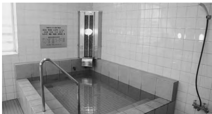
肩こりなどに効く炭酸カルシウム人工温泉