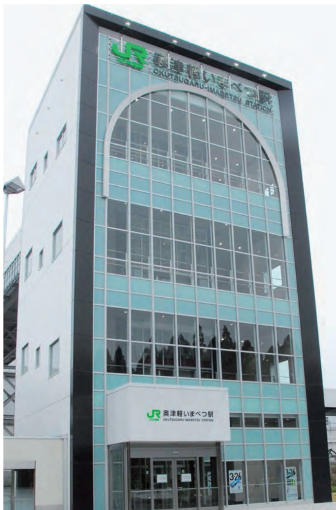
いよいよ今年3月26日に開業が迫った「奥津軽いまべつ駅」

昨年12月12日、今年3月26日に開業が迫った北海道新幹線「奥津軽いまべつ駅」駅舎見学会が、JR北海道主催で行われました。