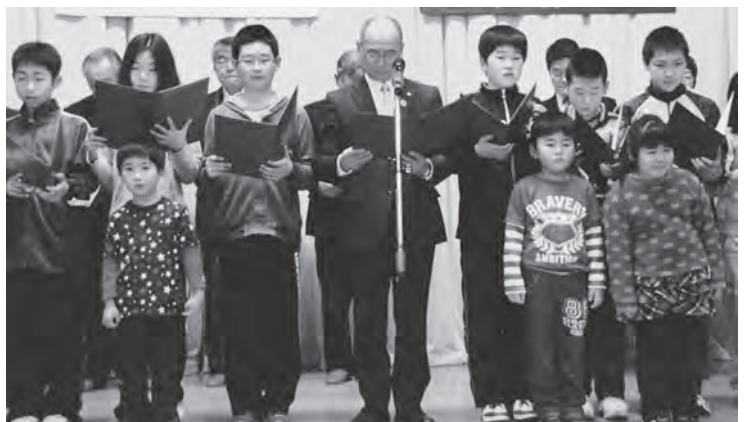
健康長寿のまちづくり宣言