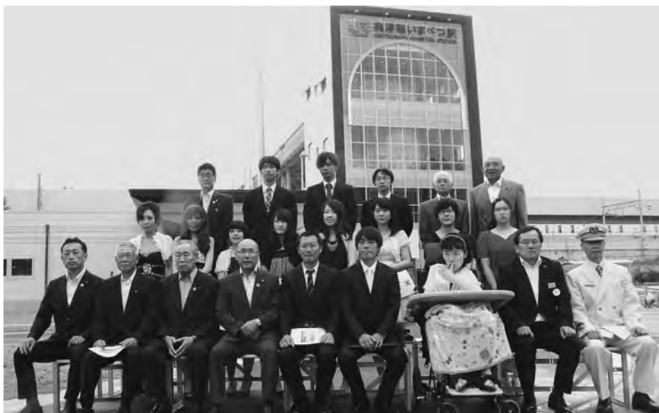
駅舎での成人式開催は忘れられない思い出になりました