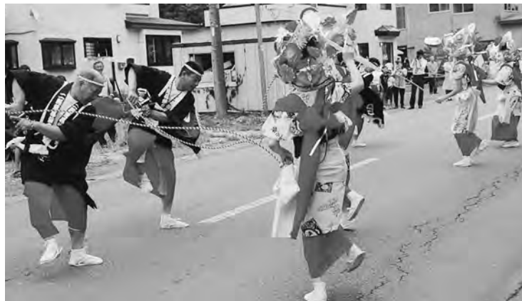
12年ぶりに『二股荒馬』が復活し、地区、町を盛り上げる