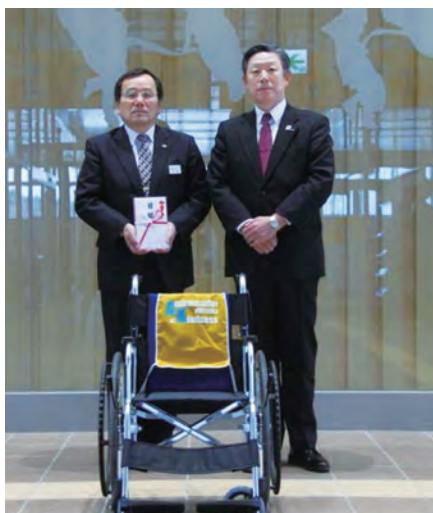
安藤支社長(左)と出町常務取締役