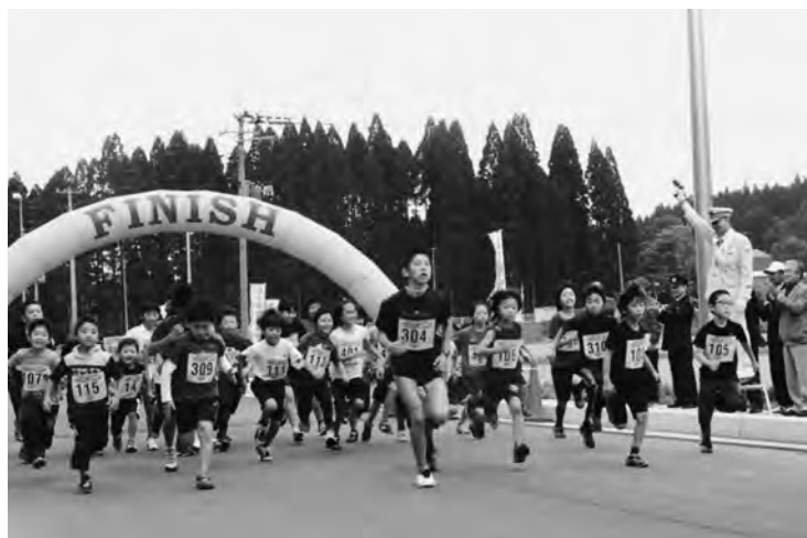
勢いよくスタートするランナーの皆さん