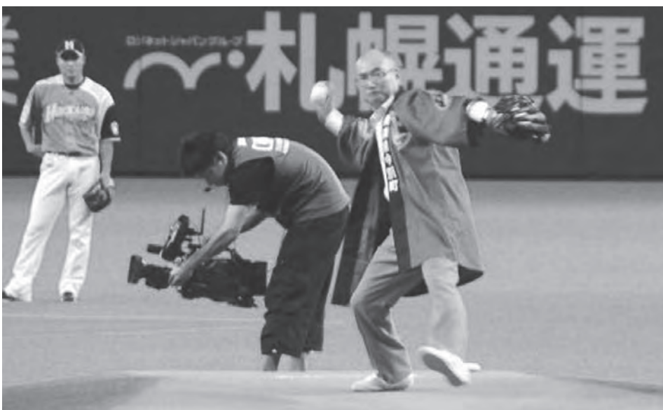
見事な投球で、観客をわかせた阿部町長