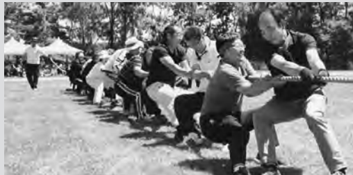
熱戦の町民ふれあい運動会