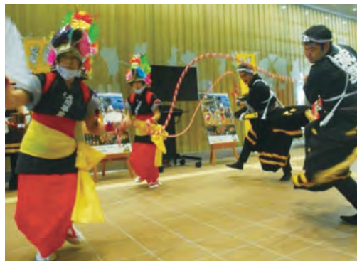
大川平荒馬保存会の皆さんによる迫力ある演舞

町の伝統芸能「荒馬」のシルエットがデザインされた駅構内では、大川平荒馬保存会の皆さんが迫力ある演舞で「荒馬」を披露し、観客を魅了しました。