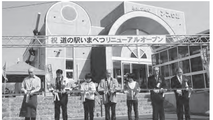
道の駅いまべつがリニューアルオープン