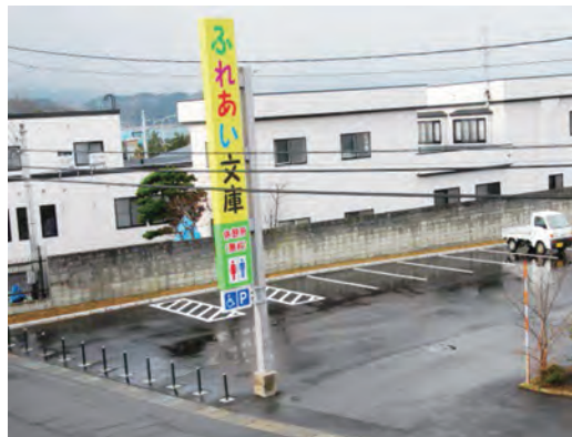
整備された連絡橋(左)とふれあい広場