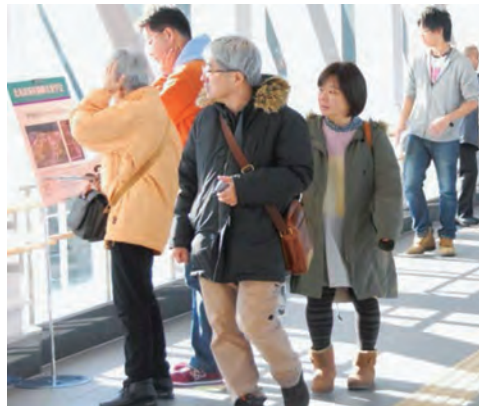
多くの方が見学に訪れました

開業が迫っている「奥津軽いまべつ駅」を一目見ようと、会場には約400人の町内外の方々が来場しました。見学順路には「町の伝統芸能『荒馬』の衣装をイメージした、赤、黄、ピンクの扉が使用されています」などと書かれたパネルが設置され、見学者は駅舎内の様子を写真に収めていました。また、駅舎入口から改札口に延びる連絡通路は、青函トンネルをイメージしており、来場した皆さんは今別町の新スポットとなる「奥津軽いまべつ駅」を堪能していました。