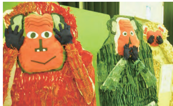
ひよりの皆さんが今年の干支の「申」を作製しました

会場では各団体からおいしい食べ物や加工品、工芸品などの販売が行われ、多くの方々にぎわいました。芸術作品として今別保育園児の皆さんからの工作作品、書道、ぬりえなどの作品が多く並び、完成度の高い作品に会場は見とれていました。ステージでは、婦人会の皆さんによる華やかな踊りが披露されるなど、最後まで楽しい福祉展となりました。