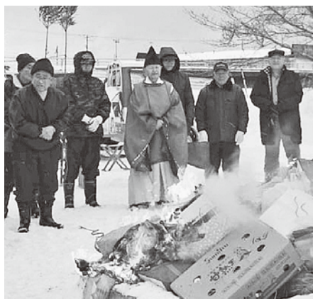
私たちを守ってくれたお守りが天に戻されました

参加者は、どんど焼きの火にあたり、焼いた団子を食べれば、その1年間健康でいられるなどの言い伝えもあり、無病息災・五穀豊穡を祈っていました。