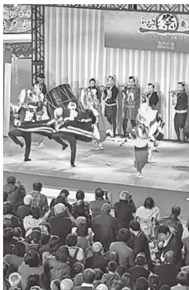
迫力ある演舞を披露後（左）、町の観光パンフレット等を配布しPR

オーロラビジョンに大川平荒馬が紹介され、笛や太鼓の音が響きわたり、会場の注目を浴びる中、町の伝統芸能「荒馬」を披露した大川平荒馬保存会の皆さんの迫力ある演舞は、多くの観客を魅了しました。