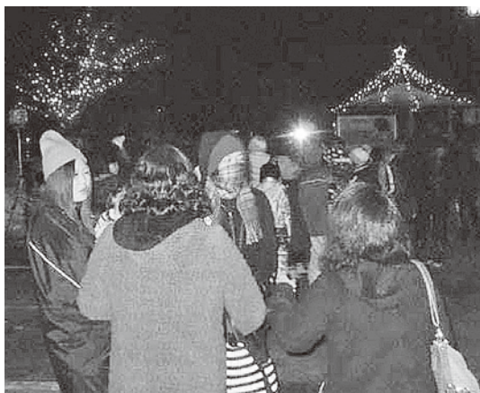
新年を祝う町民の皆さん

会場では、町特産品のもずくうどんの振る舞いや、来場した約150人の方々と豪華景品が当たるビンゴ大会を行い、楽しい時間を過ごしました。