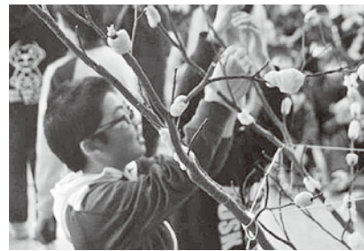
まゆ玉に願いを込めて...

お昼には、雑煮やおしるこが振る舞われ、大事に育てたもち米に感謝し、おいしくいただきました。