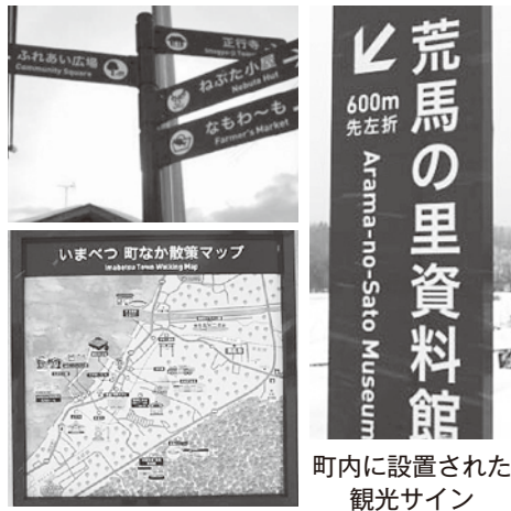
町内に設置された観光サイン

今年3月26日の北海道新幹線「奥津軽いまべつ駅」開業を控え、今別町を訪れた観光客に気軽に、快適に、散策してもらうため、今別駅や町内に観光サイン・案内マップが設置され、11月30日に工事が完了しました。 (総事業費：4,320千円)