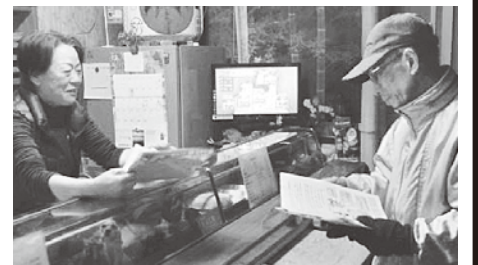
店を回り、注意を呼びかける

12月18日、今別町防犯指導隊、今別町交通安全母の会の皆さんが、町内の飲食店を回り、火の取り扱いに注意することなどを呼びかけました。