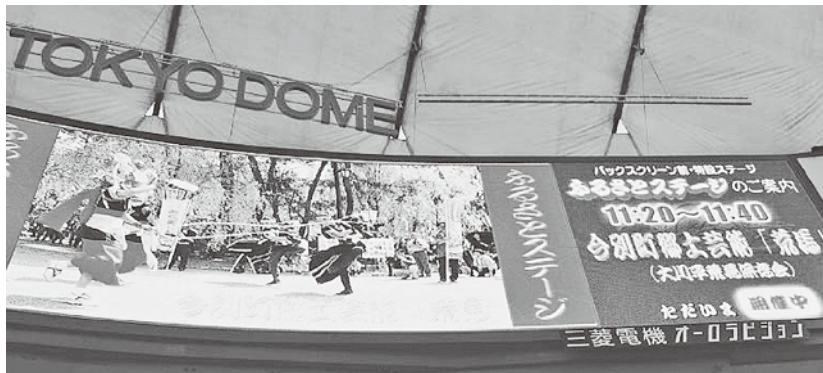
オーロラビジョンで大川平荒馬が紹介される

1月8日から17日、東京ドームにおいて、日本全国から伝統のお祭りや美味しい料理などが勢揃いする「ふるさと祭り東京2016」が開催され、大川平荒馬保存会の皆さんが参加し、迫力ある荒馬を14日、15日の2日間にわたり披露しました。