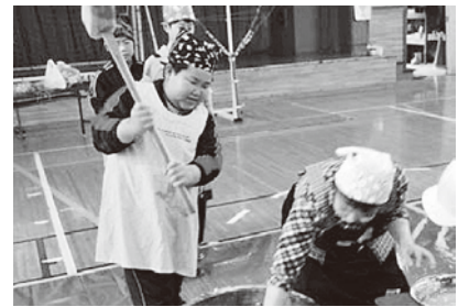
おいしい餅にな~れ!