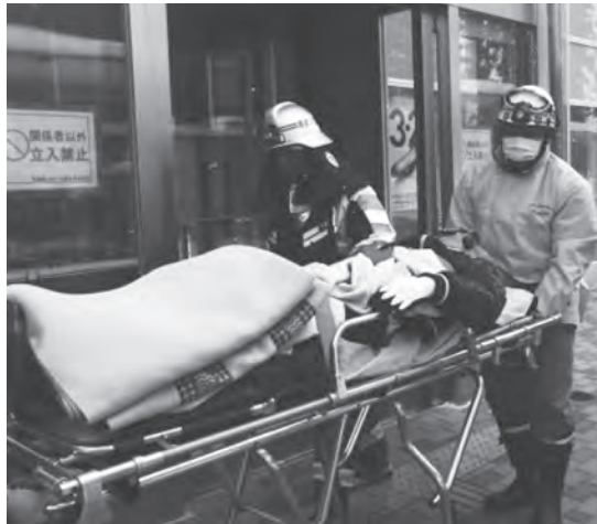
負傷者を救急車へ運ぶ救急隊員

訓練では、奥津軽いまべつ駅職員がアナウンスで避難を呼びかけ、消防機関等への通報、消火訓練を行いました。また、屋内に取り残され逃げ遅れた一般客を無事に屋外に避難させ、負傷者役の1人を担架に乗せ駅前に停車中の救急車へ運ぶなど、連携をとりながら、火災が発生した場合の対処について確認し合いました。