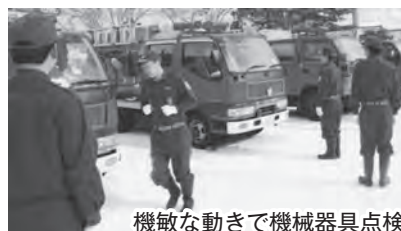
機敏な動きで機械器具点検

パレード終了後には開発センター駐車場で機械器具点検が行われ、機敏な動きで点検を行いました。