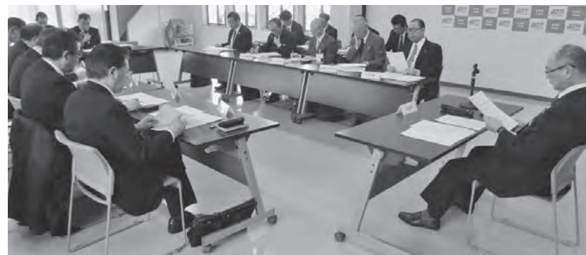
二次交通の整備に向け協議する阿部町長はじめ関係者