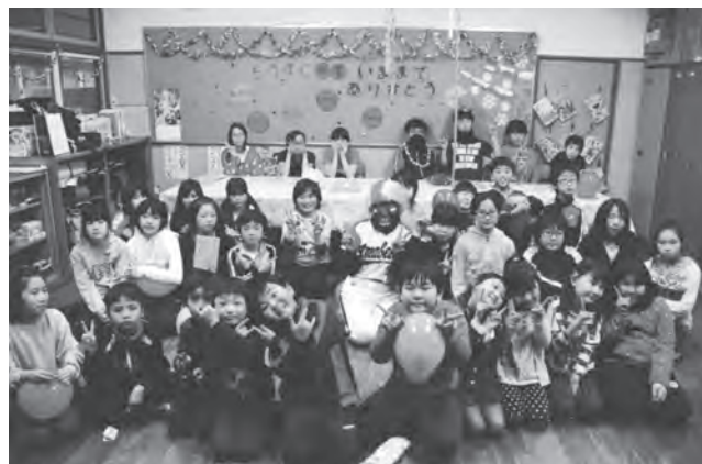
放課後教室に参加した皆さんで記念撮影

最後に6年生から、「今までありがとうございました」などの感謝の気持ちが述べられ、在校生は大きな拍手をおくっていました。