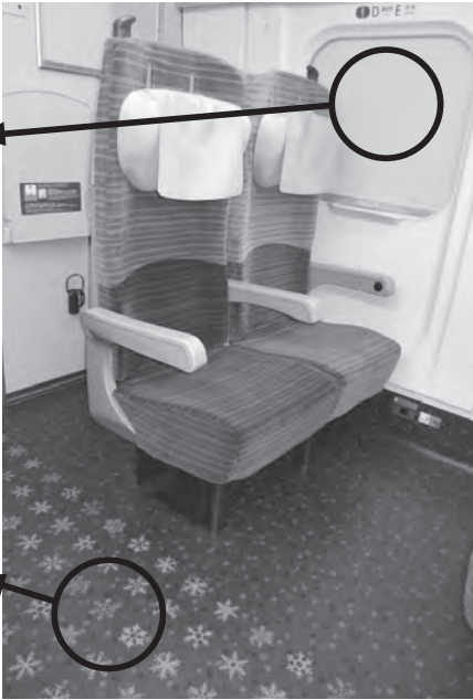
広々とした空間で電源コンセントが各席に設置されているなど誰でも使いやすくなっています