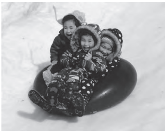
すべり台で楽しく遊ぶ子供たち