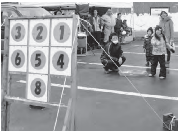
雪玉を使ってのストラックアウト