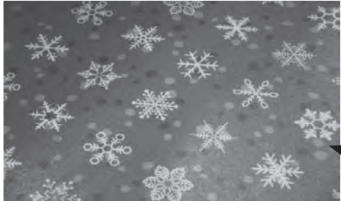
ブラインドには縄文土器やアイヌ語をデザインした模様、通路には雪の結晶などが配されています