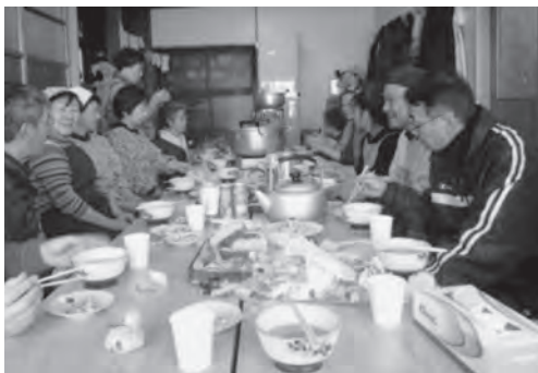
楽しい時間を過ごす曇月地区の皆さん

久しぶりの顔合わせに会話も弾み、以前好評だった芋もち汁を皆さんで協力し、手順良く作り、おいしくいただきました。参加者からは「出汁がきいていておいしい」と大好評でした。