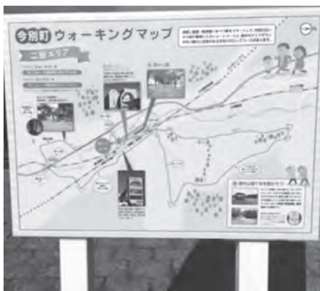
設置された今別町ウォーキングマップ

町では『健康長寿のまちづくり宣言』を受け、二股・今別・村元・袋月地区にウォーキングマップ看板を設置致しました。各地区それぞれショートコース・ロングコースとして2つのコースを設定しております(袋月エリアは+aコース)。全てのコースが掲載されている「今別町ウォーキングマップ」を各ご家庭に配布致します。全コース踏破して健康作りを始めてみてはいかがでしょうか。