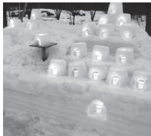
夜には幻想的な灯籠が飾られました

21日には、道の駅いまべつ主催の空き缶を蹴ってその飛距離を競う「荒馬コップ争奪雪上缶蹴り大会」が行われ、小学生以下男子「あらまくんJr」の部、小学生以下女子「たずなちゃんJr」の部、中学生以上男子「あらまくん」の部、中学生以上女子「たずなちゃん」の部の4部門に分かれ、子供から大人まで多くの方が参加しました。蹴った缶が遠くまで距離を伸ばすと参加者からは大きな歓声と拍手がわき、大いに盛り上がりました。