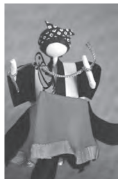
人形を製作するさざなみグループの皆さん（左の写真）と完成した荒馬人形