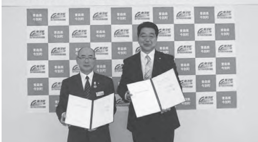
協定を結んだ阿部町長(左)と成田営業部長