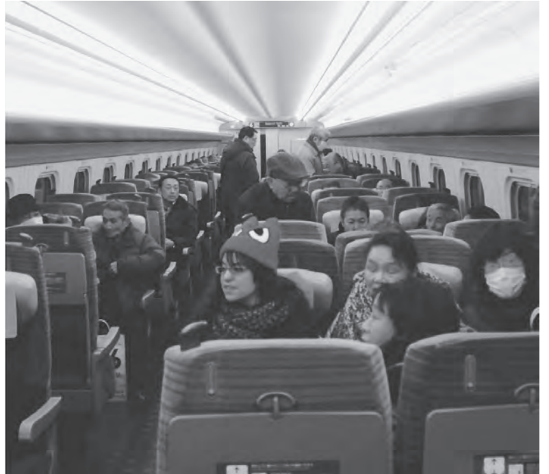
車内の乗り心地を確認する今別町関係者の皆さん