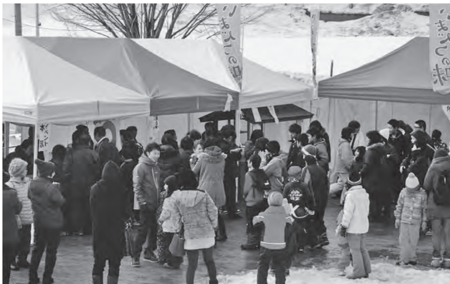
多くの方に来場いただきました

さらに、20日の夜には約400個の灯籠とイルミネーションが飾られ、会場を鮮やかにしました。