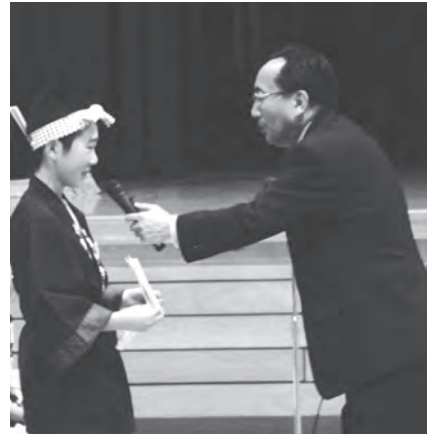
三村知事(右)に質問する生徒