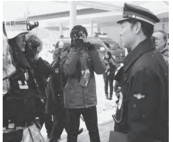
現場の状況を伝える奥津軽いまべつ駅職員