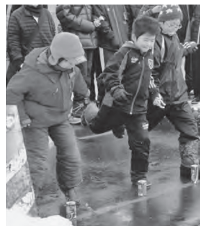
友達と距離を競う参加者たち