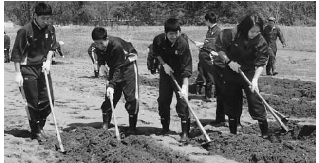
たくさん収穫できるように作業に取り組む生徒の皆さん

生徒は農園指導者からのアドバイスを真剣に聞きながら、土を耕したり、種芋を植え付けるなどの作業を行い、8月頃の収穫に向けて、元気に育つよう心を込めながら、一生懸命作業していました。