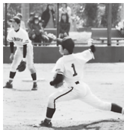
大健闘した今中野球部

4月30日、平内球場で中学校春季野球大会が行われました。平館中学校と対戦した今別中学校は初回に先制し、相手打線を抑えてきましたが、その後、同点に追いつかれ、逆転を許してしまい、1-2で惜敗しました。最後まで諦めず、チーム一丸となって戦う姿に、会場から大きな拍手が送られました。