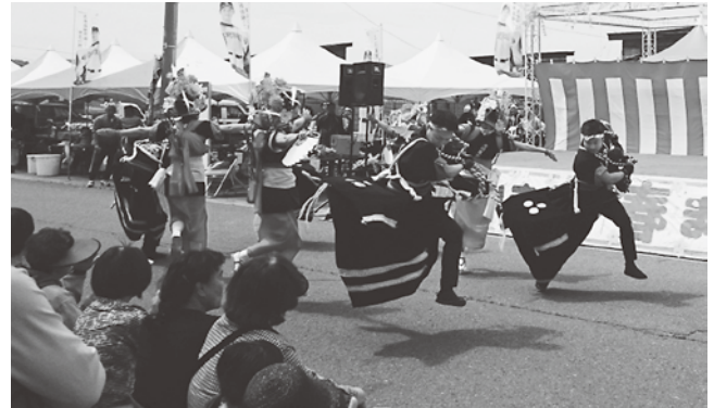
まつりを盛り上げてくれた今別荒馬保存会（左）と大川平荒馬保存会の皆さん