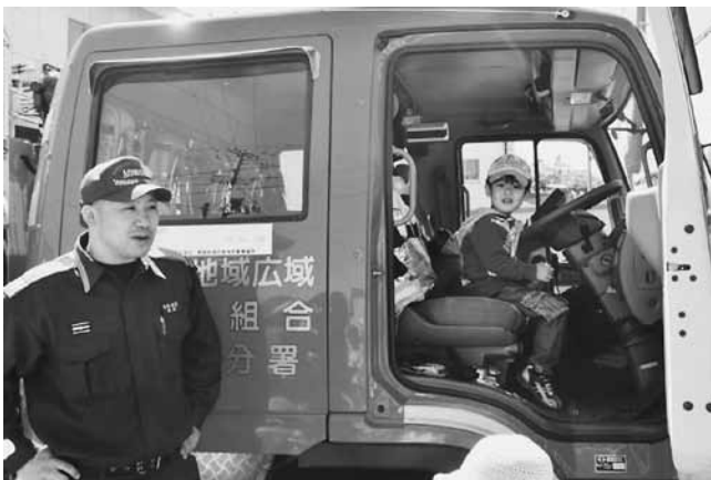
消防車の運転席に座り、気分は消防士！

その後、今別八幡宮に訪れ、鳥の鳴き声や植物を観察し、発見したことを友達同士で話し合っていました。