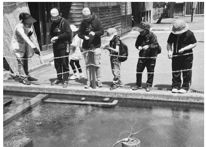
本覚寺で金魚にえさをあげました

お昼には参加者で、豚汁を食べながら、今回のウォーキングの感想や発見したきれいな花などを話していました。