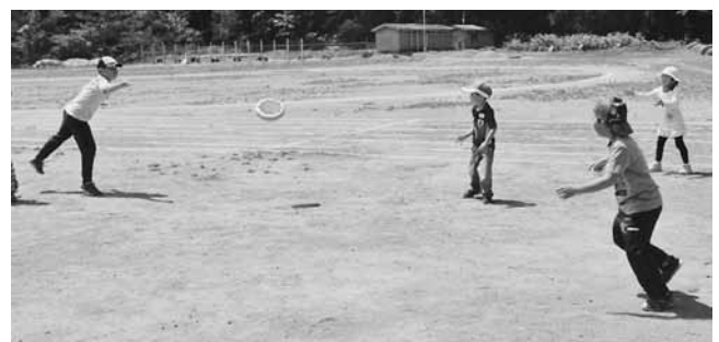
ドッチビーを楽しむ子ども達