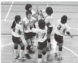
チームワークで優勝を果たした今中バレー部

4月30日、今別中学校体育館において、中学校春季バレーボール大会が行われました。今別中学校は、日頃の練習の成果を十分に発揮し、見事なチームワークで順調に勝ち進んだ結果、優勝を果たし、今別中学校は県大会出場を決めました。