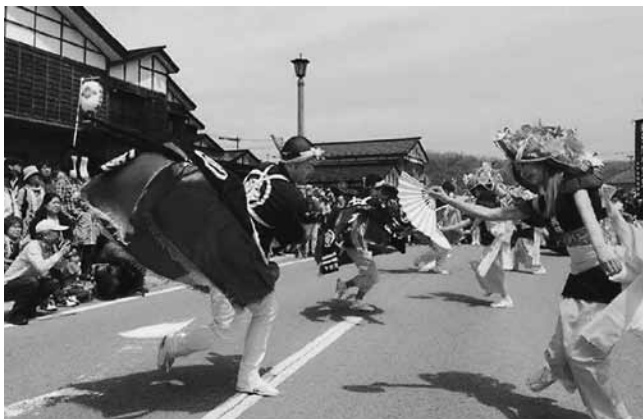
町の伝統芸能「荒馬」で祝福！

花嫁・花婿を祝福するように華麗に舞った今別荒馬保存会の演舞に大きな歓声と拍手が送られました。また、奥津軽ドリームの皆さんは、北海道新幹線「奥津軽いまべつ駅」PR用のはんてんを着込み、町の特産品の販売及び今別荒馬保存会の皆さんと一緒に今別町のPRに汗を流していました。