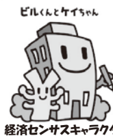
経済センサスキャラクター