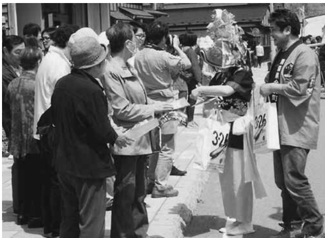
今別荒馬保存会、奥津軽ドリームが今別町をPR