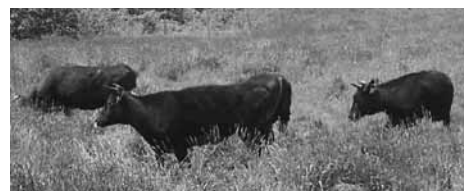
43頭の牛が放牧されました