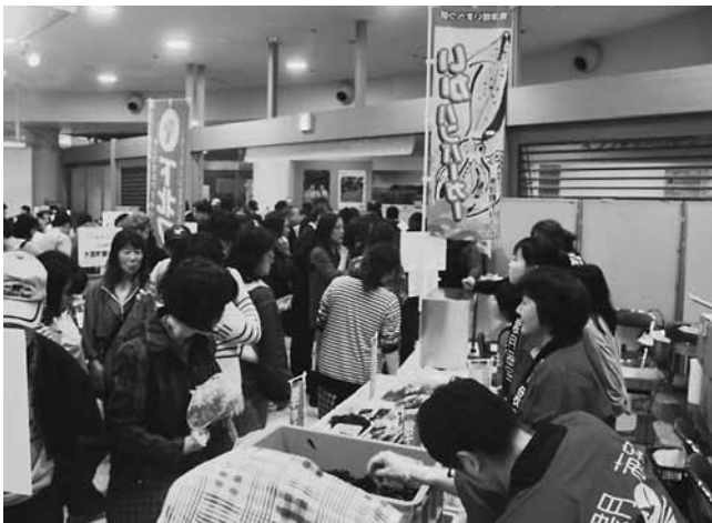
襲月海宝（手前）と奥津軽ドリーム（奥）のブースには多くの方が訪れました

会場では、青森県内の特産品が勢揃いし、今別町商工会が町の特産品「もずくうどん」、奥津軽ドリームが町の食材を活用した「いかハンバーガー」、襲月海宝は新鮮なわかめ等を販売しました。北海道新幹線「奥津軽いまべつ駅」が3月26日開業したこともあり、販売ブースは多くの買い物客でにぎわっていました。また、芸能アトラクションとして、今別荒馬保存会、大川平荒馬保存会の皆さんが町の伝統芸能「荒馬」を迫力ある演舞で披露し、会場の注目を浴びるとともに、8月に行われる荒馬まつりに来場いただくよう呼びかけました。