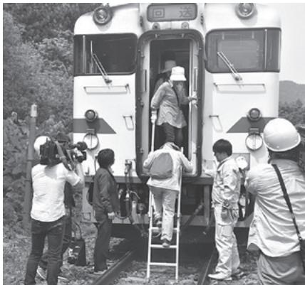
【訓練】職員の指示に従い避難

訓練では、JR職員が迅速な対応で乗客を避難させました。また、乗車していた参加者の中に負傷者がいたと想定され、JR社員と参加者が協力し、手当てをするなど連携しながら対応しました。その後、乗務員の指示・誘導により、車両から避難はしごで下車した参加者は、津波用避難階段を上り高台まで避難しました。