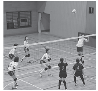
大健闘し、好成績を残した今中野球部とバレーボール部 (白のユニフォーム)