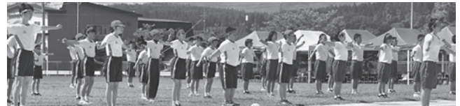
元気にラジオ体操をする選手の皆さん

初めのラジオ体操では、息の合った体操を披露し、応援合戦では、赤組・白組ともグラウンドに響き渡る大きな声で互いにエールを送りました。