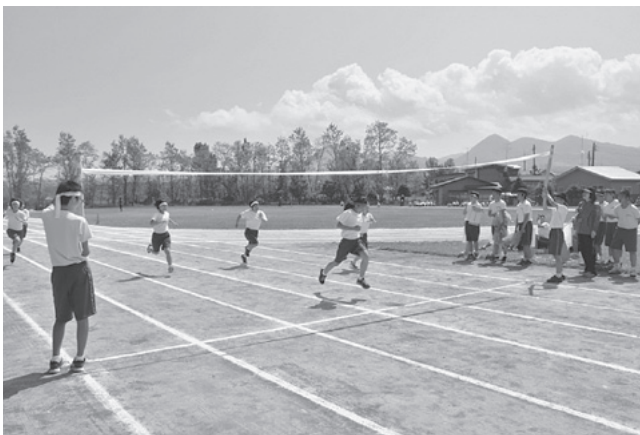
会場からの応援で全力疾走！

選手全員が出場した徒競走では、会場にかけつけた保護者やクラスメイトから熱い声援がおくられ、その声援に応えるようにすばらしい走りを見せていました。