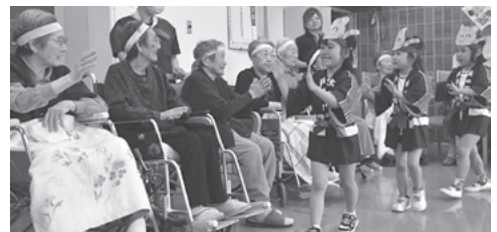
かわいい被り物を着用し、笑顔でハイタッチ！

昼食には、みんなでカレーをいただき、楽しかった今回のイベントについて話すなど、最後まで笑顔が絶えない交流会となりました。