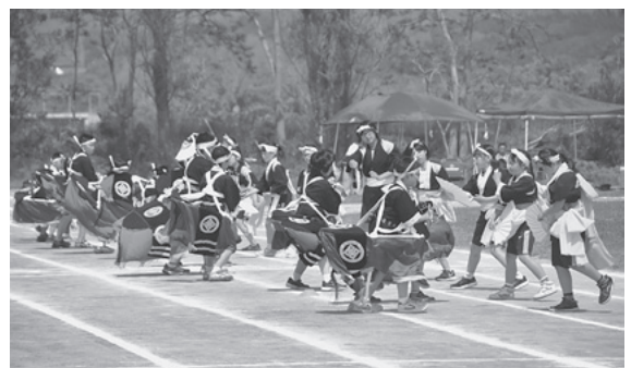
今小児童による町の伝統芸能「荒馬」