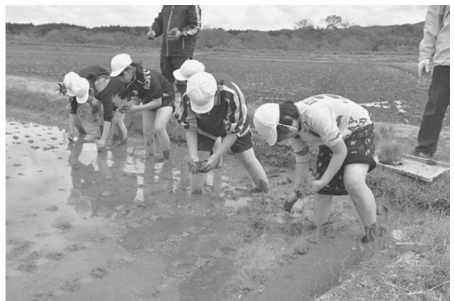
元気に育つように願いを込めて植える5年生の皆さん

また、児童たちは交代で田植え機に乗せてもらい、田植え機の作業の速さやきれいな仕上がりをみた児童たちからは歓声が上がっていました。