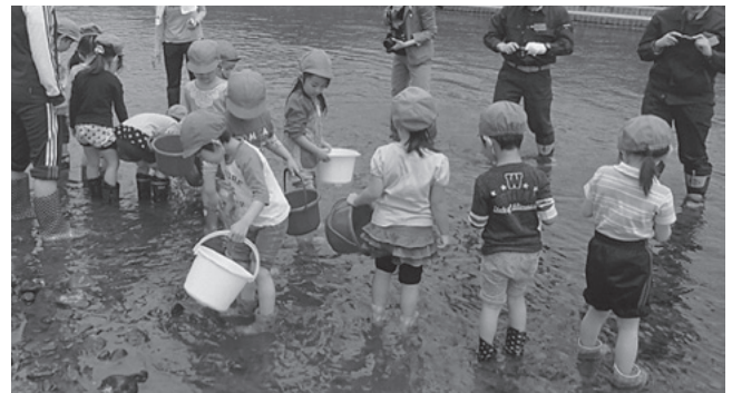
水、命の大切を学びました

放流後は、東青地域県民局農村計画課職員から水の循環、水と生物との関係についての話があり、園児たちは真剣に学習し、職員からの問いかけに元気に手を挙げて答え、水の大切さ・命の大切さを感じていました。