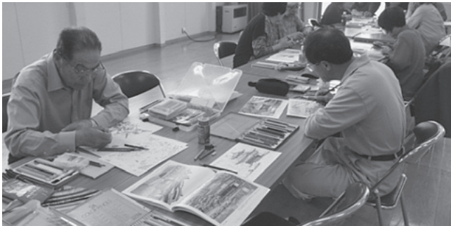
ぬり絵を楽しむ参加者の皆さん

参加した方々は「色の濃いところ、薄いところを色鉛筆で表現するのは難しいが、日々上達しているのが分かるのでとても楽しい」と笑顔で話してくれました。