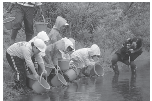
元気に育つように願いを込めて放流

児童たちはこの学習を通して、自然の大切さや生命の大切さを学び、ヤマメと触れ合い楽しい時間を過ごしていました。