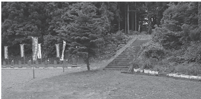
草刈りできれいになった観音様

6月19日、後町三階町町内会の方々20名が高野山観音様の草刈りを行いました。高野山観音堂が津軽三十三観音の1つであり、毎年多くの参拝客が訪れるため、毎年この時期に忠魂碑まで草刈りを行っています。