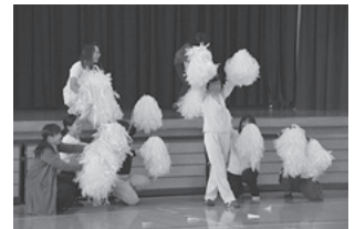
壮行式へ応援に かけつけた皆さん