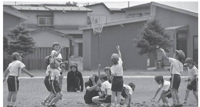
なかなか入らず苦戦！

各競技に全力で挑み、初の小中合同運動会を成功させた選手の皆さんに会場から労いのことばと大きな拍手がおくられました。