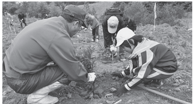
元気に育ちますように・・・

会場には漁業・林業関係者及びボランティアグループの皆さんが来場し、ヒバ300本、トチ、ナラ、クリ各100本を植えました。青森森林管理署職員から苗の植え方を教わった今別小学校の4・5年生も植樹を体験し、今別町がさらに自然豊かな町になるよう、大きく元気に育つように願いを込めながら一生懸命植えていました。