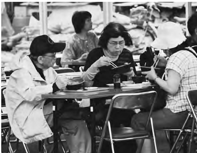
甘みがあっておいしい今別産ウニを味わう皆さん

また、今別荒馬保存会・大川平荒馬保存会の皆さんが町の伝統芸能「荒馬」を披露し、会場の多くの方々に魅了しました。