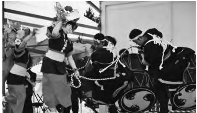
会場に訪れた多くの方々に町の伝統芸能「荒馬」を披露する今別荒馬保存会(左)と大川平荒馬保存会