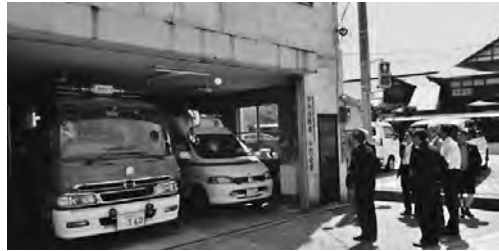
職員に聞き取りなどを行い、現状等を確認