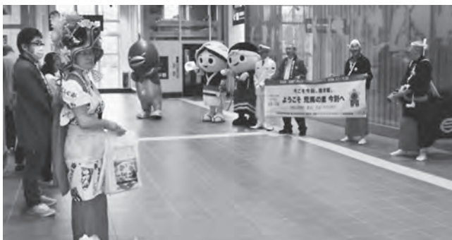
荒馬の衣装を着用し、荒馬まつりもPR

新幹線ホームと改札内コンコースで「ようこそ荒馬の里今別へ」と書かれた横断幕を掲げ、町の観光パンフレットや駅開業をPRするお菓子等を乗降客に配布しました。また、町のゆるキャラ「あらまくん・たずなちゃん」やマギユロウも一緒に出迎えを行い、記念撮影に応じるなど温かいお出迎えをしました。