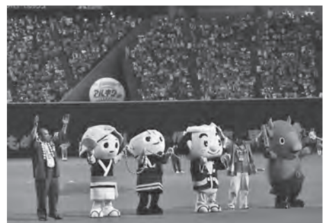
YMCAダンスで会場を盛り上げました

また、入場ゲート近くには市町村パンフレット設置ブースも設けられるなど、多くの方々に町の魅力や観光スポット等をPRしました。