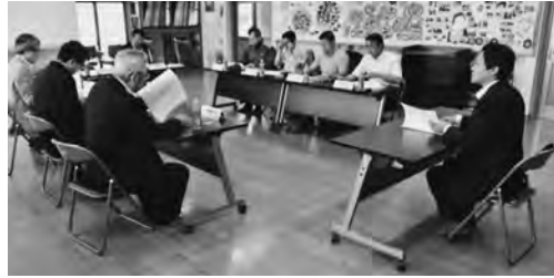
今後のスケジュール等について話し合う委員

今後検討委員会では、施設視察や規模・建設場所について話し合い、今年中に今別町、外ヶ浜町の両町長に検討結果を提出する予定となっています。