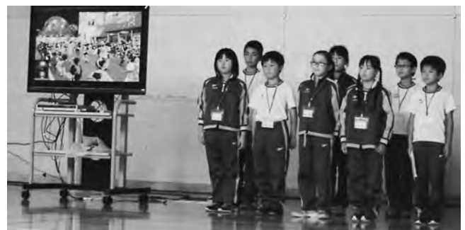
今別町の魅力を紹介する児童たち

到着後、知内小学校児童の皆さんに温かく迎えられた今小児童は笑顔で対面しました。午後にはお互いの学校紹介をし、手作りの名刺を手渡しするなど、楽しく交流していました。