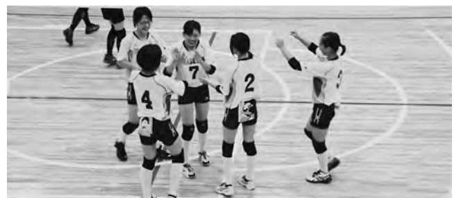
見事なチームワークで県大会でも大健闘した今中バレー部

2回戦でむつ市立川内中学校と対戦した今中バレーボール部は、相手に攻め込まれリードを許してしまう苦しい展開となり、チームワークと大きな声でボールをつなぎ、粘り強く戦いましたが、あと一歩及ばず惜しくも敗れてしまいました。試合終了後、今回で引退となった3年生部員に、チームメイトや先生方から労いのことばがおくられました。