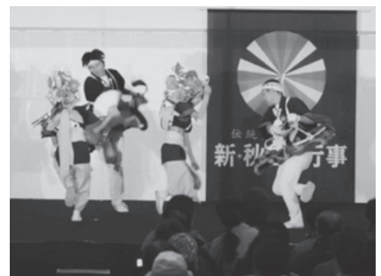
秋田県で華麗に舞う今別荒馬

秋田県出身の女性の方は「初めて今別町の荒馬を見たが、激しい動きで迫力がありとても良かった」と感動した様子で話してくれました。