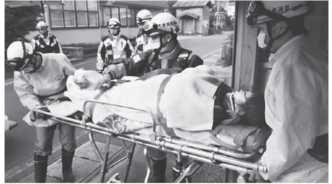
負傷者を手当て・救助訓練を行う中央消防署今別分署の職員

訓練終了後には、活性化センターにおいて陸上自衛隊による模擬救出訓練の見学や日赤奉仕団、町婦人防火クラブの皆さんが豚汁等の炊き出し訓練を行い、参加者に振る舞いました。