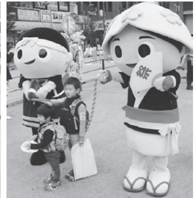
大人気の「あらまくんとたずなちゃん」