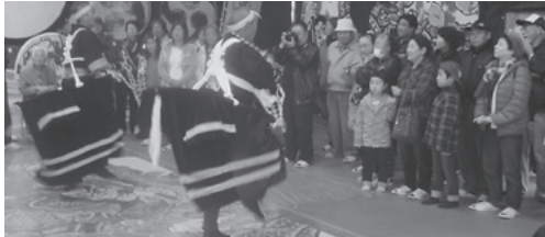
荒馬を初めて見た方にも感動が伝わっていました

海峡の家ほろづきでは大広間で休憩・昼食後、今別荒馬保存会の皆さんが荒馬を披露しました。演舞後には「勢いがあった」と話してくれたり手綱と記念写真を撮ったり、今別町の魅力に触れた会員の皆さんは楽しそうに過ごしていました。