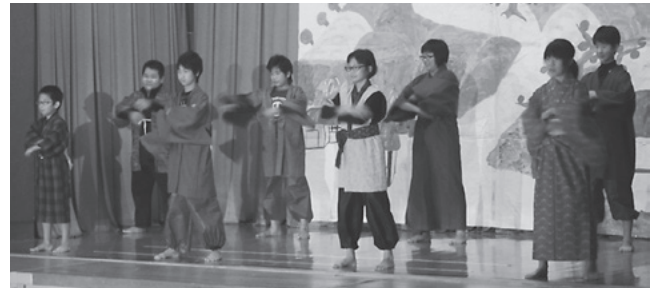
表情豊かな演技で最後の学習発表会を成功させた6年生

本番に向け一生懸命取り組んできた全校児童は練習の成果を発揮し、大きな声で発表したり表情豊かな演技で役になりきったり、なわとびで大技を披露したりと観客を夢中にさせ、児童一人一人の笑顔が輝いていました。