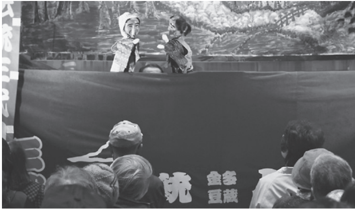
「金多」と「豆蔵」が繰り広げる漫才劇に会場は笑い声に包まれました

10月22日・23日、奥津軽いまべつ駅おもてなしイベント第1弾として、津軽伝統「金多豆蔵人形芝居」特別講演が開催されました。 中泊町無形民俗文化財の指定を受け、大人気の人形芝居というところで、2日間述べ約200人の方に来場いただきました。「金多」と「豆蔵」の津軽弁で繰り広げられる漫才が披露されると大きな笑い声が聞こえ、津軽民謡に合わせて人形の手踊りなどが行われると歓声があがるなど、楽しい講演となりました。