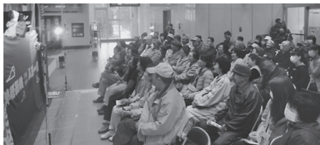
「金多」と「豆蔵」の掛け合いに駅舎内に笑い声が響いていました

青森市から来場した女性は「芸術性があり、おもしろくてとてもすばらしい。子供の頃にも見たことがあるが、それ以上に感動した。どんどん広めてほしい」と話してくれました。また、青森市から人形芝居を見に来たというご夫婦は「名前は聞いたことがあったが、見たのは今回が初めて。おもしろくて楽しかったです」と嬉しそうに話してくれました。