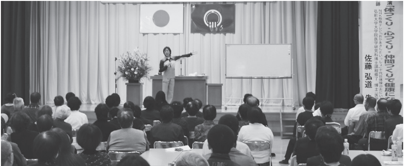
「病気になるように健康に気をつけて楽しく過ごしましょう」と講演されました