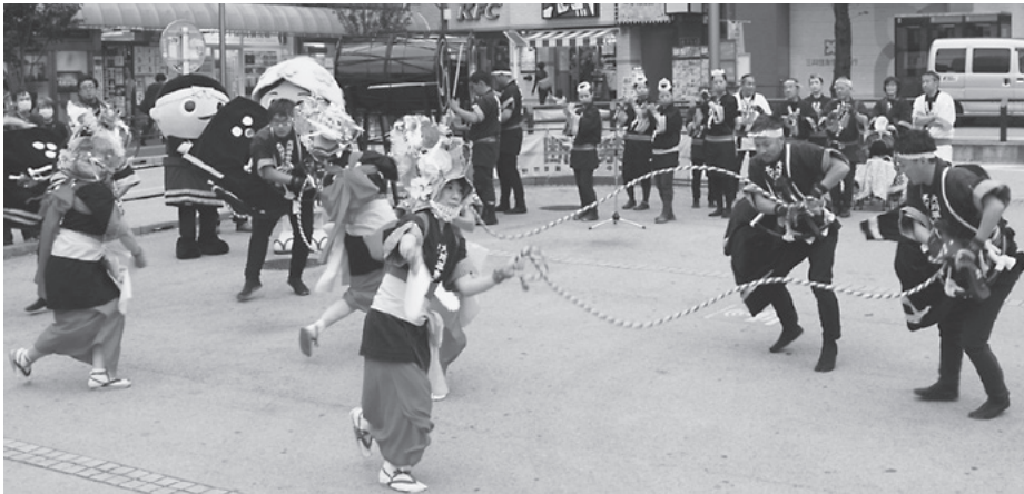
迫力の演舞で観客を魅了する大川平荒馬

伝統芸能発表では大川平荒馬保存会が参加し、ステージと中野駅前広場で町の伝統芸能「荒馬」を迫力ある演舞で披露すると、会場から大きな拍手が送られました。演舞終了後には保存会の皆さんや東青地域県民局職員と一緒に町パンフレット等を配布し、多くの来場者にPRしました。また、今別町のゆるキャラ「あらまくん・たずなちゃん」も会場に駆けつけ、記念写真を撮るなど大人気でした。