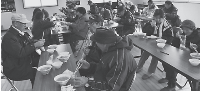
炊き出し訓練の豚汁は「体が温まる」と大好評でした

11月2日、「平成28年度今別町土砂災害防災訓練」が大川平地区で行われました。前日からの大雨により青森地方気象台が大雨洪水警報を発表し、土砂災害警戒情報により町が災害対策本部を設置し避難勧告を発令、さらに避難指示を発令するという災害想定で行われました。訓練に参加した町消防団第4分団が大川平地区へ避難を呼びかけたり、中央消防署今別分署の皆さんが負傷者を手当てしたり、どのように安全確保するか被害情報の収集・応急対策など災害が起きた場合のそれぞれの動き等を確認しながら防災訓練を行いました。