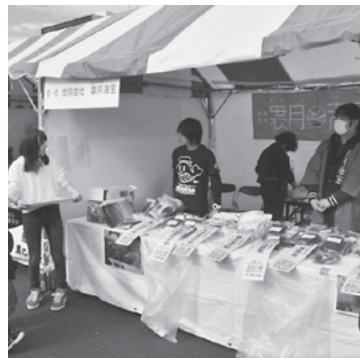
今別町を紹介しながら特産品等を販売する大川平加工グループ、町商工会(左)と合同会社「曇月海宝」

会場内名産品販売ブースでは、合同会社「曇月海宝」、大川平加工グループ、町商工会が出店し、多くの買い物客でにぎわっていました。