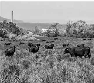
▲天気もよく、「モ〜」最高

5月15日、今別町営山崎放牧場において牛の放牧が行われ、今別町和牛飼育組合15戸の畜産農家が集まり、約40頭が放牧されました。10月末頃まで放牧し、その後、各畜産農家の牛舎へ戻ります。