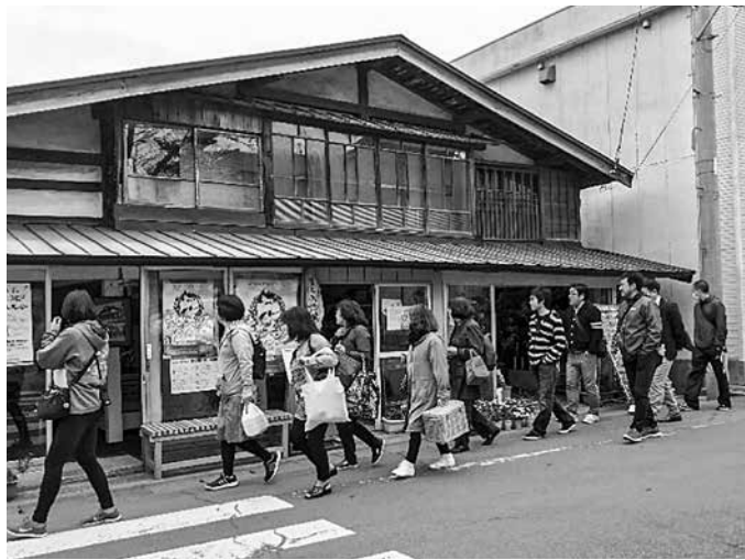
▶五所川原市（旧金木町）を散策する参加者ら