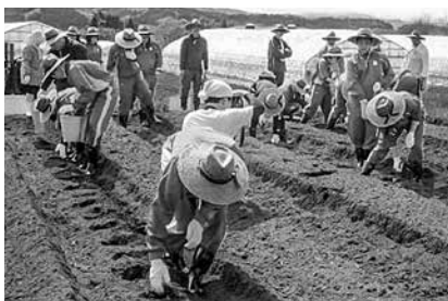
▶植え付け作業をする生徒ら

5月14日、青森北高等学校今別校舎では荒馬の里体験農園において農園実習を行いました。生徒らは農園指導者の指導を受け、豊作を願いながら種イモの植え付け作業を行いました。