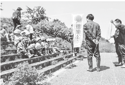
▲県担当者から説明を受ける園児ら

5月21日、今別川（海峡あすなる公園）において今別こども園の園児がアユの稚魚、約10,000匹を放流しました。この事業は、今別町内水面漁業協同組合が毎年実施しており、園児たちは「大きくなってね」と声を掛けながら放流しました。