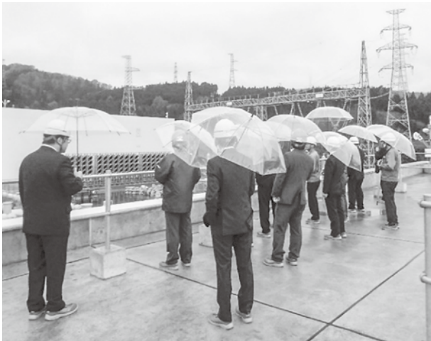
▲施設担当者から説明を受ける参加者ら