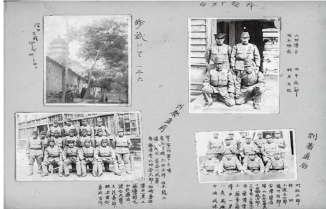
支那事変記念アルバム（昭和12年10月4日～昭和13年5月20日・同15年3月8日）＝澤田ひろ子氏所蔵

隊本部、歩兵大隊3個（歩兵中隊4個で編制）、機関銃中隊・歩兵砲中隊・連隊中隊各1個で編制され、人員は連隊長以下3525名で、連