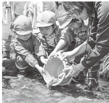
▲「大きくなってね」と放流