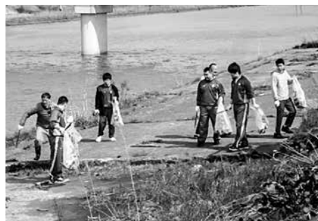
▶分別しながらゴミを回収

4月26日、青森北高等学校今別校舎の生徒が今別川の清掃奉仕活動を行い、大量の缶、プラスチック類等が拾い集められました。