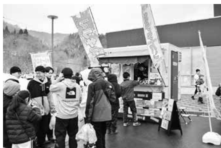
大人気だったハワイ料理