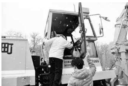
ロータリーへの乗車体験