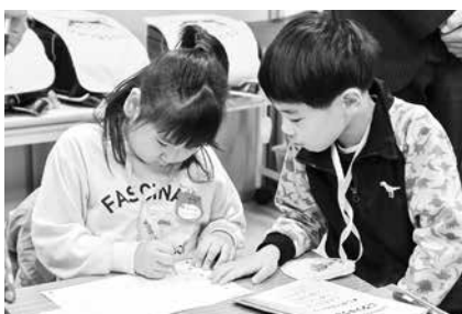
えんぴつも使いました