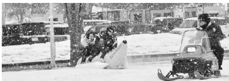
バナナボートで滑走

2月24日、いまべつ冬まつりも開催されました。アトラクションはポンプ車や除雪に使うロータリーなどが展示されたはたらく車展と、スノーモービルで引く張るバナナボートが行われました。さらにキッチンカーコーナーが昨年よりパワーアップし、8台のキッチンカーがいまべつ総合体育館の駐車場に集まりました。 来場者はタイヤシヨベルの運転席に乗って記念写真を撮影したり、キッチンカーでの美味しい料理を食べたり、冬まつりを楽しんでいました。