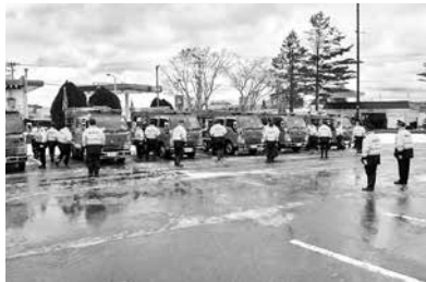
機敏な動きの機械器具点検