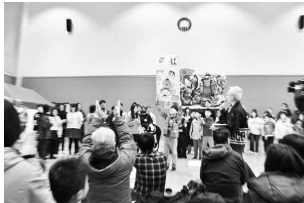
参加団体対抗の特大かるたを使ったかるた大会も行われました。木古内町の商工会青年部も飛び入り参加し、会場を大いに盛り上げました