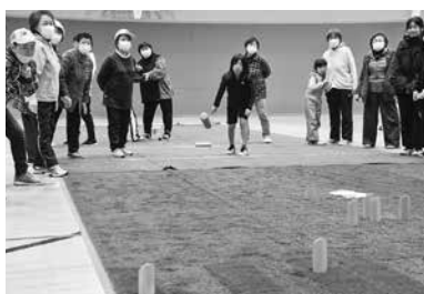
高得点を狙った一投