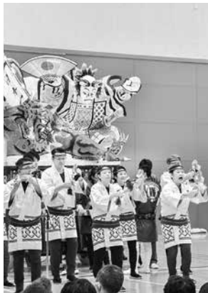
横内ねぶた実行委員会 & プロクレアねぶた囃子方 & 青森ねぶた跳人衆団跳龍會