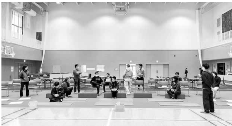
手伝ってくれた仲間たち

さて、来場してくださった皆さんにとっては、どんなさきっちょフェスだったでしょうか？