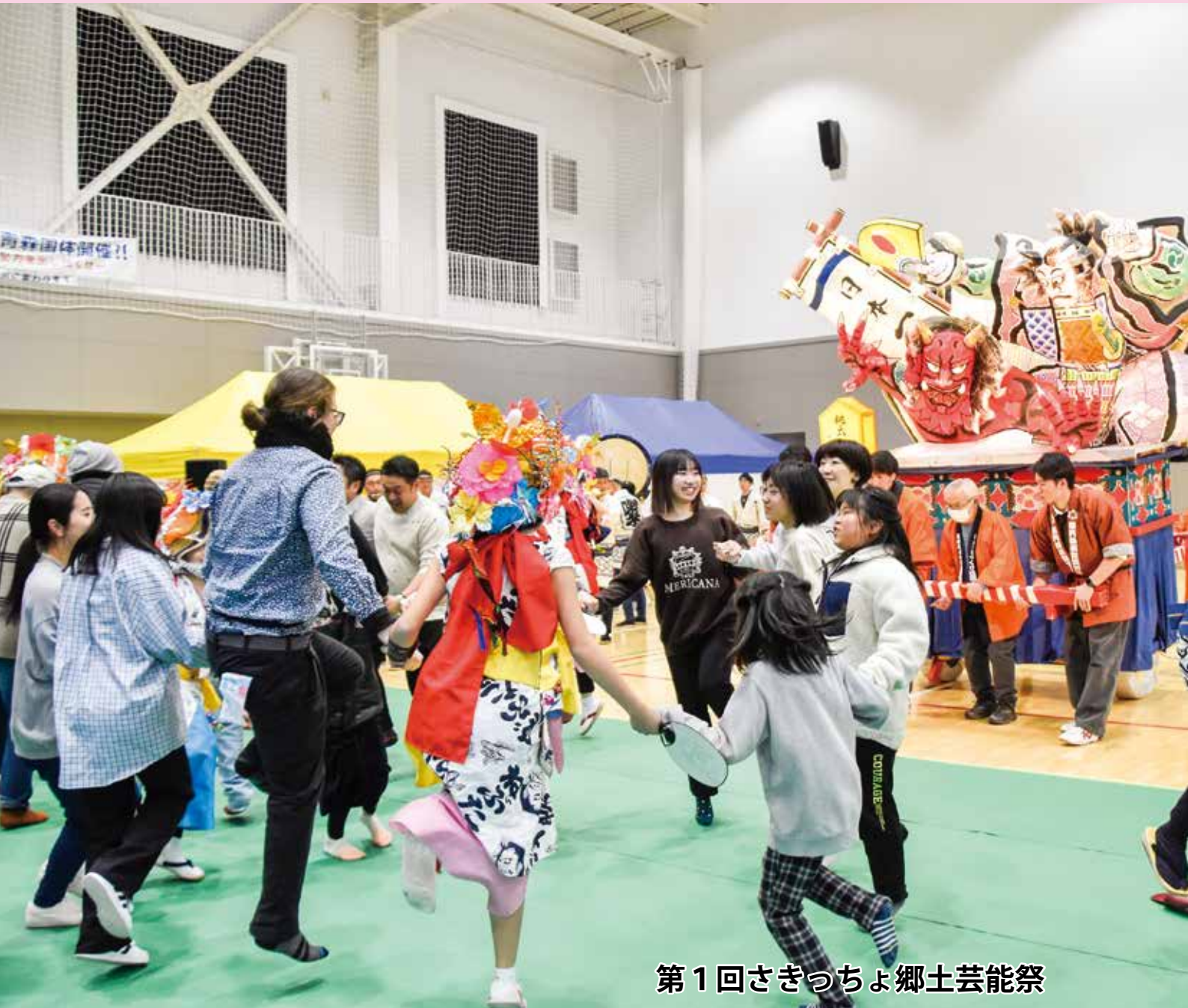
第1回さきつちよ郷土芸能祭