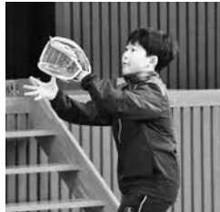
キャッチできるかな？