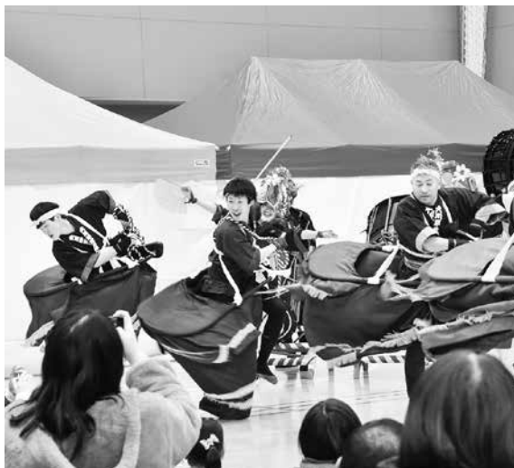
大川平荒馬保存会