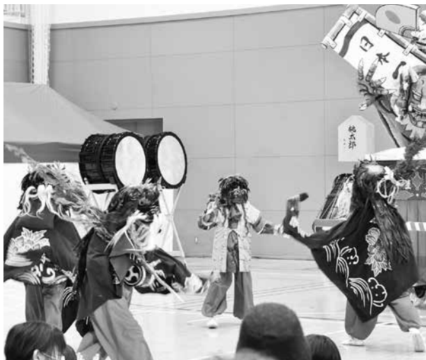
吉野田獅子踊保存会

取りを務めたのは横内ねぶた実行委員会。体育館に響き渡る囃子と跳人のかげ声は来場者を魅了し、最後は出演者やスタッフ、来場者を巻き込んで総踊りが行われました。