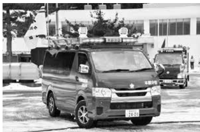
本部分団の新しい指揮車初出動

団長の訓示では、昨年は火災も遭難もなく良い一年だったこと、自分たちの地域は自分たちで守るという気持ちで消防団活動をしてくださいと団員を激励しました。