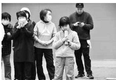
どこに投げようかな

交流会後半は蓬田村のモルツク経験者の方と町の小学生と町民の方が混合チームを組み、総当たり戦が開催されました。狙った数字が書かれた棒に当たると歓声が上がリ、勝利したチームはハイタッチして喜ぶなど、とても良い交流会になりました。参加者の方は「子どもたちと一緒にモルツクができて、とても楽しかった」と感想を述べていました。