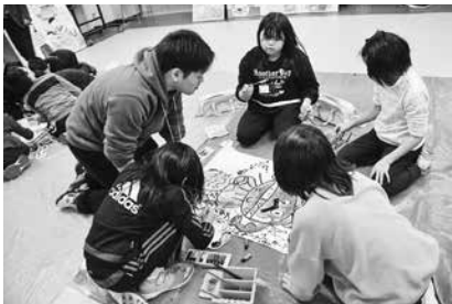
特大かるた作りの様子 小学校(上)、中学校(下)