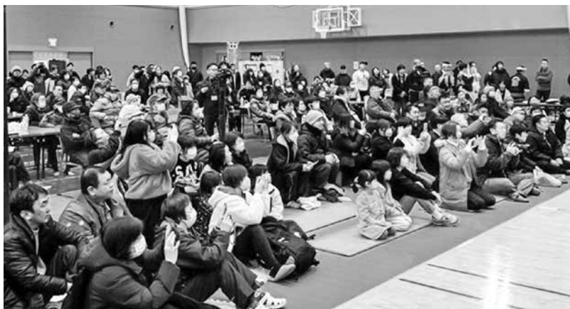
彼らがいたから多くの人が楽しめました