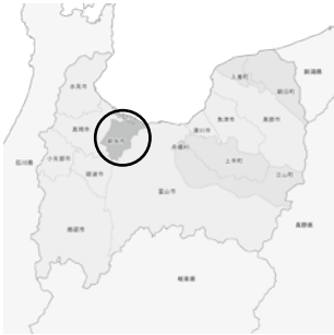
地図内黒丸が富山県射水市

現地の名物を食べる機会があり、漁港敷地内にある食堂で提供していたぶり丼は寒ぶりのシーズンということもあって新鮮で脂がのり、とても美味しかったです。富山BLACKラーメン発祥の店で食べたラーメンは、濃い味が好きな私も驚くほどの濃さで、青森にはない味でした。被災地のものを消費することも一つの支援となりますので、富山県を訪れた際は一度ご賞味いただきたいです。