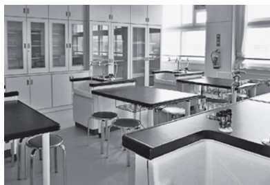
今別小学校調理室