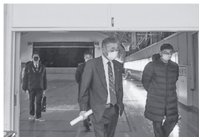
今別小学校体育館