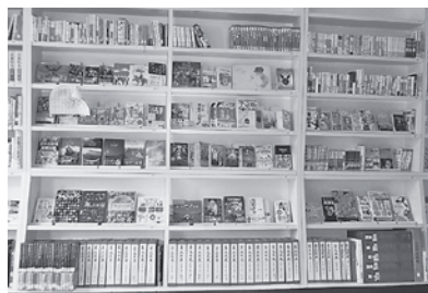
今別小学校図書室