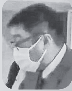
田中 哲也 議員

3月定例会では、4名の議員が登壇し、直面する町の重要課題について、町執行部の考えを問いました。その主な内容をお知らせします。