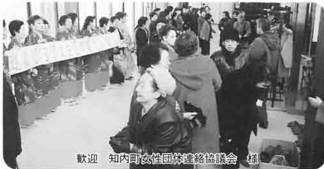
歓迎 知内町女性団体連絡協議会 様