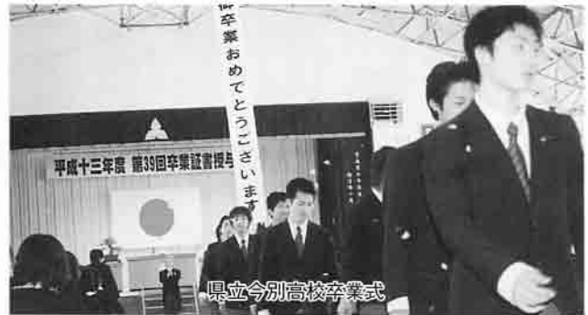
県立今別高校卒業式