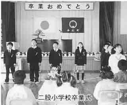
二股小学校卒業式