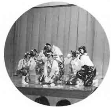
知内町でミッキーマウス