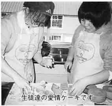
生徒達の愛情ケーキです

生徒のほとんどがお菓子作りが得意なので、ケーキ作りはスムーズに行われ、メッセージとラッピングもうまくできました。