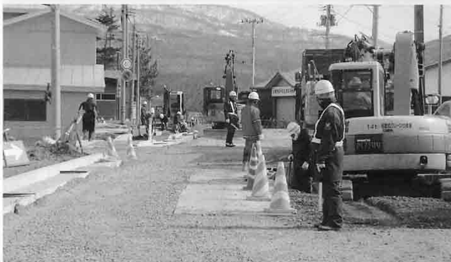
村元大川平線道路改良工事の状況