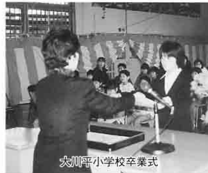
大川平小学校卒業式