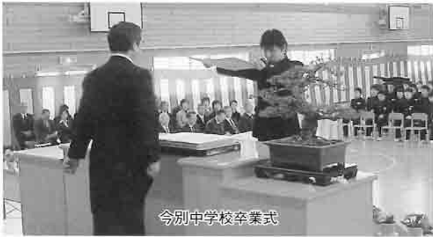
今別中学校卒業式