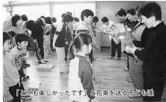
『とても楽しかったです』と花束を送る子ども達

これらの催し物に、ひまわりの会の方々も口々に「ボランティアをして良かった。子ども達がこんな心のこもった贈り物をしてくれるなんて思ってもいませんでした」と話していました。