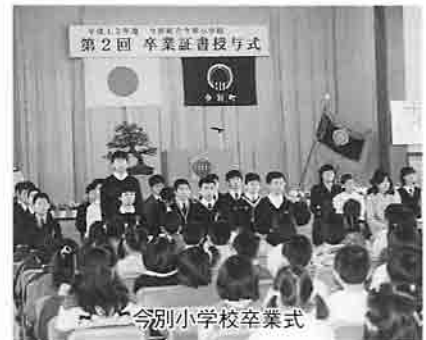
今別小学校卒業式