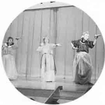
知内町でアラビアンナイト