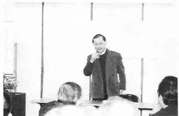
今別川に自然をもとす川づくり