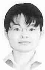
城 教諭 城 教諭

康な子どもを育成を目指し て精一杯頑張る、保護者や 地域の期待に応えていきたく いと思えます。少人数の学 校なので、児童、教職員と 共に歩む態度で学校経営に 当たりたいと思えます。ど うぞよろしくお願います。