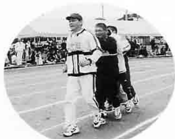
チームワークバツガン