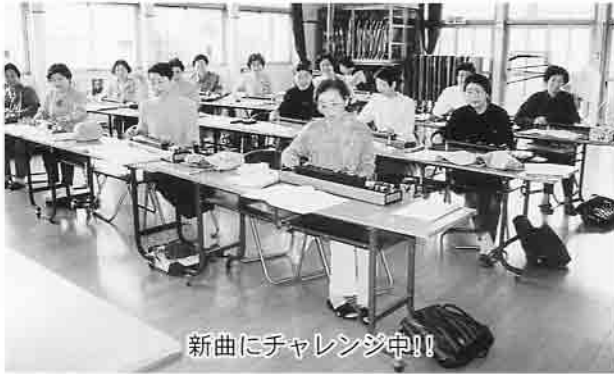
新曲にチャレンジ中!!

同サークルは月に3回か ら5回公民館で練習し、産 業と文化のまつりなどの機 会に腕前を披露しています。 また、9月には三厩村、平 館村、今別町三町村合同交 流会を企画し、会員たちは その日のために特に練習に 熱が入っていました。