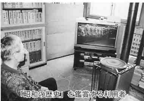
「昭和の歴史」を鑑賞する利用者