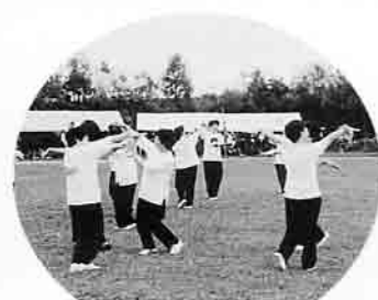
婦人部の皆さんも参加