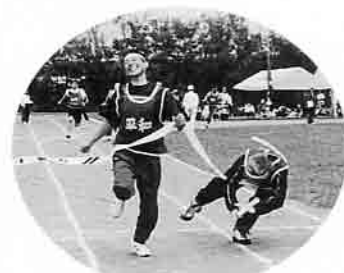
ゴールでこげちゃった