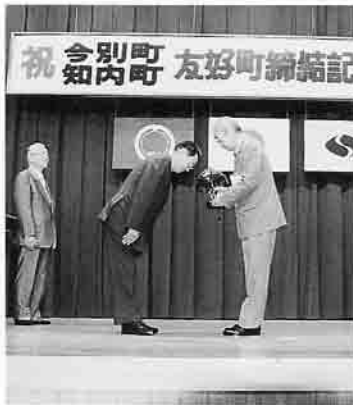
知内町よりステンドグラスの電気スタンドを