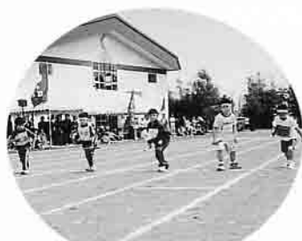
ヨーイドン！負けないぞ