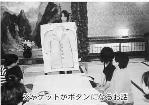
ジャケットがボタンになるお話