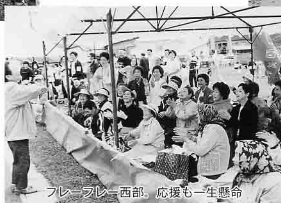
プレープレー西部。応援も一生懸命