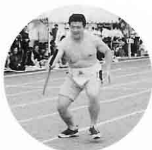
ドスコイドスコイ