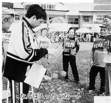
なんぼ入ったべな