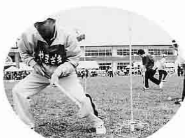
グランドゴルフも力が入ります