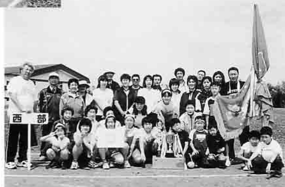
今年も優勝の西部チーム