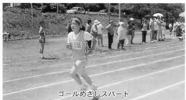
ゴールめざしスパート