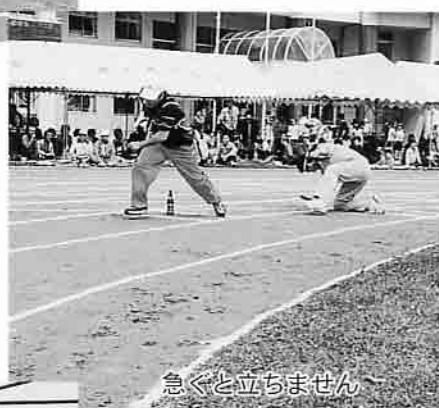
急ぐと立ちません