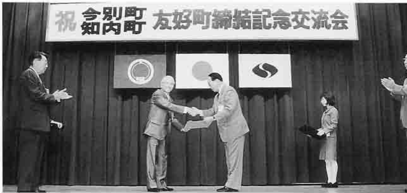
友好の証を取り交わす両町長

今別町・知内町友好町締結記念交流会が、7月12日知内町中央公民館において関係者104名が参加し、盛大に行われ両町民の一層の友好促進と、両町の更なる発展を願い、友好を取り交わしました。