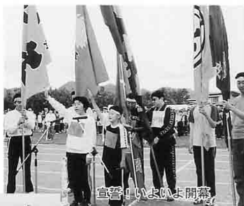
宣誓！いよいよ開幕