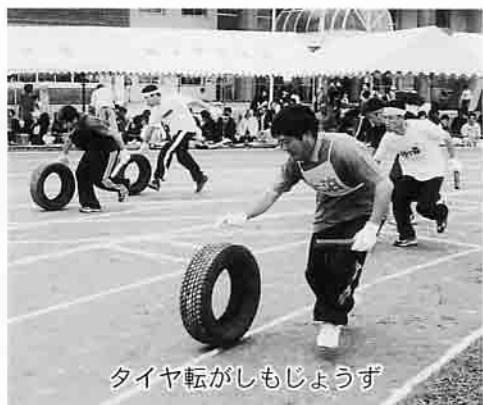
タイヤ転がしもしょうず