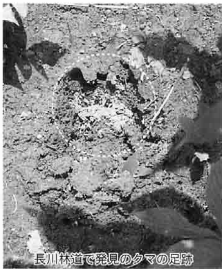
長川林道で発見のクマの足跡

交番では、山に入るときは複数で音の出るもの（例えばラジオ、鈴など）を持参し、万が一、クマと出会ったらゆっくり立ち去りまた、遠くで発見したら静かに立ち去るなど、くれぐれも注意するよう呼びかけています。