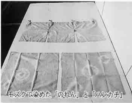
モズクで染めた「のれん」と「ハンカチ」