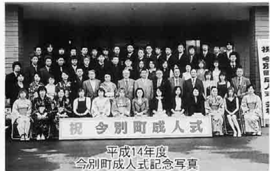
平成14年度 今別町成人式記念写真