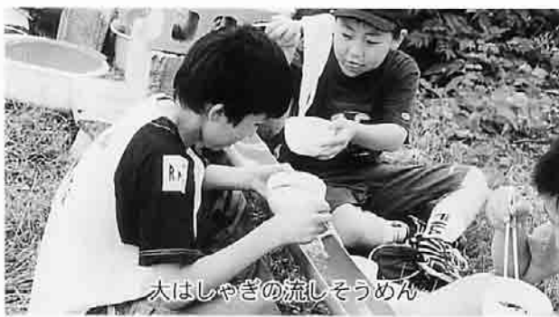
大はしゃぎの流しそうめん

午後からは、いちばん楽しみにしていた屋台村、キャンプファイヤーの準備を子ども達が協力し、各持ち場で一生懸命頑張りました。 いよいよ最終日、町立体育館でボール遊び。この2日間、運動らしい運動がなかったのも、子ども達は思いっきり体を動かしました。昼食は、流しそうめんには大はしゃぎ。流れてくるそうめんを上手にすくって食べる醍醐味を体験し、子ども達も大満足の様子でした。