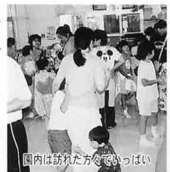
園内は訪れた方々でいっぱい

店が並び、まつりの情緒を一層かもしだして、園内でも、チョコバナナ、クレープ、花火など小物の出店や、ホールでは先生達手作りの影絵「つるの恩返し」にみなさん聞き入っていました。