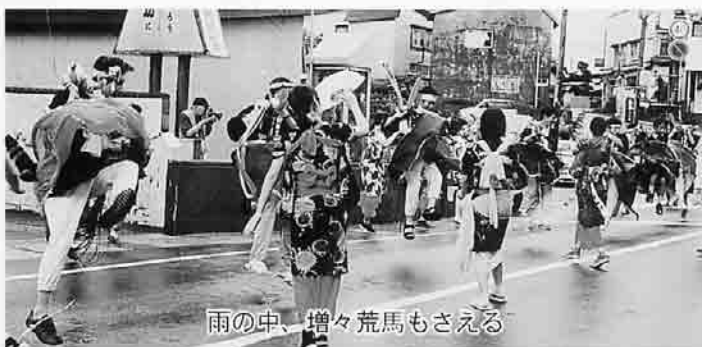
雨の中、増々荒馬もさえる

会場では今別牛、トンネル巻き、もずくうどんの特産品など、10店舗の出店もあり大変なにぎわいを見せました。また、歌謡ショー、ひまわりの会によるレクダンスなどの催し物も行われ、まつりは佳境を迎えました。クライマックスの海峡花火大会は、詰め掛けた約2,000人の観客が夜空に咲く大輪の花に思わず歓