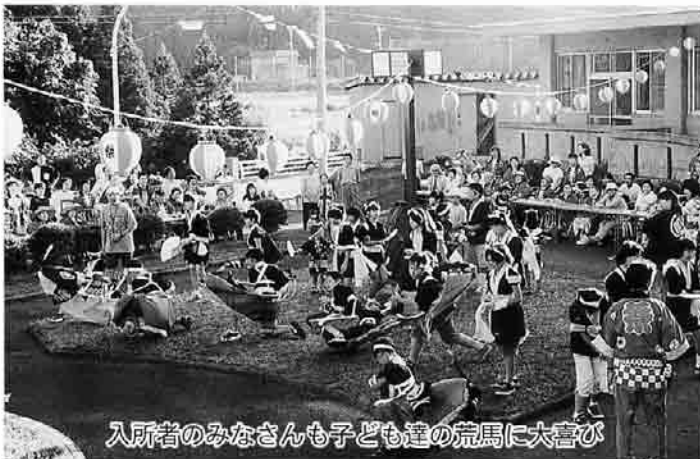
入所者のみなさんも子ども達の荒馬に大喜び

各地区のボランティアや家族、町関係者など200人が集った会場には、紅白幕の仮設ステージ、飾られた200個の提灯もまつりの雰囲気にあふれ、さらにおでん、焼きそばなどの出店もあり大変な賑わいを見せました。