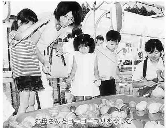
お母さんとヨーヨーつりを楽しむ