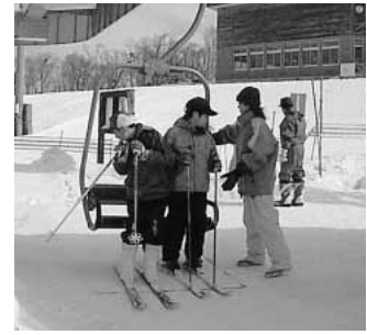
全職員が交替で従事するスキー場

各地区では、三厩村の飛び地合併に意見が集中し、町長は「三厩村の飛び地合併報道には驚いた。三厩村とは隣接町村であり、昔から多くの交流もあったので、三厩村との合併はだめとは言えない」の説明に参加者は神妙に聞き入っていました。出席者からは「今別町