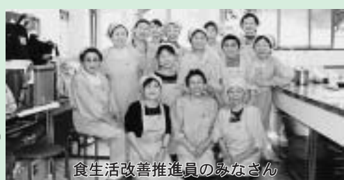
食生活改善推進員のみなさん

地元でとれる海藻をテーマに「生きがい健康づくりと敬老の集い」では4種類の料理を作りました。海藻には、ミネラル、ビタミン、カルシウム等たくさんの栄養があります。ぜひ、作って食べてみてください。