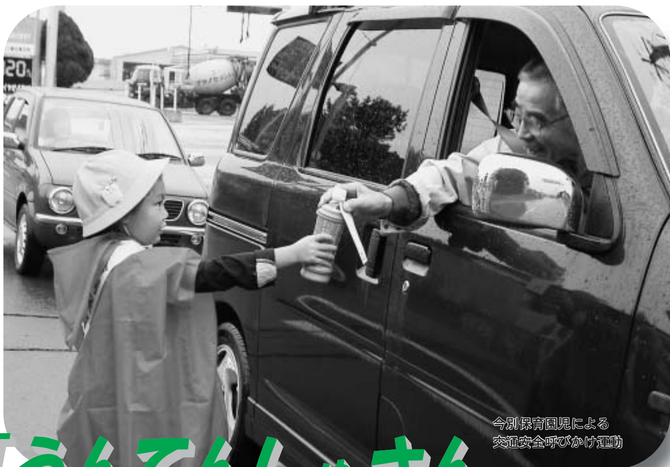
今別保育園児による 交通安全呼びかけ運動