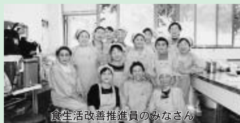
食生活改善推進員のみなさん

地元でとれる海藻をテーマに「生きがい健康づくりと敬老の集い」では4種類の料理を作りました。海藻には、ミネラル、ビタミン、カルシウム等たくさんの栄養があります。ぜひ、作って食べてみてください。