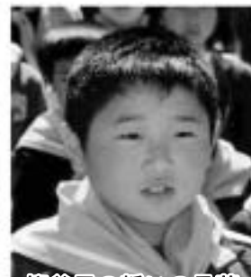
柳谷君の誓いの言葉 素晴らしかったです。