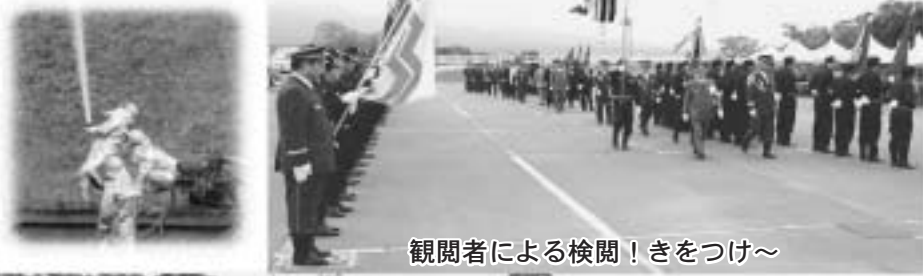
観閲者による検閲！きをつけ～