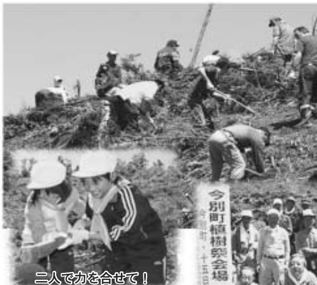
二人で力を合せて！