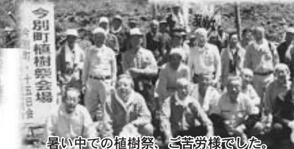
暑い中での植樹祭、ご苦労様でした。