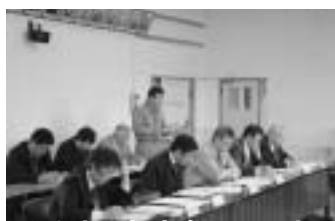
↑↓中間報告会風景です。

単に効果を期待するのではなく、一人でも多くの方に駅を利用していただくためには、どうしたら良いかなど、町民を含め多くの方々とお話し合い、進めることが大事と考えます。