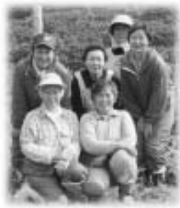
作業を終えて一息！ Vic&ウーマンの皆さん