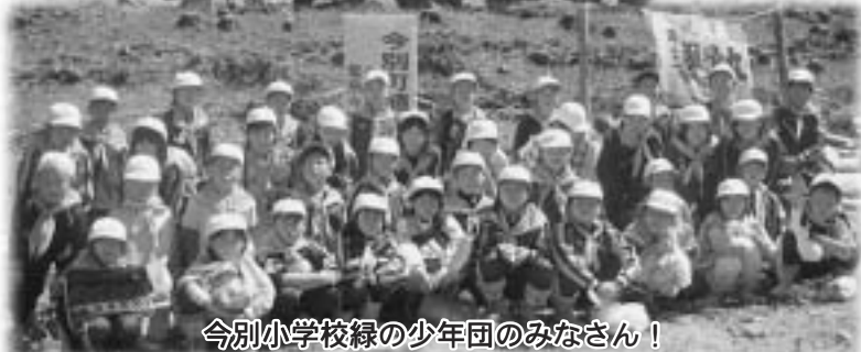
今別小学校緑の少年団のみなさん！