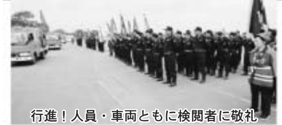
行進！人員・車両ともに検閲者に敬礼