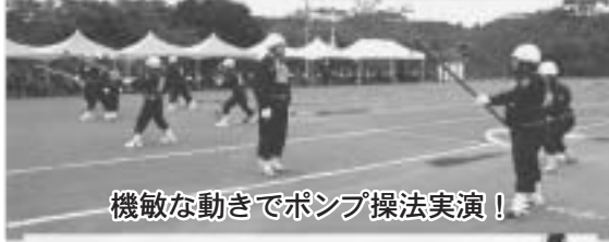
機敏な動きでポンプ操法実演！