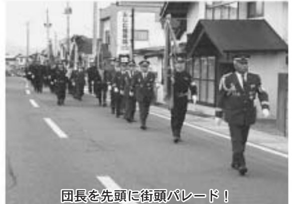
団長を先頭に街頭パレード！