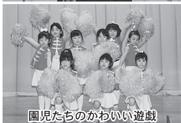
園児たちのかわいい遊戯