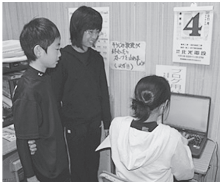
慣れた手つきで更新をする運営委員