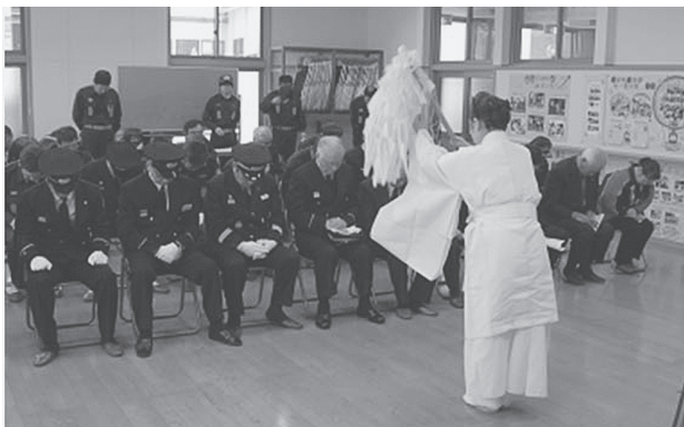
無事故・無火災の祈願