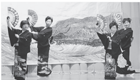
やっぱり着物に扇子は映えますね〜