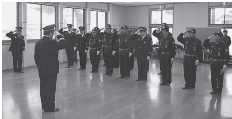
事故や災害の未然防止に努めます