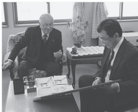
受賞を小鹿町長(写真左)へ報告