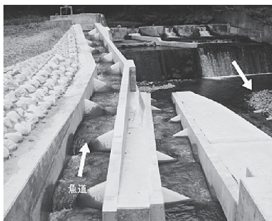
完成した第一安兵衛頭首工の魚道

◆安兵衛地区環境公共推進協議会 （事務局：役場 産業建設課 産業）TEL 35-3005