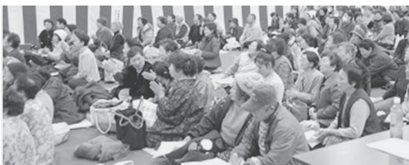
会場を埋め尽くすほどの来場者で賑わいました