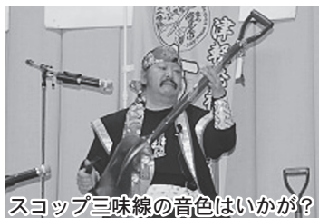
スコップ三味線の音色はいかが？