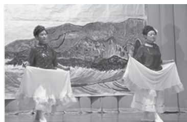
よっ!お嬢さん!きまっています