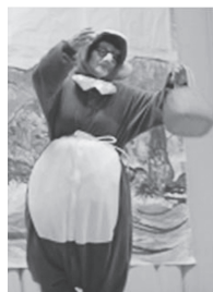
たぬきが登場し、会場をわかしました