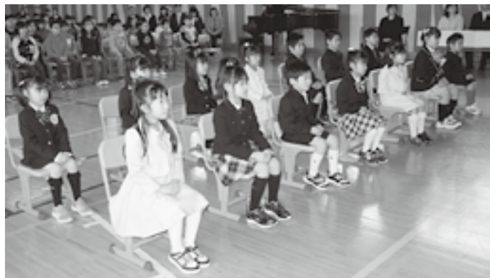
心に残る楽しい思い出をいっぱいつくってね!

今年度今別小学校に入学した新1年生14名を紹介します ( )内は名前のふりがな及び将来の夢です