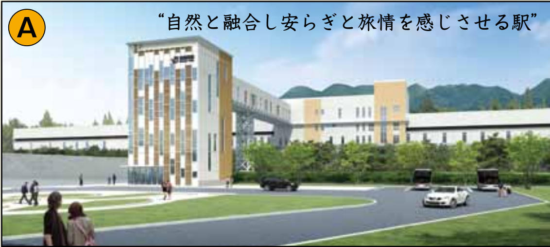
“自然と融合し安らぎと旅情を感じさせる駅”