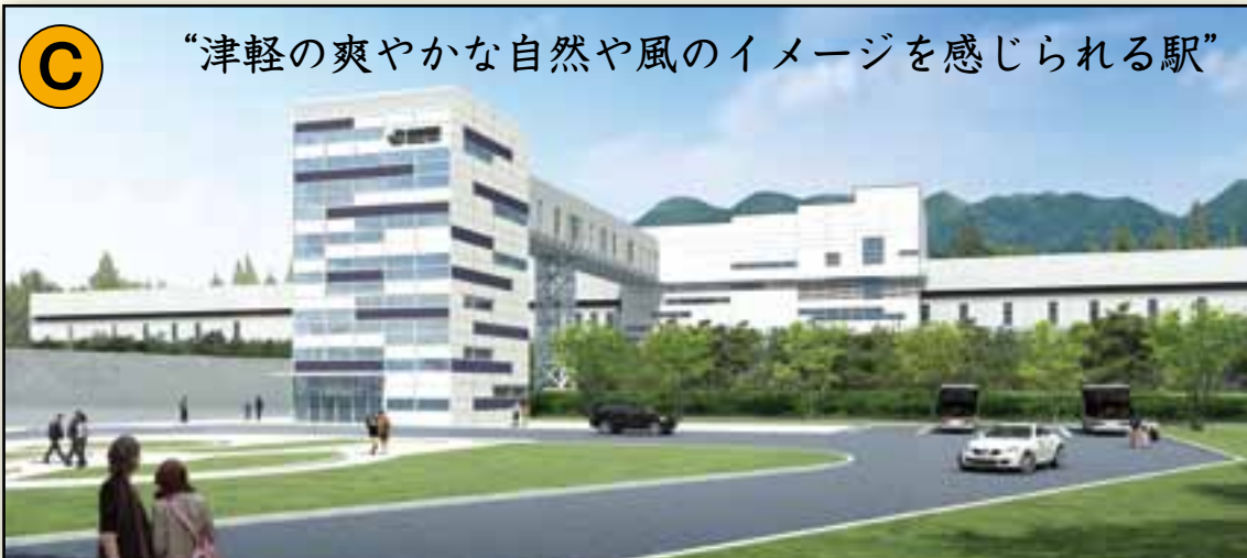
“津軽の爽やかな自然や風のイメージを感じられる駅”

《問合せ及び応募先》 〒030-1502 青森県東津軽郡今別町大字今別字今別167 今別町 企画課 新幹線係 TEL 0174-35-3012 FAX 0174-35-2298