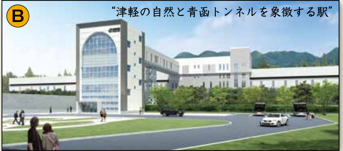
“津軽の自然と青函トンネルを象徴する駅”