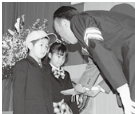
新入生には安全帽とランドセルカバーが贈られました