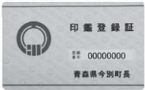
印鑑登録証【黄色いカード】

印鑑登録証【黄色いカード】に引き換えをしていない方は早めに手続きをして下さい。なお、カードを紛失した場合はあらかじめ申請が必要です。ご不明な点は下記までお問い合わせください。