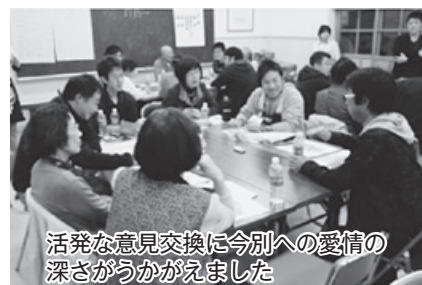
活発な意見交換に今別への愛情の深さがうかがえました