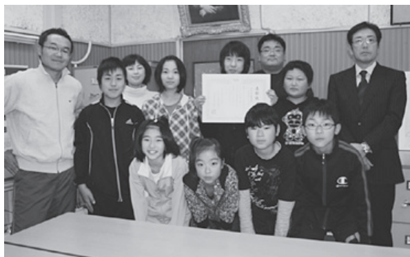
県代表に選ばれ喜ぶ運営委員と先生方

今後の日程では12月初旬にベスト8と特定テーマに沿った賞2校の選考が行われ、1月には全10校の中から大賞を含めた各賞が決定します。