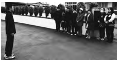
元気なあいさつをする中学生