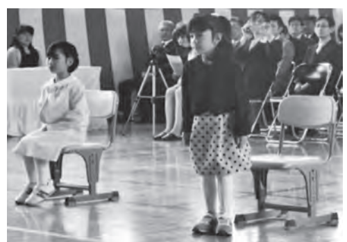
元気な声で返事をする新1年生