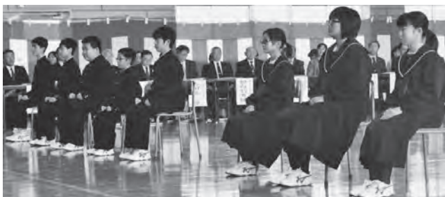
真剣な表情で式に臨む新入生