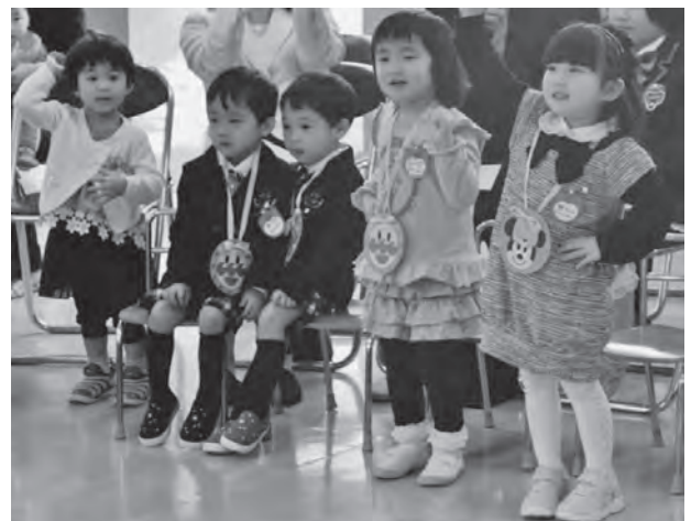
元気に踊る新入園児