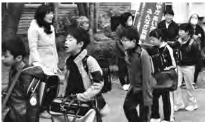
元気なあいさつで登校する小学生

今年度も、学校支援ボランティアの方々によるあいさつ運動がスタートしました。月に1回、小学校、中学校で行っており、「おはようございます!」と、とても元気な子どもたちのあいさつが響き渡り、活気のあるあいさつ運動が行われていました。