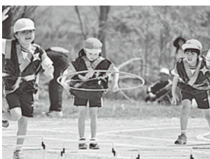
小学生による障害物競走