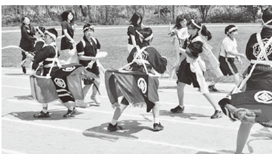
荒馬を披露する小学生と保護者の方々

午後には小学生による「荒馬」の披露が行われ、保護者の方々も一緒に参加し、元気よく跳ねる馬と華麗な手綱に会場からは盛大な拍手が送られました。