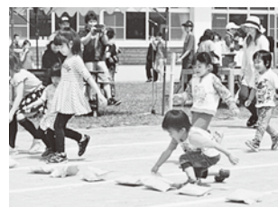
幼児による宝さがし