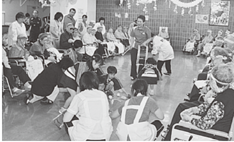
園児との交流会を楽しむ入居者の方々

入居者の方々は交流会をとっても楽しみにしていた様子で笑顔が絶えない楽しい交流会となりました。