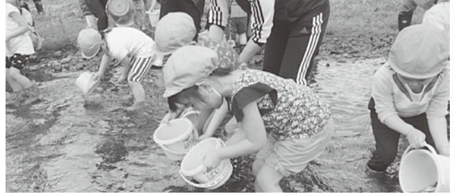
声を掛けながら放流する園児たち

6月13日、海峡あすなろ公園横の今別川において今別子ども園の園児がイワナ（稚魚）の放流を行いました。園児たちは「大きくなってね」と声を掛けながら放流しました。