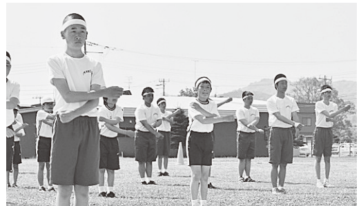
元気いっぱいラジオ体操