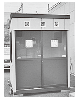
アスクール裏口に設置された喫煙所