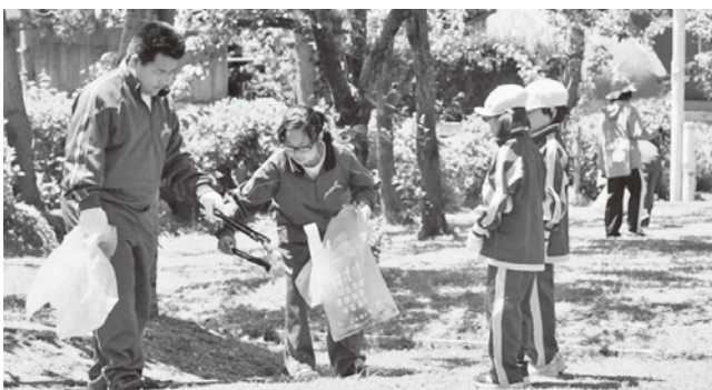
役割分担を決めて回収しました

6月6日、小・中学校合同による奉仕活動が行われました。あすなる公園、さざなみ公園、今別橋下の町内3カ所をグループに分かれ、燃えるゴミを拾う人、燃えないゴミを拾う人などと役割を分担しながら回収し、とても綺麗になりました。