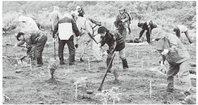
植樹する参加者の方々

あいにくの雨で今別小学校「緑の少年団」は参加できませんでしたが、会場へ集まった漁業・林業関係者及びボランティアグループの皆さんが、ヒバ、トチ、ナラ、クリの苗木約600本を手際よく植樹しました。