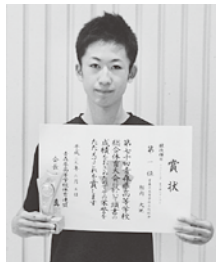
賞状とトロフィーを手にする相内選手