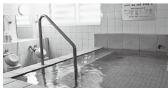
【問合せ先】 海峡の家ほろづき 町役場企画課