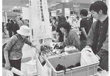
今別町の特産品、自慢の味を買い求める来場者