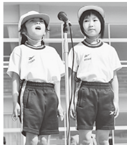
運動会頑張ります