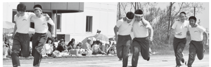
息を合わせて転ばないように