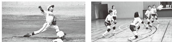
大健闘した今別中野球部と女子バレーボール部

6月17日、18日蓬田村を会場に「東郡中学校体育大会夏季大会」が開催されました。女子バレーボール部はリーグ戦を行い、全勝で見事優勝しました。野球部は1回戦三鷹中、準決勝は小湊中に勝利し、決勝戦では蓬田中と対戦し相手の堅い守備に阻まれ、健闘しましたが6-0で惜しくも敗れてしまいました。試合後には応援に駆けつけた保護者・先生方から野球部・女子バレーボール部に大きな拍手が送られました。