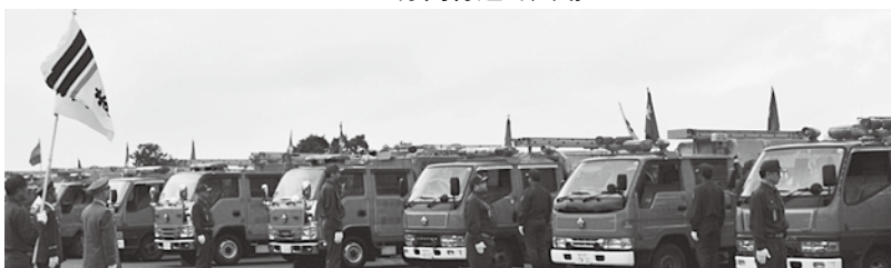
機敏な動きで機械器具点検