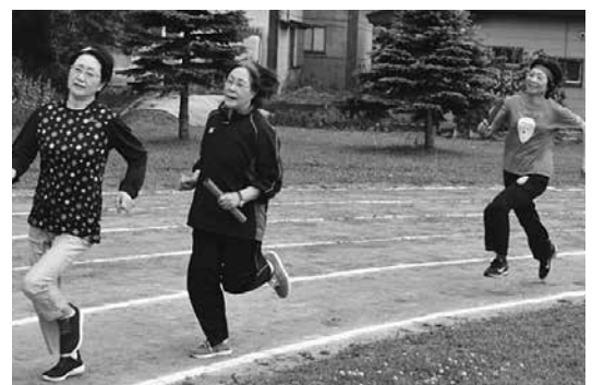
「男女年齢別対抗リレー」