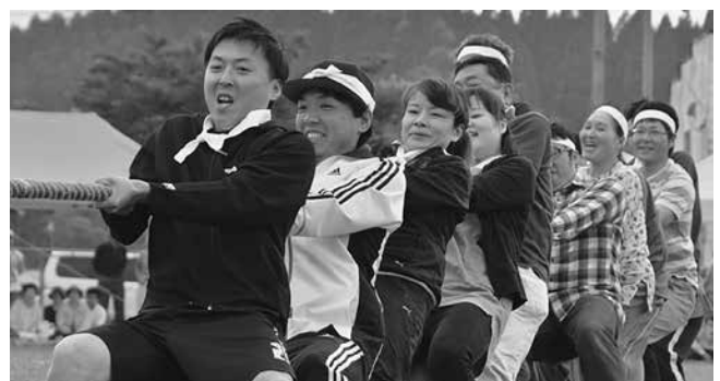
一進一退の攻防が繰り広げられた「綱引き」