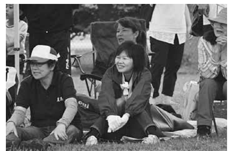
結果を見守ります