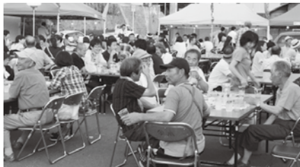
多数の来場者で賑わいました

会場に訪れた方々は、冷たい飲み物や焼鳥等を食べながら、家族や友人らと楽しい時間を過ごしていました。