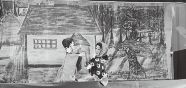
今回も大好評をいただいた「金多豆蔵人形劇」

「金多豆蔵人形芝居」は中泊町無形民俗文化財に指定されており、大好評をいただいた昨年に続き2回目の開催となった今年も、多数の方々にご来場いただき、駅改札口のコンコースは埋め尽くされました。「金多」と「豆蔵」の津軽弁で繰り広げられる人形劇や津軽民謡が披露されると、会場内からは笑いと歓声があがるなど楽しい公演となりました。