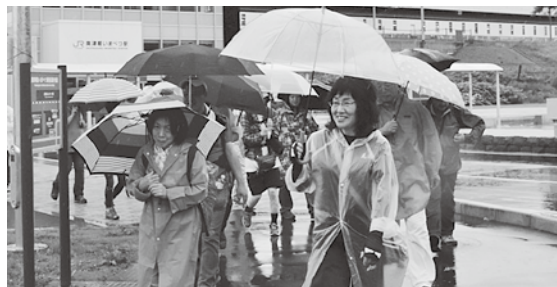
「奥津軽いまべつ駅」をスタートする参加者ら

また、立ち寄った「荒馬の里資料館」ではあづべ汁の振る舞いや、郷土芸能「荒馬」の披露が行われ、参加したみなさんはとても充実した一日を過ごしていました。