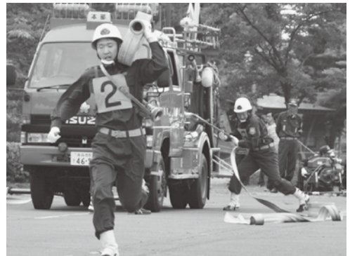
本部分団によるポンプ車操法