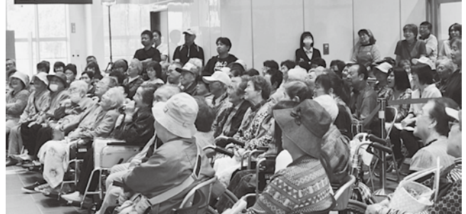
多数の来場者で駅舎内は笑いに包まれました