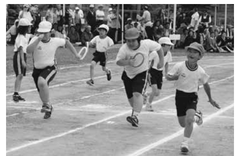
「小学生男女混合リレー」

「小学生男女混合リレー」、年齢別対抗リレー」では最終種目ということもあり、各チームともに最後まで一生懸命走り、バトンをつないでいました。 1年ぶりに開催された「ふれあい運動会」もお陰さまで大盛況のうちに終えることができました。 その後、各地区において懇親会が行われ、さらに交流を深められました。