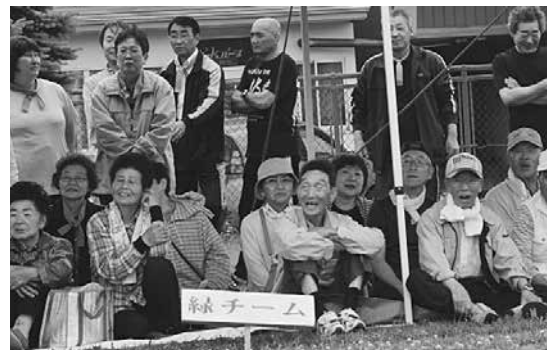
応援にも熱が入ります

「綱引き」では各チームとも一進一退の攻防が繰り広げられ、会場は大盛り上がりとなりました。 草の上での競技ということもあり、滑って転ぶ選手もいましたが、応援に駆けつけた町民のみなさんからは大きな声援が送られていました。