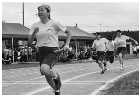
「男女年齢別対抗リレー」