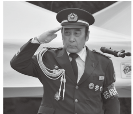
指揮をとる小山内団長