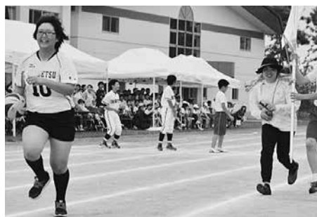
「部活動対抗リレー」(中学生)

中学生による「部活動対抗リレー」では各部活のユニフォームやボール等を使用した競技となり、個性的な走者が登場するなど会場は笑いに包まれました。