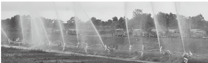
各分団による一斉放水訓練