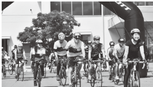
一斉にスタートする参加者

また前日16日には同会場で前夜祭も行われ、「奥津軽和牛肉牛愛好会」の皆さんによる牛肉の販売や、ステージイベント等で大いに盛り上がりました。