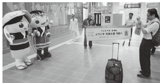
おもてなしをする「あらまくん・たずなちゃん」

7月から9月にかけて行われる日本最大規模の観光キャンペーン「青森県・函館観光キャンペーン（アフターDC）」が開催されるにあたり、7月1日、奥津軽いまべつ駅においてお出迎えイベントが実施されました。今別町新幹線開業PRイベント実行委員会、今別町観光応援隊の皆さんや町のゆるキャラ「あらまくん・たずなちゃん」も駆けつけ、「ようこそ荒馬の里今別へ」と書かれた横断幕でお出迎えし、町パンフレットの配布、記念撮影等で来訪者を温かくおもてなしをしました。