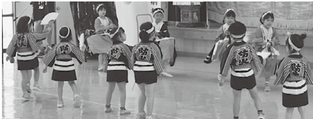
可愛らしい「荒馬」を披露する今別こども園の園児ら

7月18日、今別町開発センターにおいて「平成29年度外ヶ浜地区交通・地域安全総決起大会」が開催されました。会場には今別こども園の他に今別小学校の児童、町民の方も参加し交通安全や防犯に対する意識を高めました。