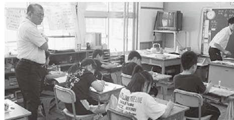
児童も先生も真剣です

7月7日、中学校の先生方が小学校の授業を参観し、研究会を行いました。今回の連携事業を機に職員全員が共通理解した教育活動を展開していくことにしています。