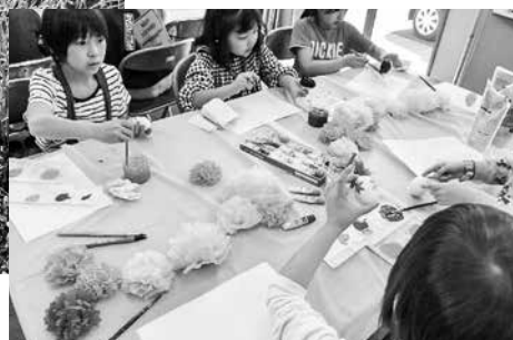
▼思い思いの絵を描く