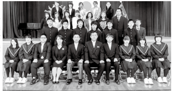
▶青森北高校 今別校舎入学式