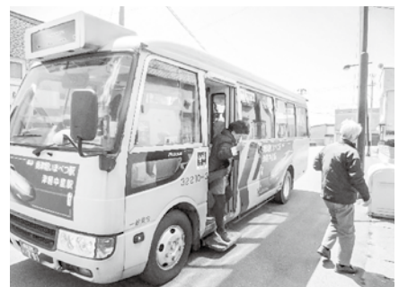
奥津軽いまべつ駅・津軽中里駅間バス「あらかま号」