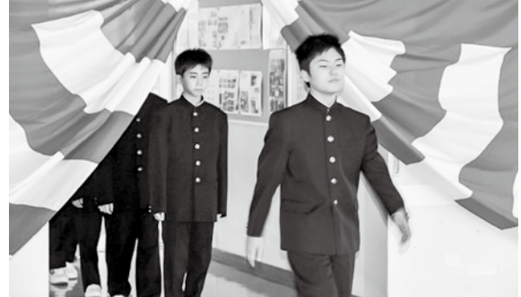
◀今別中学校入学式