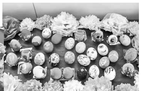
▲それぞれの個性が光る作品