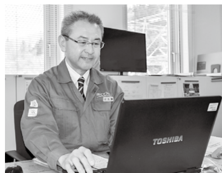
明るい人柄で今別ネットワークセンターをまとめています。

北海道電力としては、初めて本州で電力設備を建設し仕事をさせていただくので、大きな緊張感をもって今別町にやって来ました。しかし、町民の皆さんに優しくしてもらったり、顔を覚えていただいて、今ではとても過ごしやすいです。食に関しては、ご縁あって町内のご家庭でいただいた「若生ごはん」がとても美味しかったですね。