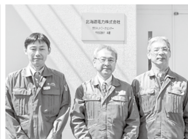
(左から)長嶺変電課長、佐藤所長、栗原送電課長▲