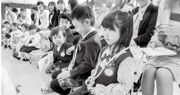
◀今別こども園入園式

夢と希望で胸をふくらませた新入生が、真新しい洋服や制服に袖を通し、初々しく爽やかな足取りで入学式に臨みました。