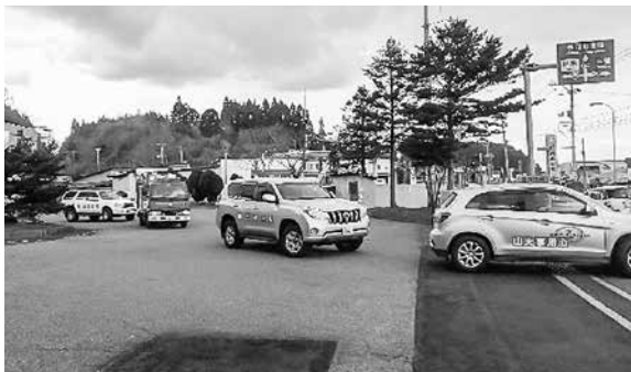
▶隊列を組みパレード

4月11日（木）、東青地区山火事防止協議会が主催する平成31年度山火事防止パレードが開催され、これからの時期に発生しやすい山火事の防止を呼びかけました。当町からは山火事防止のステッカーを貼った公用車と今別町消防団本部分団の指揮車が出動し、青森地域広域事務組合消防本部や他町村の車両など、合計8台の車両で町内をパレードしました。