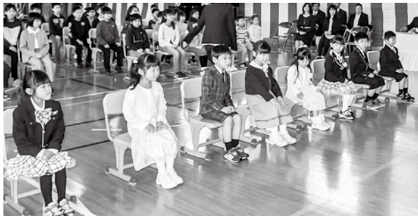
▶今別小学校入学式