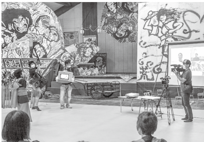
▲カメラを通しての再会