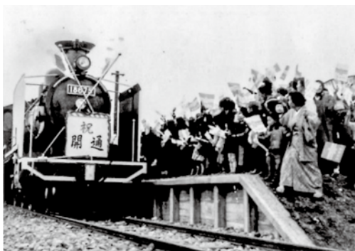
▲津軽線今別駅に初列車が到着。小躍りする町民たち (写真提供：今別小学校・昭和33年10月21日)

昭和33年に入った。「何と言つてもこの年は『陸の孤島にサヨウナラ』の津軽線全線開通よね。よくおばさんから聞いたわ」 興奮冷めやらぬ蒔絵がわめいた。 10月21日に津軽線が全線開通した。この開通をにらんで商工業者が観光客を当て込んだ家の増改築ラッシュに湧いた。確かに開通後は観光客が増えた。上磯最大の町で