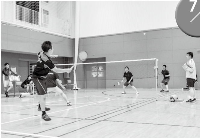
▲息を呑むほどの壮絶なラリーが繰り上げられる！