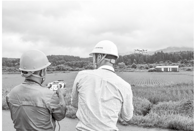
▲「落とさないでくださいね…？」

ドローンを導入することにより、農業従事者の負担軽減や農薬散布の効率化が期待されます。