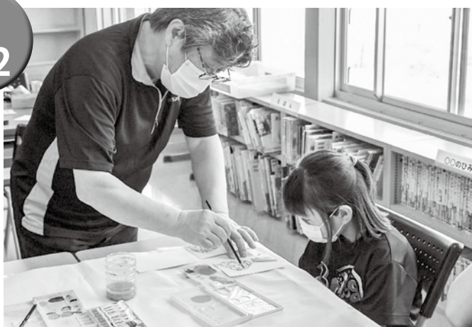
▲講師の技を習得しようと真剣な表情