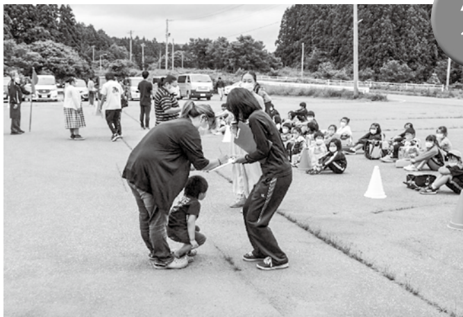
▲保護者引き渡し訓練の様子