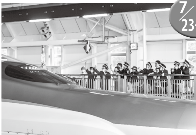
▲みんなで新幹線をお出迎え！