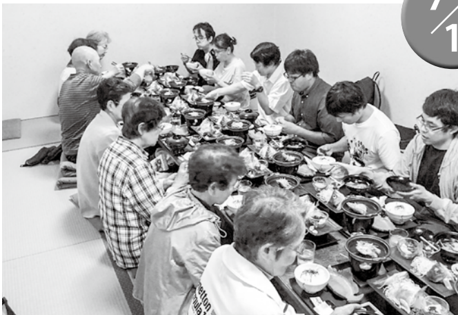
▲美味しそうなメバル膳を囲む参加者