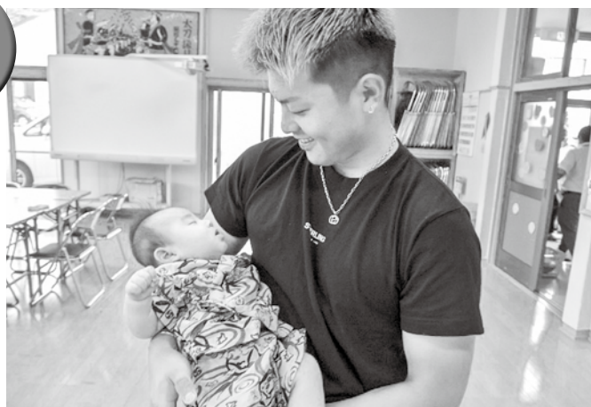
▲親子ともに充実した時間を過ごしました