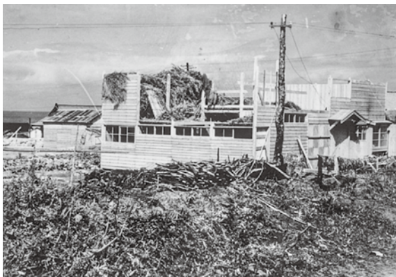
▲昭和29年9月26日、台風15号が今別を襲う。台風が去った後の山の付近の様子。役場庁舎らしき建物が見える

時は昭和34年。5年前の昭和29年5月11日の今別村大火により役場、青森工業高校今別分校、法務局出張所、大仏堂が焼失した。大仏堂は今の今別観音堂の向かい、元今別保育園の辺りにあった。4年後の昭和33年12月24日、今別小学校・今別中学校併置校舎が失火により焼失。この火事により焼失した今別小・中学校の新築を巡って町議会がもめていたが、昭和