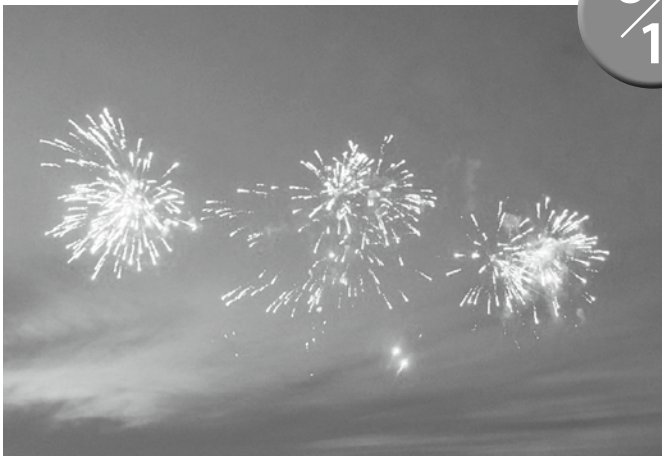
▲華麗な花火が夜空に打ち上げられました

さざなみ公園付近の海岸において、サプライズで花火が約10分間打ち上げられました。この打ち上げ花火は今別町観光協会が荒馬まつりの中止に伴い、花火大会も中止となったことから「町民の皆さんに花火を見せたい！」と企画したものです。密集を避けるために打ち上げ場所は告知されませんでした。当日は多くの町民が楽しそうに花火を眺めていました。