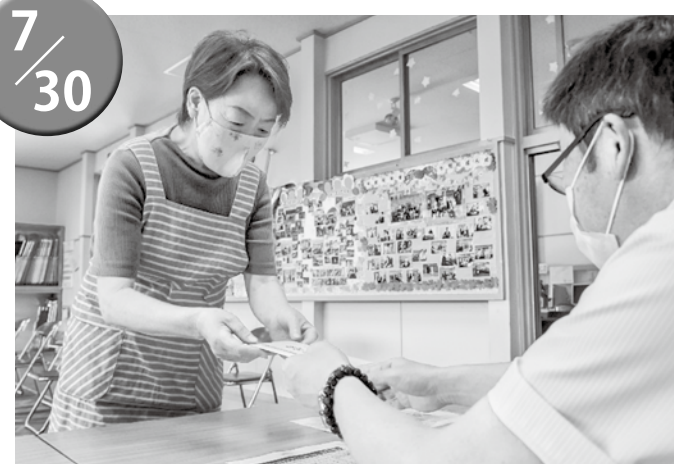
▲1人につき1万円分の商品券が交付されました