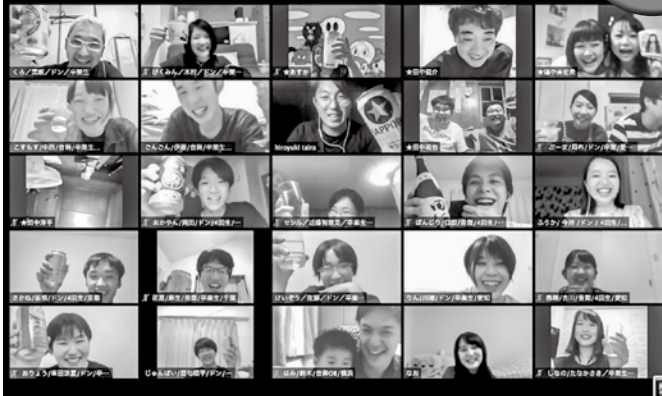
▲当日の交流会の様子

荒馬まつりにやってくる県外の大学生や卒業生（関係人口）と大川平荒馬保存会がWeb会議システム「Zoom」を使って3時間程度のオンライン交流会を行いました。このオンライン交流会は毎年大川平地区で荒馬の運行が終了した際に催される交流会の代替として開催されたものです。交流会ではお互いの現状や来年の荒馬まつりのことなどについて語り合いました。