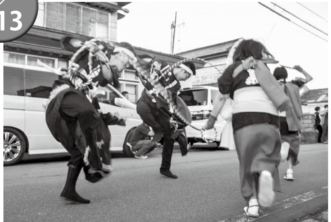
▲少人数での運行でしたが大いに盛り上がりました

新型コロナウイルス感染症対策で密集を避けるために事前告知はされませんでした。住民は太鼓の音が聞こえると家から出て荒馬を楽しんでいました。