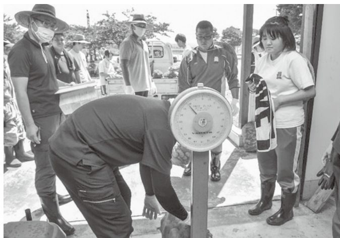
▲固唾を飲んで重量を量ります…

生徒達は収穫後、各班毎にじゃがいもの重さを量り、荒馬の里活性化センターの中で豚汁を食べ、農園実習は終了しました。