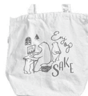
▲依田さんがデザインした トートバッグ

まず、依頼をいただければ仕事ができない仕事なので、常に結果を出さなければいけないのが大変です。お金をいただいて仕事をするので、私がパッケージ等のデザインを手がけてから売れなくなった…ということになれば次はありません。しかし、お客様が自分が作ったものを気に入ってくれたり、私がデザインしたものが売れたという話を聞くと安心しますし、やりがいがあったと感じます。