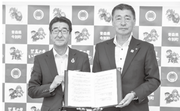
▲左から青森農協雪田代表理事組合長・中嶋町長