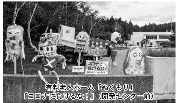
有料老人ホーム「ぬくもり」 「コロナに負けるな!」(開発センター前)