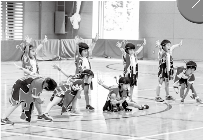
▲「ソイヤ!!」決めポーズもバッチリ！

いまべつ総合体育館において「今別こども園ふれあい運動会」が開催され、園児たちが元気に走り回りました。今回の運動会は新型コロナウイルス感染症対策のため、競技時間を短縮して開催し、約1時間半の日程となりました。