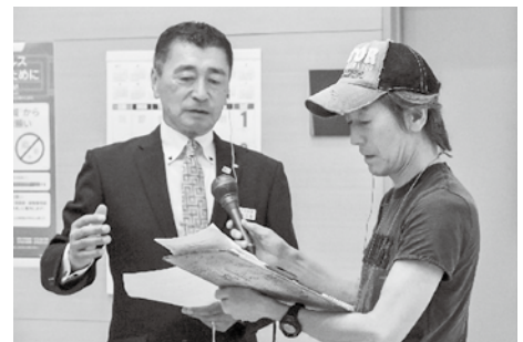
▲様々なメディアにも取り上げられました

また、いくら災害が少ないとはいえ、高齢者の多い当町ではしっかりと計画のもと避難訓練も実施していかなければならないと思っております。