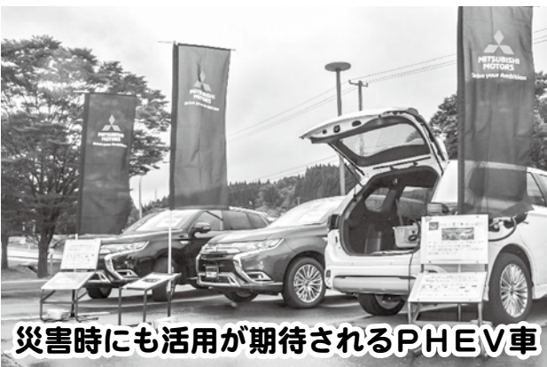
災害時にも活用が期待されるPHEV車

ダンボールを使用したベッドは組み立てが簡単で、通常は文書の収納用品であるため場所をとりません。また、災害備蓄用マットレスは反発性、耐久性、通気性等が良いことから、クッション材として優れています。寝返りが楽であり、夏は蒸れず、冬は暖かいことが特徴です。普段は真空パックしているので、収納にも場所をとりません。