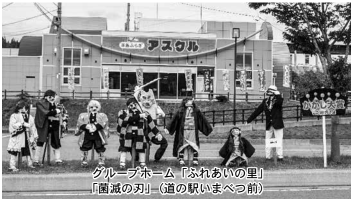
グループホーム「ふれあいの里」 「菌滅の刃」(道の駅いまべつ前)