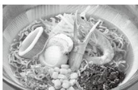
◆海峡ラーメン 880円 (塩・味噌・醤油)

●写真はイメージです。●料金表示は全て税込みです。 ●料理内容は変更になる場合がございます。あらかじめご了承ください。 ●土・日曜日、連休は混雑致しますので、お席予約をお願い致します。