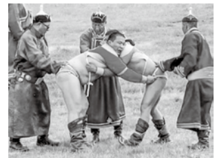
▲モンゴルの相撲(ブフ)

それでは、町民の皆さん、これから段々寒くなりますのでお体に気を付けてお過ごしください。ごきげんよう~