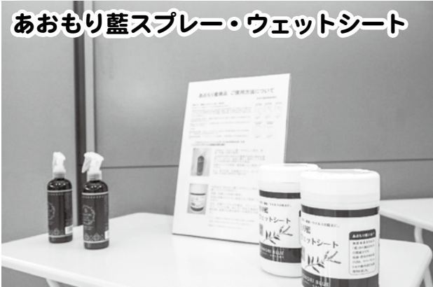
あおり藍スプレー・ウェットシート

農薬不使用の「あおり藍」から抽出した天然成分での抗菌消臭ができるスプレーとウェットシート。