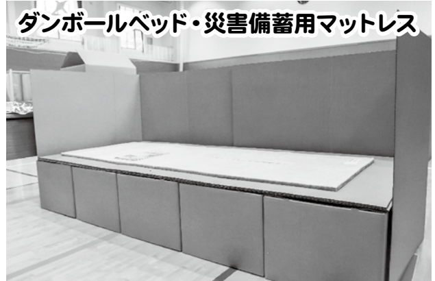
ダンボールベッド・災害備蓄用マットレス

ダンボールを使用したベッドは組み立てが簡単で、通常は文書の収納用品であるため場所をとりません。また、災害備蓄用マットレスは反発性、耐久性、通気性等が良いことから、クッション材として優れています。寝返りが楽であり、夏は蒸れず、冬は暖かいことが特徴です。普段は真空パックしているので、収納にも場所をとりません。