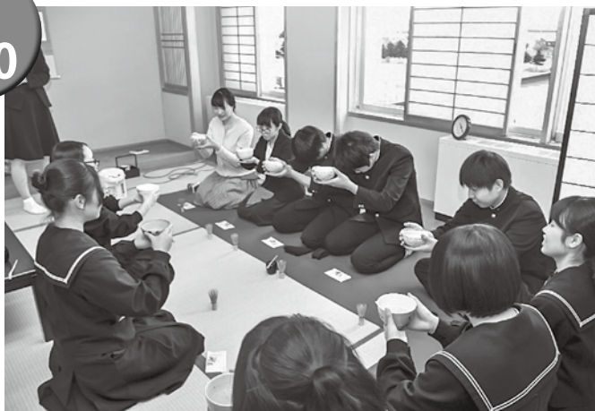
▲作法を学び、自分で点てたお茶をいただきました

来年度は今別校舎の文化祭へ本校生徒が来校し、今別校舎の茶華道部員がお点前を披露する予定です。