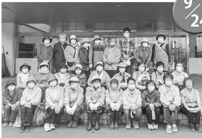
▲町を綺麗にしてくれた皆さん、お疲れさまでした