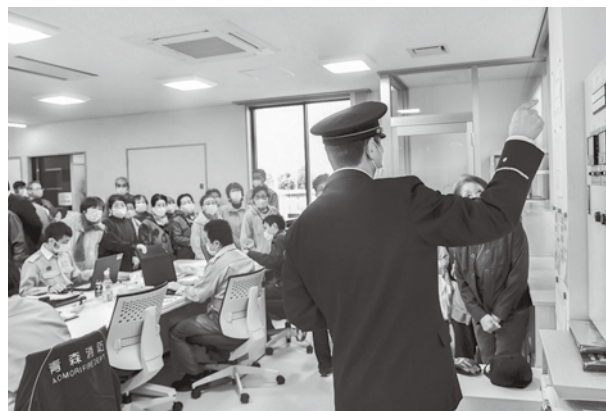
▲新今別分署の一般公開の様子。 多数の方が興味を持っていました

本施設の完成により、消防士の方々の負担軽減・災害現場への出動の迅速化がされ、これまで以上の活躍が期待されます。