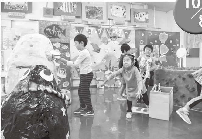
▲夢中で遊ぶ園児たち