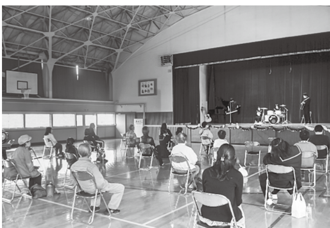
▲たくさんの方が来場しました

今年は新型コロナウイルス感染拡大防止のため、生徒が調理したものを販売する「模擬店」が中止されましたが、既製品を販売するなど工夫を凝らしていました。