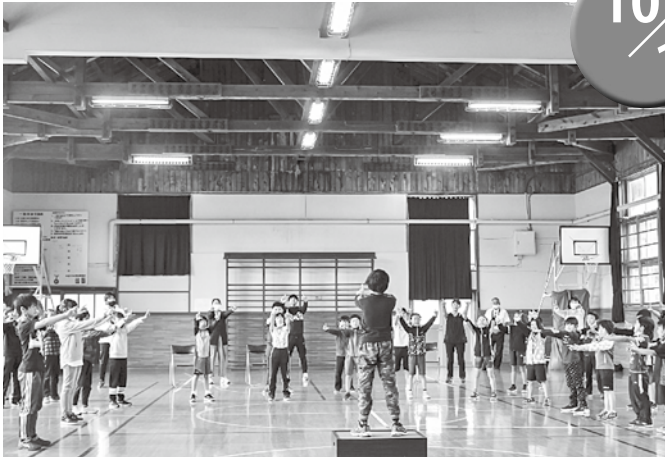
▲小・中それぞれ練習の成果を十分に発揮しました

今別小学校において、小・中合唱披露会が開催され、今別小学校・中学校の児童生徒が会場に素敵な歌声を響かせました。