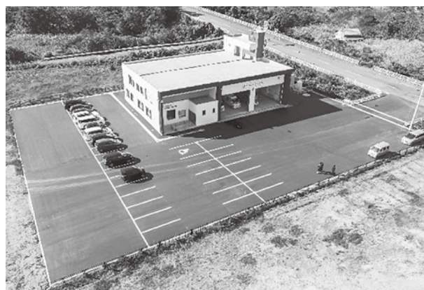
▲上空から見た今別分署。駐車場も広々としています