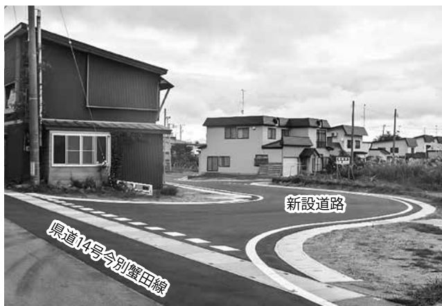
▲県道側入口の様子