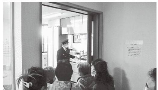
内覧会ではキッチンや仮眠室等も内覧がされた

また、小さなお子様や小学生の皆さまにも見学していただき、将来に向けて夢を膨らませていただきたいと思います。プロ野球選手やプロサッカー選手に憧れるように、消防士になりたいと思ってくれる子どもたちが出てきてくれることを期待したいと思います。