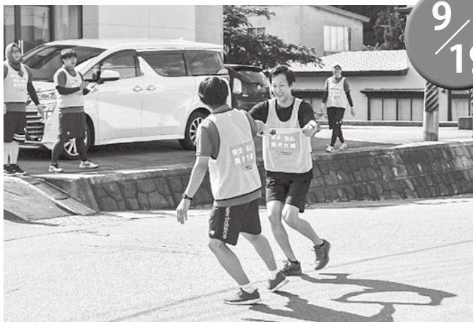
▲持前の健脚でタスキを繋ぐランナー