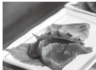
新鮮な魚のお刺身が自慢です

新型コロナウイルスが終息したら、観光客がお店に入ってきてもらえるように広報活動を頑張りたいですね。あとは今別や三厩のことを勉強して、地元で根ざしたお店にしたいです。