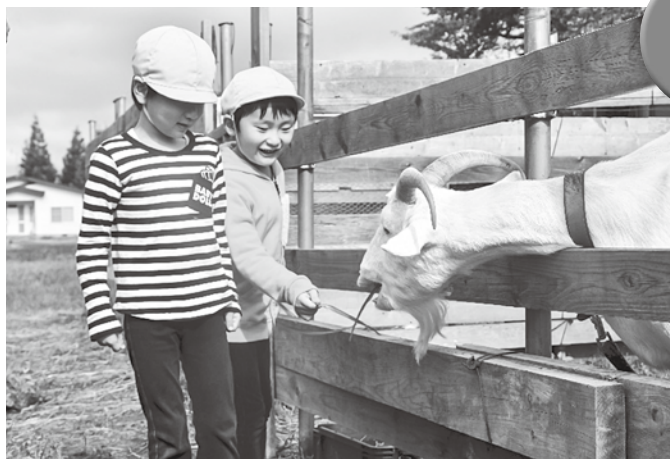
▲ヤギの大きさに驚きながらも上手にエサをあげる園児