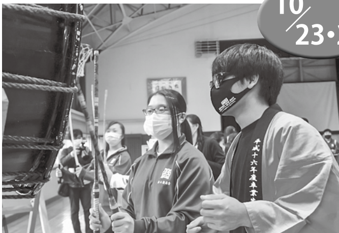
▲荒馬を通して親睦を深めました

青森北高校今別校舎が例年開催している「今高祭」について、新型コロナウイルス感染症感染拡大防止策として町内の小・中学校が一般公開を控えているなか、感染対策を十分に講じ、一般公開したうえで開催されました。