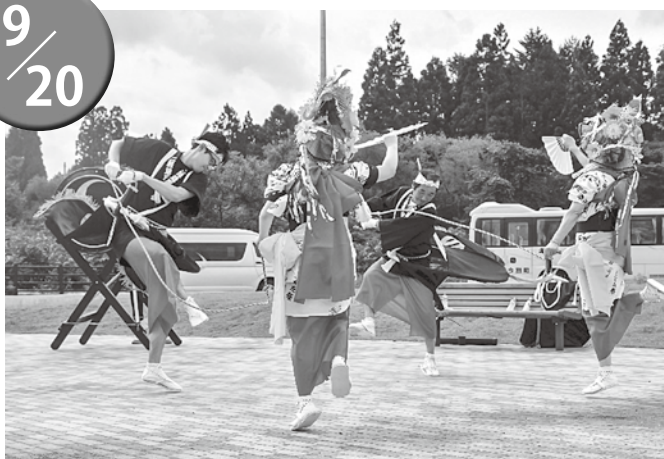
▲堂々たる演舞を披露した二股荒馬