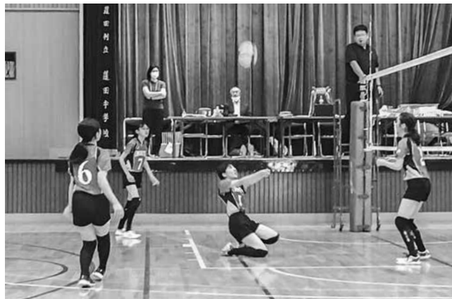
◀ 築き上げたチームワークでボールを繋ぐ