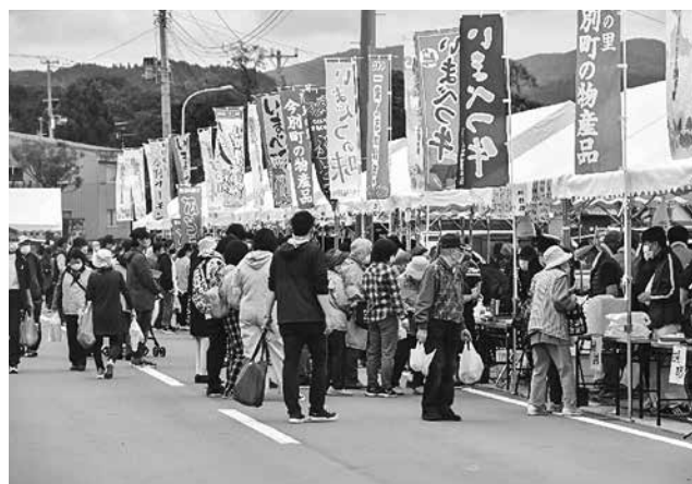
▲各店舗で大変賑わいました

9月27日(日)、海峡さざなみ公園において、「いまべつ秋の特産品販売会5670(コロナゼロ)」が開催され、大きな賑わいを見せました。当日は新型コロナウイルス感染症拡大防止のため、マスクの着用・検温・消毒を義務付け、発声を控えるように呼び掛けたうえでの開催となりました。