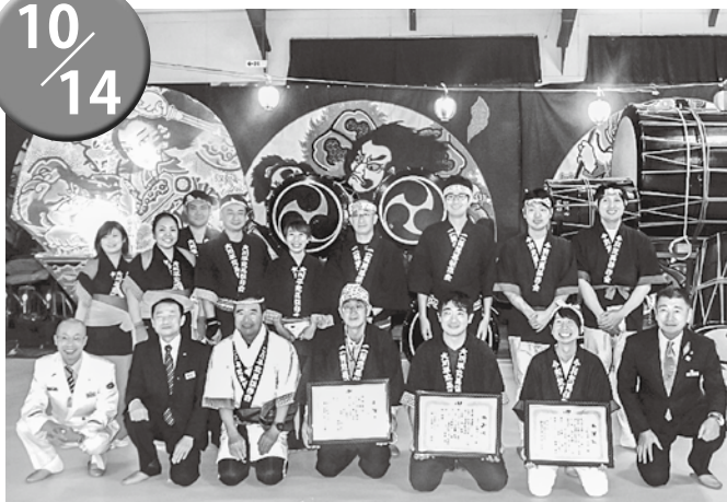
▲授与式参加者で記念撮影