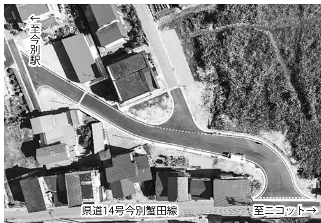
▲上空から見た新設道路

この度、八幡町地区に県道14号今別蟹田線へ通じる新設道路が完成しました。町道今別駅前1号及び2号線は道幅が狭く、両路線共に行き止まり路線のため、冬期間など有事の際には通行が困難な状況であることから、町では令和元年度より新設道路の計画及び工事に着手し、令和2年10月上旬に県道14号線へ通じる道路が完成しました。新設道路は拡幅され、更に見通しも良く、利便性だけではなく、住民の安全を守る機能を含めた緊急避難道路が完成しました。