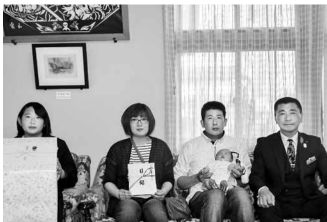
出産祝金対象者第1号