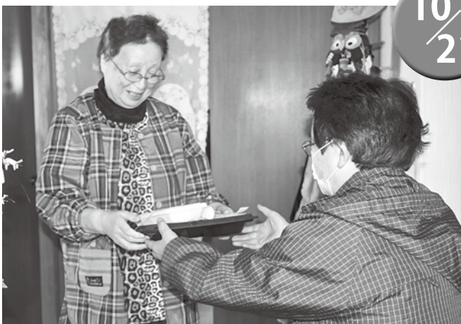
▲受け取った皆様からは「ありがとう」と声かけられました