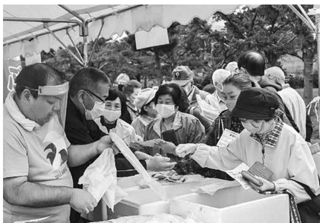
▲津軽半島今別サーモンは特に人気でした