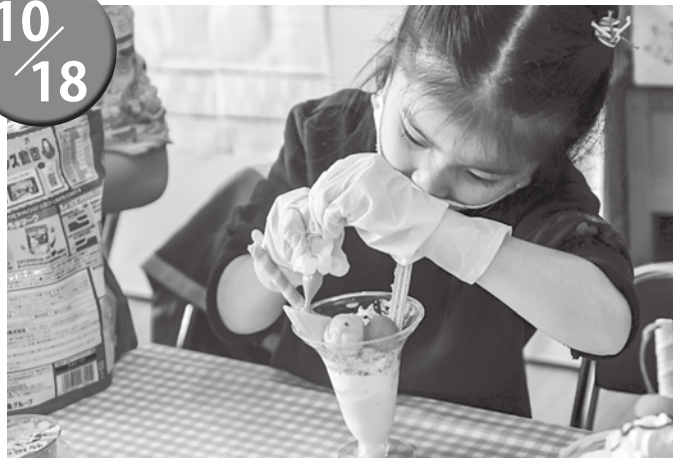
▲上手にできたかな？