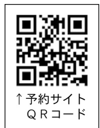
↑ 予約サイト QRコード