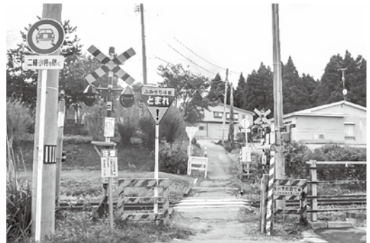
役場横の道路。踏切も二輪以外は通れないようになっている

また、役場横の道路の拡幅・踏切の拡幅・避難所となっている小学校への道路の拡幅をすることにより、車での避難が出来るようになり、町民の皆さまの安心と安全が確保できるものと思っております。現在、JR東日本との協議に入っている段階であり、まだまだご不便をおかけしているところもありますが、これから随時皆さまのご意見をいただきながら、町民の皆さまにとって必要不可欠な道路を改修してまいりたいと思っておりますので、ご理解の程よろしくお願いいたします。