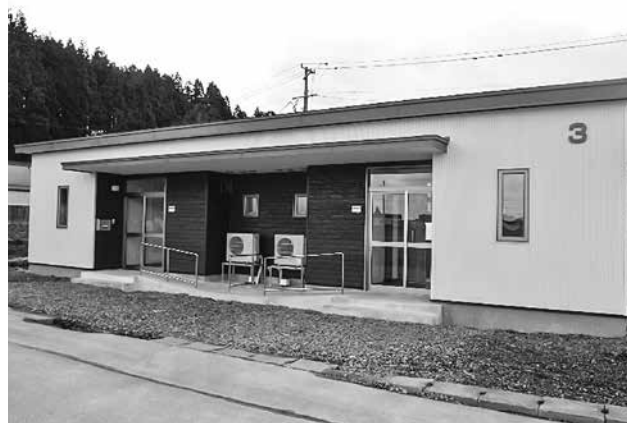
町民の皆さまが快適に生活できるように町営住宅の建替新築工事を継続して行っています（写真は3号棟）