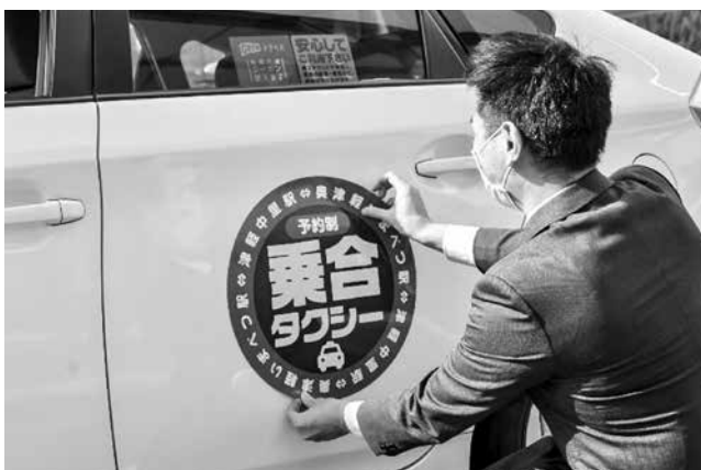
▲マグネット表示板を貼り付け、いよいよ運行開始