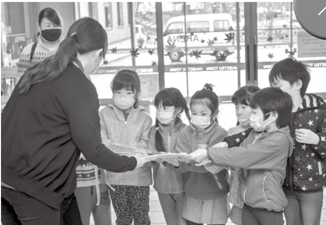
▲元気よく体育館の職員に手渡しました

今別こども園の園児9名がいまべつ総合体育館に施設訪問し、職員に「いまべつ総合体育館の皆さんお仕事頑張ってください」と元気よく手作りのカレンダーを手渡しました。カレンダーは日めくりのものとなっている他、四季それぞれのイラストも用意されており、こちらも季節ごとにめくることができるものとなっています。