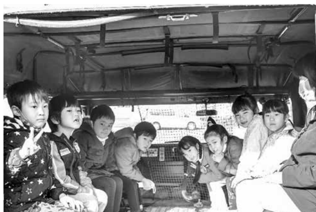
▲展示車両の座席に座ってご満悦な子どもたち

11月25日(水)、避難訓練が実施され、後町・三階町、新道・寺町地区の方々を中心に今別小学校駐車場までの避難方法・避難経路を確認しました。今回の避難訓練は大津波警報が発令された想定で、高台である今別小学校駐車場まで避難するというものです。警報発令後防災今別広報で公民館まで集まるよう指示を出し、集まった避難者の中で傷病者(歩行困難)を自衛隊員が搬送しました。その後、歩行可能な避難者は今別小学校駐車場に向かって避難をし、無事全員の避難が確認されました。