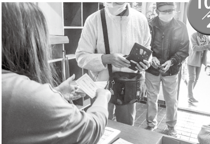
▲いつもの倍！プレミアム商品券は大好評。同月29日（木）に売り切れるほどの人気でした。