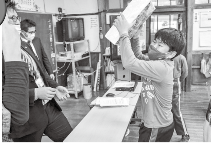
▲約10kgにもなる1億円（見本）を軽々と持つ児童に講師もびっくり！

その後は毎年恒例となった実際の1億円と同じ大きさ・重さ（およそ10kg）の見本を持ち、中には軽々と持つ児童もいるなど、楽しい租税教室となりました。