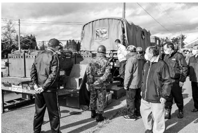
▲炊事車を興味深そうに見学する参加者の方々