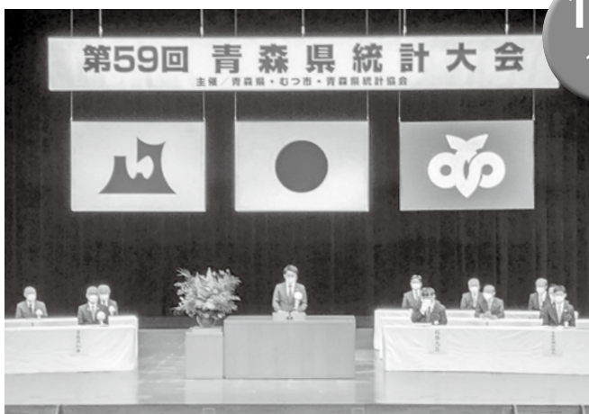
▲青森県統計大会の様子