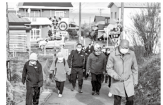
現在この踏切は二輪と小型特殊自動車以外は通れない