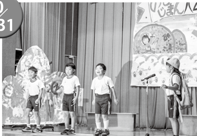
▲1年生は4人と少ない人数でも、明るく元気に発表しました。

また、今回は新型コロナウイルス感染症拡大防止のため、学年毎に保護者の入・退場の時間を決めることで「密」を避けるなど、感染拡大防止に努めていました。