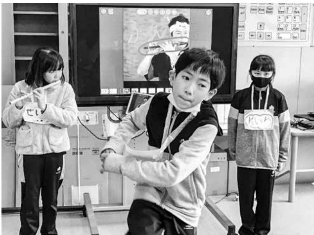
▲今別小学校では荒馬を披露！