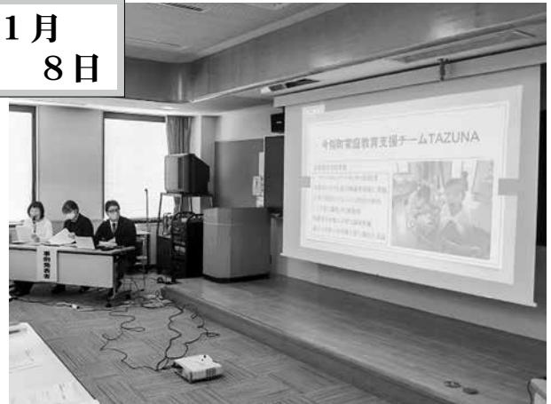
▲チーム「TAZUNA」の取組を発表しました