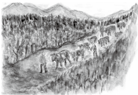
▲蟹田駅から黒毛和牛を引き連れ、小国峠を越えて今別へ入る農家のみなさん (挿絵＝小嶋俊洋さん提供)

昭和38年に入る前に一つ書き忘れていたことに気がついた。「そうよ、幻の今別牛と言われているほどめつたに口に入らない黒毛和牛よ」蒔絵が話に入ってきた。関口地区のTさんに今別のことを聞いた。20年前のことであった。黒毛和牛の導入は昭和29年、関口と二股の母沢の農家が広島牛15頭を仕入れたのが始まりだった。津軽線開通前だけに蟹田駅に引き取りに行った。それから5年後の昭和34年、今別町では畜産振興計画で『寒冷地農業振興対策実施地域』の指定を国から受けた。これは国からの牛を無償で借り受けできる制度で昭和36年までで関口開拓で10頭、山崎で16頭借り受けした。返済条件は借り受けた雌牛と同じ数を3年間に生後6か月の雌牛を国に返すという制度。子牛を返すと同時に借りた親牛が無償になる。この牛を肉牛として飼育し、生活の安定を図ろうとするもの。「そうか、これで今別牛のルーツがわかったような気がするわ」蒔絵が感心したようだ。次は、上北郡六戸町に製糖株式会社約25億円の資本を投じて工場を建設、昭和37年から操業を開始。これは青森県が米とりんご以外の畑作農業不振の打開策として誘致運動を行ったもの。