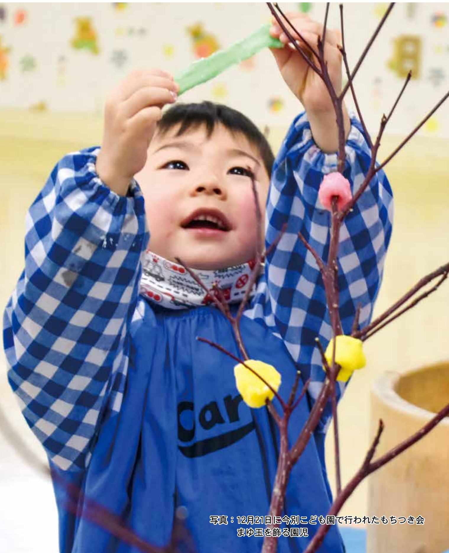
写真：12月21日に今別こども園で行われたもちつき会 まゆ玉を飾る園児