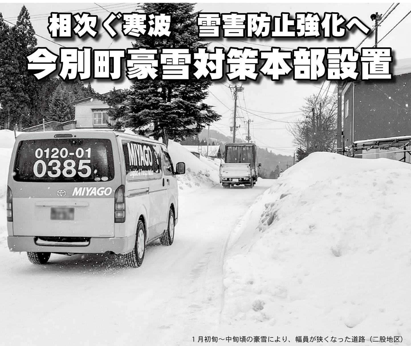
1月初旬～中旬頃の豪雪により、幅員が狭くなった道路（二股地区）