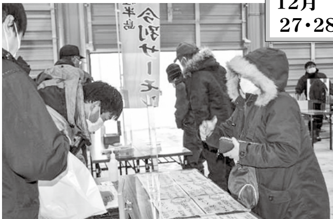
▲いまべつ牛とサーモンを買い求める来場者

令和3年12月27日(月)と28日(火)、いまべつ牛と津軽半島今別サーモンの販売会が開催されました。今回の販売会はいまべつ牛・サーモンともに約20%引きの値段で販売されたほか、購入者を対象とした抽選会も実施されました。