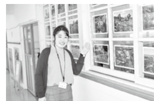
海峡の家担当吉崎主事が オススメの写真もあります

【お問い合わせ先】海峡の家ほろづき 0174-36-2166 又は 津軽海峡G.B.T.代表 090-4451-9590 まで