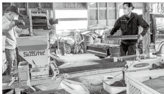
パレットを軽トラに積む様子

大掛かりな機械を使った作業ばかりかと思いきや、完成したパレットを積みハウスに並べる作業はなかなか骨が折れました。