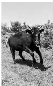
放牧地目指し走る牛

その後、獣魂慰霊祭が行われました。これまでの家畜の霊を供養し、命の恵みへの感謝と今別町和牛飼育組合員等の参列者安全祈願、並びに新型コロナウイルスの収束を平川市猿賀神社宮司に祝詞を奏上していただきました。