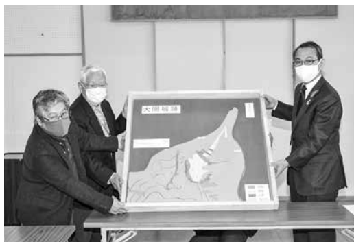
左からいまべつを語り継ぐ会小嶋さん、熊谷会長、勝野教育長