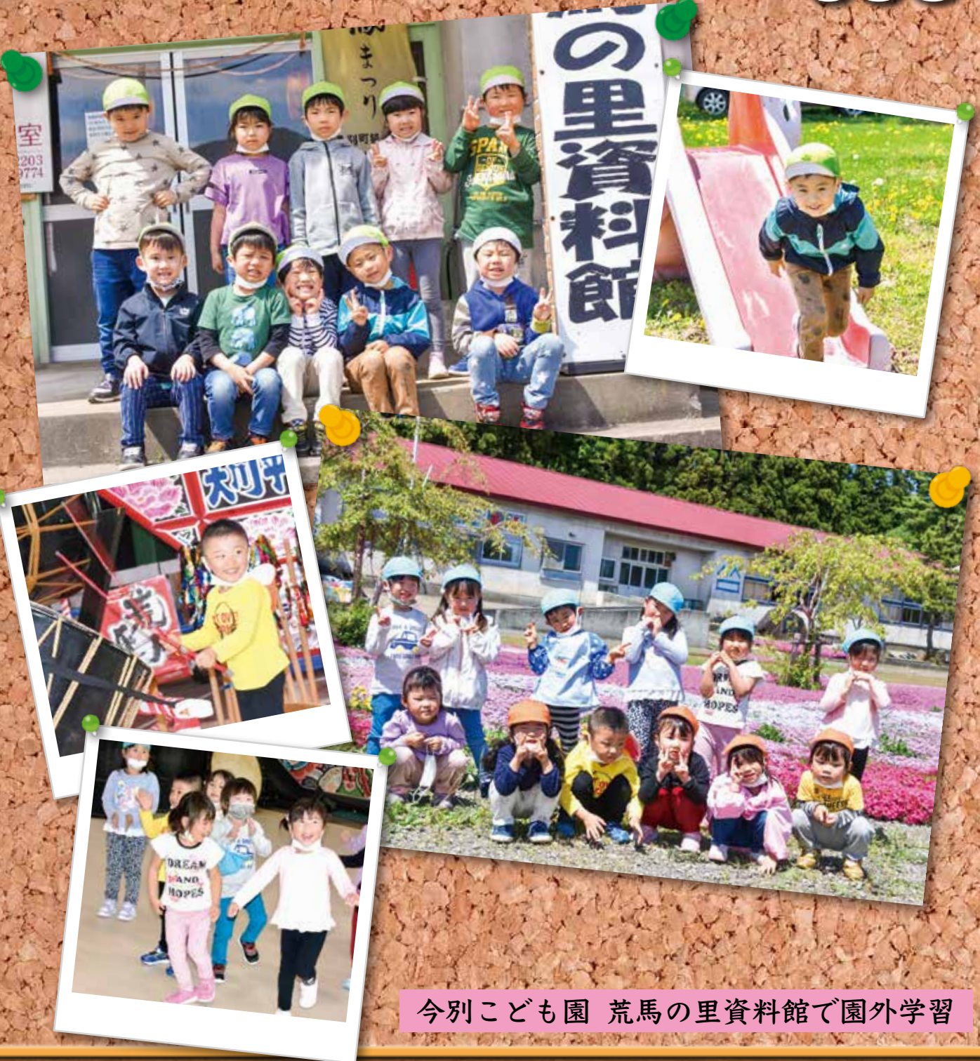
今別こども園 荒馬の里資料館で園外学習