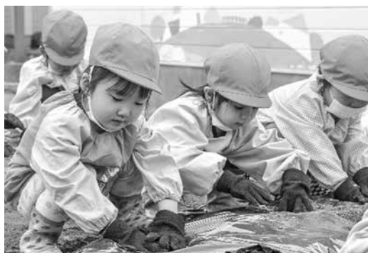
優しく土を被せる園児

大切に育てた野菜なら好き嫌いせずに食べられることでしょう。収穫するのが楽しみです。