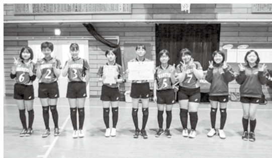
バレー部員みんなで記念撮影