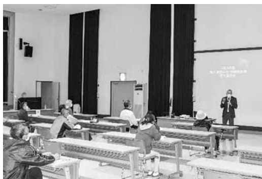
真剣に話を聞く受講者

大切に育てた作物を猿などの害獣から守るために必要な動物駆逐煙火。大きな音を立てて追い払うためのもので、正しく安全に使用するための講習を受けないと使用することができません。