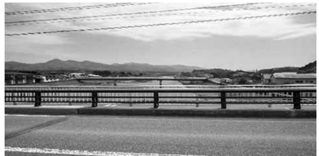
▲今別川河川改修は町民の悲願でもあった。これで災害に打ち勝つ姿勢が打ち出された——と言われている。きょうも今別川は元気だ（編集部撮影・令和4年4月25日）

※参考資料＝（広報いまべつ、いまべつ物語、東奥年鑑、今別町町制施行60周年記念誌）