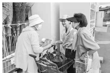
配布しながら特殊詐欺に気をつけてと声をかけました

交通安全母の会が製作したマスコットや特殊詐欺被害防止を呼びかけるパンフレットを阿部町長、外ヶ浜警察署交通課、外ヶ浜地区交通安全協会今別支部が協力し、ニコット今別店を訪れた方に配布しました。