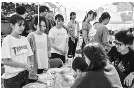
お絵かき煎餅に夢中