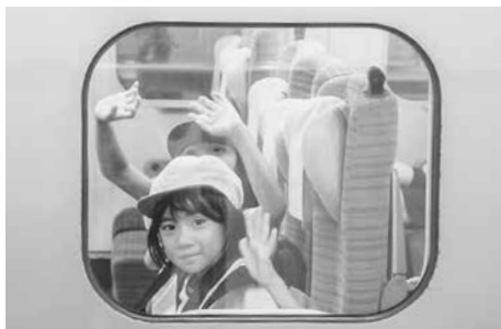
新幹線から手を振る児童