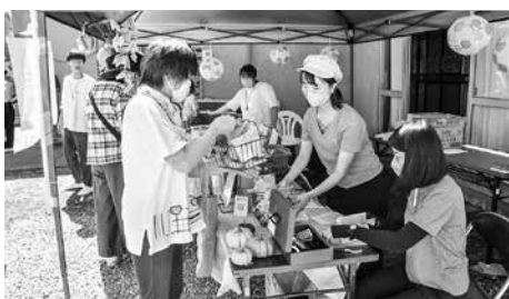
かぼちゃのお菓子を買求める来場者

販売会の会場ではお菓子の販売以外にも出店しており、青森県立保健大学の学生によるお絵かき煎餅のブースでは子どもたちが夢中になっていました。また、蓬田村産のミニトマトの詰め放題やハンドマッサージのブースもあり、大人も子どもも楽しめるイベントでした。