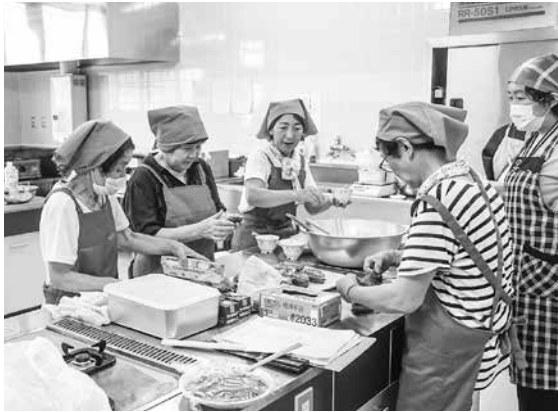
若生のおにぎりを包む 大川平加エグループの皆さん