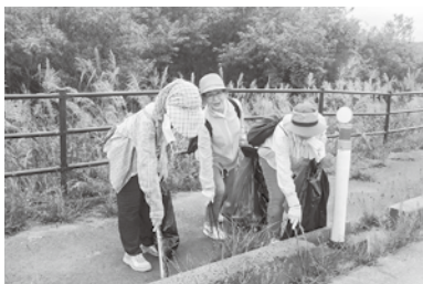
クリーン作戦の様子

9月6日、今別町ボランティア連絡協議会の会員22名が集まり「クリーン作戦」と称し、ゴミ拾いのボランティアを行いました。 清掃箇所 ① 開発センターから大川平入口 ② 開発センターからバイパス山崎線 ③ 開発センターから浜名線 ④ 奥津軽いまべつ駅から大川平線 ⑤ 大川平母沢駐車帯 町内の美しい景観のために、落ちていたゴミを隅々まで拾い、沿道をきれいにしました。 きれいな今別町を守るため、ごみのポイ捨てや不法投棄は絶対にやめましょう。