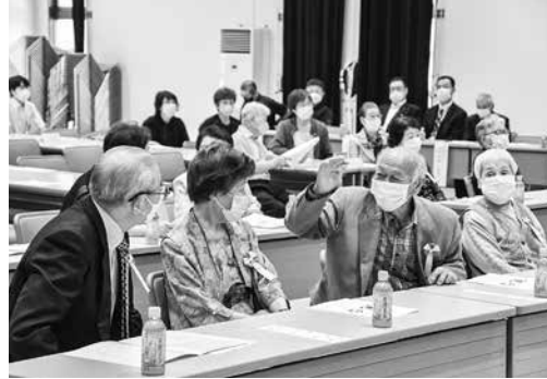
久しぶりの再会を喜ぶ