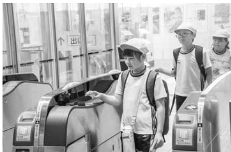
自分で買った切符で改札を通る

駅のホームでは駅員の方が実際に仕事をしている様子や新幹線を間近で見学し、今回は新青森駅までの切符を買い新幹線に乗車する体験も行われました。児童は乗車後ホームで見送りをする方々に対し、笑顔で手を振っていました。