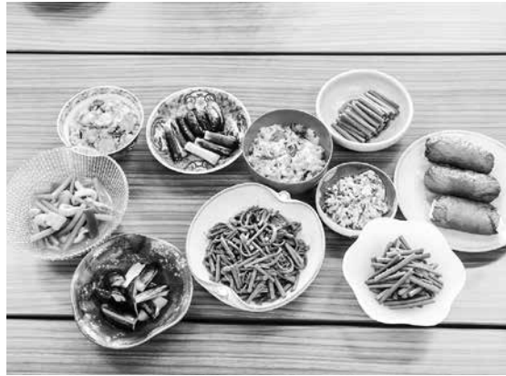
今別の郷土料理がズラリと並ぶ

作った料理の試食会も行われ、7品のうち特に昆布と焼き干しの出汁とホタテの旨味を活かした「ホタテおこわ」とクルミが入っている「ぜんまいの白和え」が美味しいという声がありました。