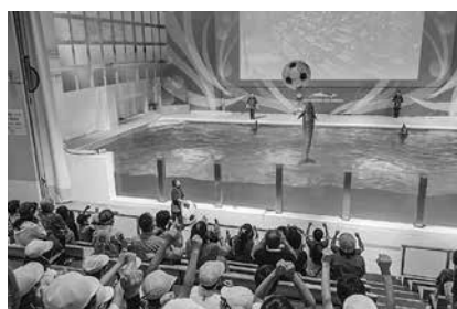
イルカショーも見学